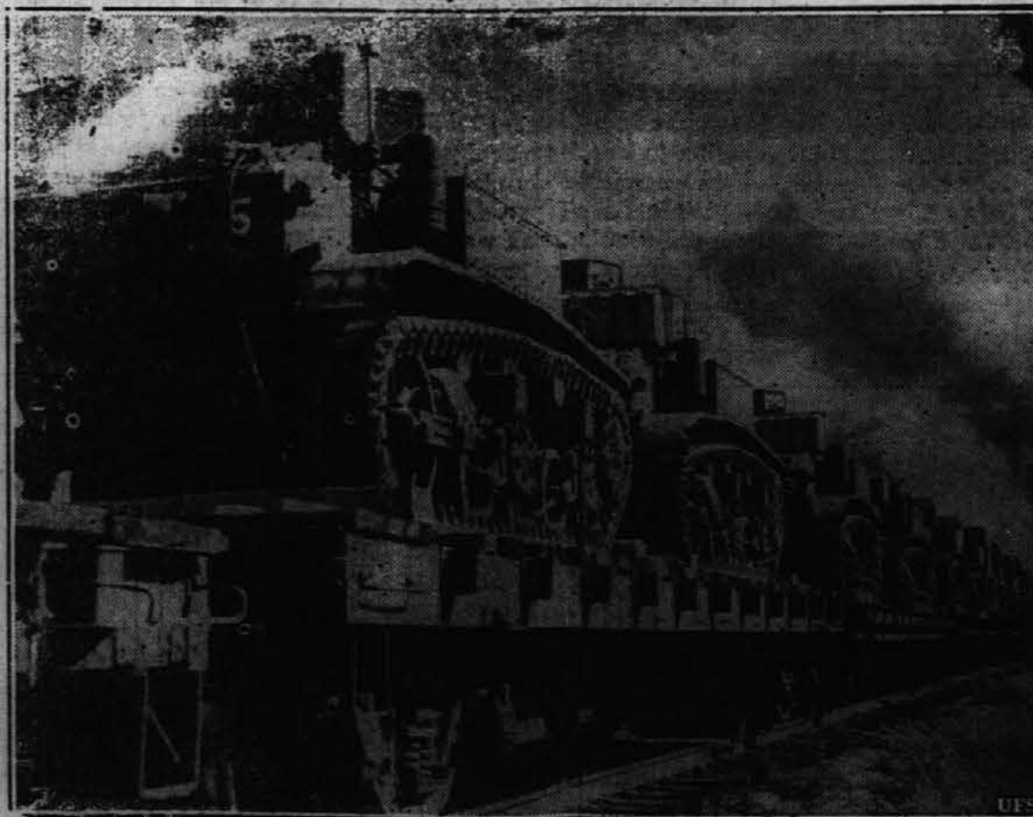
Okrog 1000 lahkih, 14 tonskih tankov se je transportiralo iz Fort Knox, Ky., v Louisiano za velike vojaške manevre, ki so se vršili tamkaj. Slika kaže nekaj takih tankov, naloženih na žel. vozove.