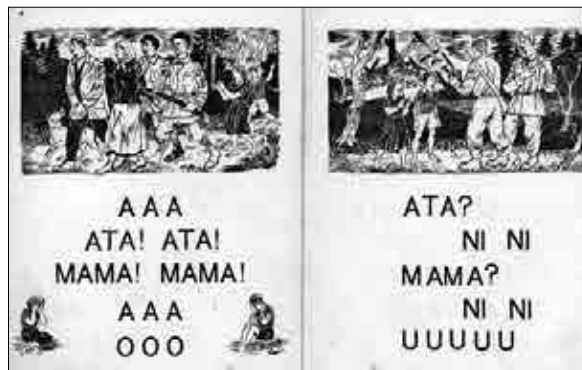
Začetnica, DZS 1945.

Ideološko pripadnost so kazali tudi napisi na šolskih stavbah in po razredih ter številni ideološki simboli in stencasi. ZVU je prepovedala izobešanje Titovih portretov in zastav z rdečo zvezdo. Zahtevala je njihovo odstranitev, pa tudi to, da se prepleskajo napisi po zidovih. Tem ukrepom so sledile hude reakcije, demonstracije in protesti. ZVU je tudi zahtevala, naj se odstranijo pomožni učitelji, to je tisti brez izobraz-be. 117 V sežanskem okraju je delovalo 21 učiteljev, od tega je bilo 6 pomožnih, ki niso bili priznani. 118