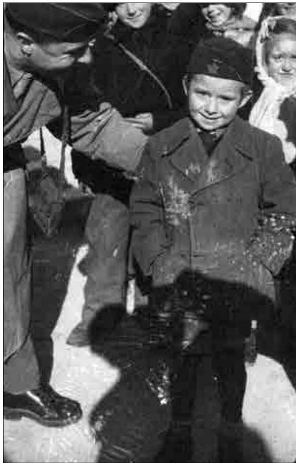
Obisk zavezniškega šolskega inšpektorja.

Redno slovensko osnovno šolo so na Repentabru po vojni obnovili v prostorih osnovne šole na Colu. V šolskem letu 1946/47 je bilo v vseh petih razredih vpisanih več kot 120 učencev. Leta 1946 je učitelje namestila ZVU, s čimer so se začele velike težave. Že 18. oktobra so vaščani spodili dve učiteljici in nasprotovali enemu učitelju. Zavezniki so šolo začasno zaprli. Čez nekaj mesecev so namestili druge učitelje. Toda v šolo so prišli trije moški in učiteljem grozili, nato pa so jih domačini spodili, ker nočejo beguncev iz Jugoslavije. Šola je bila spet za nekaj