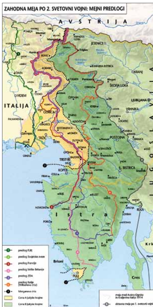
Slovensko-italijanska meja po drugi svetovni vojni (Slovenski zgodovinski atlas, str. 194).

Obnova slovenskega šolstva je potekala hitro, saj se je naslanjala na tradicijo partizanskega šolstva.