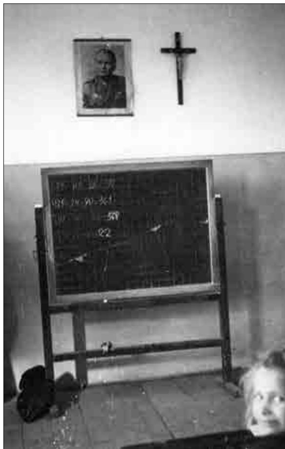
Značilna simbolna opremljenost podeželskih šol na Krasu v času ZVU.

Nasprotno pa so Italijani v krogu tržaškega šolskega skrbništva pripravili poročilo o šolskem političnem vprašanju in predstavili načrt za ustanovitev ljudskih šol s slovenskim učnim jezikom. V njem so ZVU dokazovali, da vodstvo in nadzorstvo nad slovenskim šolstvom pripadata italijanskim oblastem in