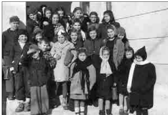
Osnovnošolski učenci na podeželski šoli na Krasu v času ZVU (brani: Ivo Jevnikar, Trst).

Zavezniška vojaška uprava je pri svojih namestitvah vztrajala le v mestnih središčih. V okoliških vaseh pa je morala popustiti in številne učitelje odpoklicati. Lokalne oblasti so nameščene učitelje nad-