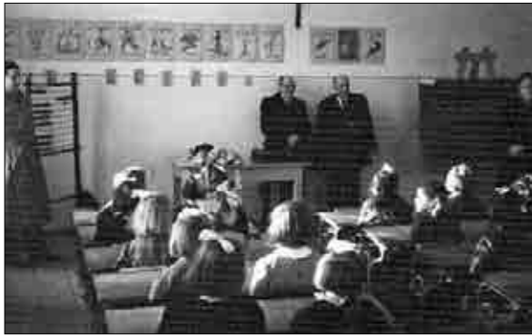
Inšpekcijski obisk zavezniškega referenta za šolstvo s spremstvom na tržaški osnovni šoli.

podati častno izjavo, da v šolah ne bodo poučevali zgodovine zadnje dobe. Prosvetna komisija je Simonovo obrazložitev s svojim komentarjem poslala podrejenim organom. 59