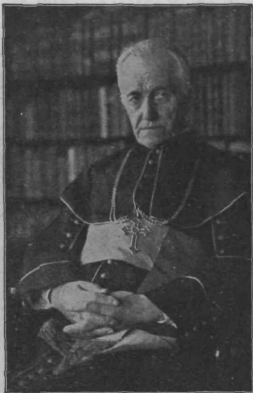
Nadškof dr. A. B. Jeglič — 60 let mašnik.

Polja se zgrinjajo v živem cvetju, vseposod Ti žgoli iz dobav: »Biserni knez, bodi zdrav, bodi zdrav!«