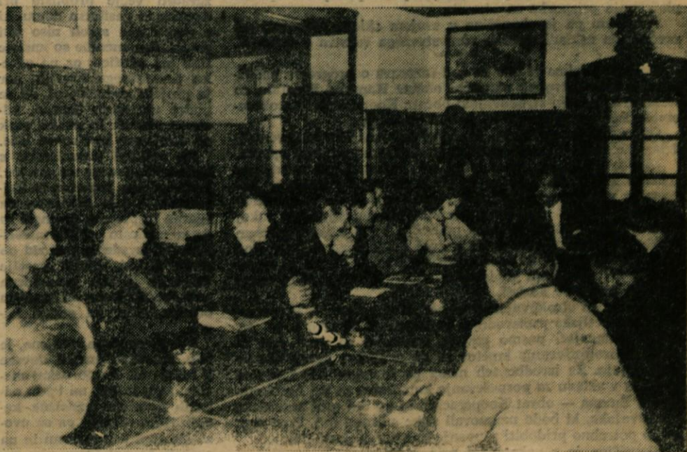
Predsedniki krajevnih organizacij SZDL na seminarju v Kamniški Bistrici