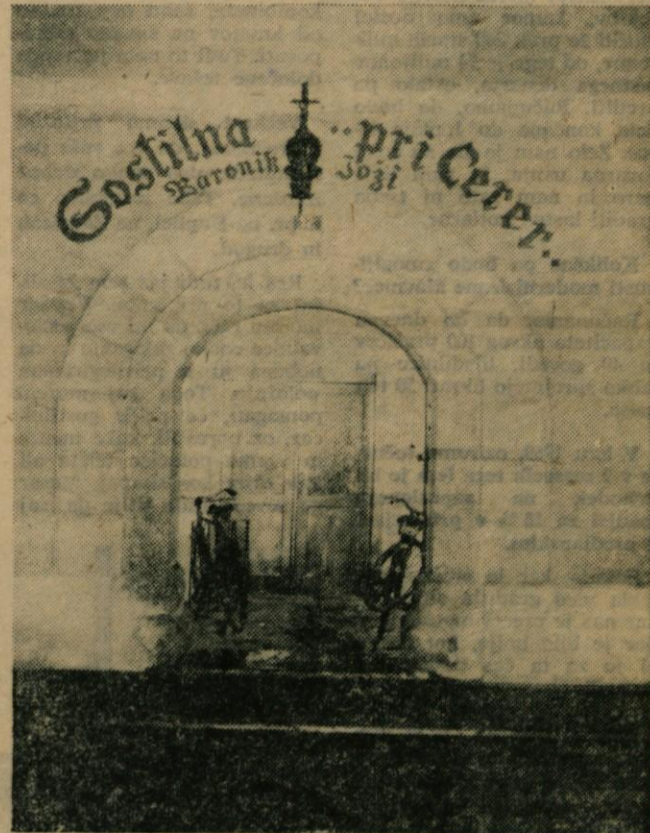
Obdorniki skupščine sprašujejo: ali je napis v gotici res edina rešitev in če je, zakaj ne bi raje rekli pri Cererju