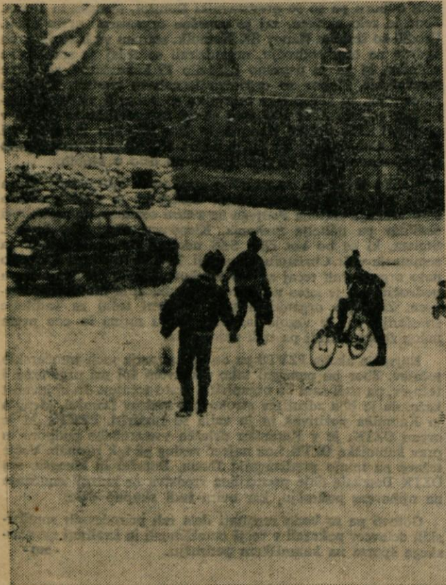
Takole drsanje ob prometnih cestah je nevarno. Na sliki: križišče ceste na Zale in Kidričeve pri Semčevem predoru

Razpotnik z osebnim avtomobilom reg. št. LJ-747-47. Ker sta bili na cesti samo dve kolesnici in sta oba voznika vozila po njih, sta zaradi zmrznjenega snega in poledenele ceste kljub zaviranju čelno trčila. Pri nesreči je nastala materialna škoda na obeh vozilih za okoli 3.500.— din.