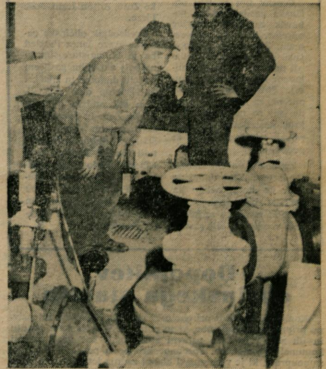
Kam uhaja voda, se ob enajstih zvečer sprašuje strojnik v črpalnici pod Skalco. Res, ni enostavno najti vseh velikih in majhnih lukenj v kamniškem vodovodnem »rešet«

Ko bo ta tečaj končan, bodo v mesecu februarju in marcu organizirali tudi predavanja po vaseh. Udeleženci tečaja pa si bodo ogledali tudi praktične rešitve pri gradnji novih hlevov in drugih gospodarskih objektov.