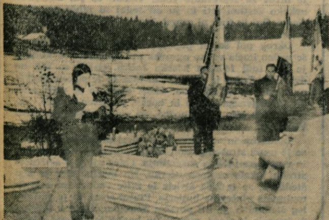
Komemoracije ob spomeniku padlih članov okrožnega komiteja KPS Kamnik v Rudniku

Pisarna Društva upokojencev in pisarna občinskega odbora Rdečega križa sta se iz dosedanjih prostorov na Titovem trgu preselili v poslopje Zdravstvenega doma. Nove prostore imata v drugem nadstropju zvažen Delavske univerze.