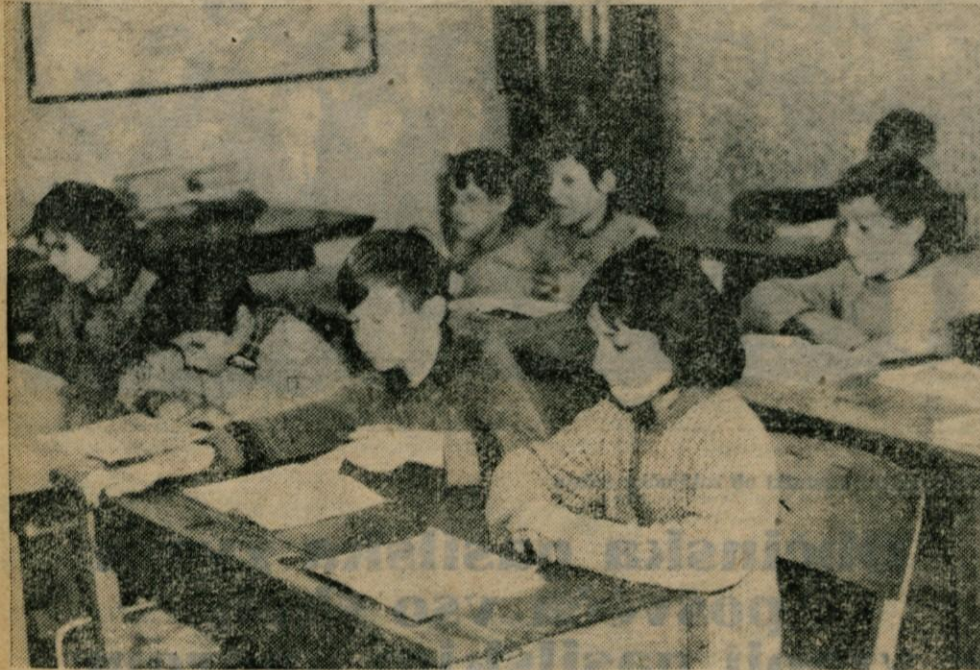
Učenci osnovne šole v Smartnem so bili darila Kočne zelo veseli. Sedaj pa čakajo, kdaj jim bo dedek Mraz prinesel vsaj eno novo učilnico. Sedaj se namreč stiskajo v dveh majhnih sobah, ki so jih predelali iz enega razreda

Kočne posnemali tudi ostali delovni kolektivi v občini in se od časa do časa spomnili učencev v šolah, nad katerimi imajo patronat.