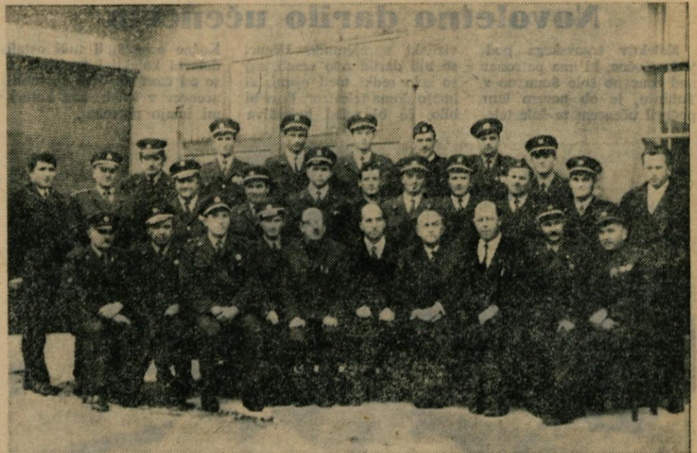
Novi gasilski častniki ob zaključku tečaja

Lani smo na tem mestu izrazili zadovoljstvo, da so bile ob novoletnem naletu snega kamniške ulice hitro očiščene in usposobljene za promet. Letos je skoro ob istem času prekrila ceste snežna brozga, s katero so vozniki radodarno škropili pročelja hiš. Očiščevalna akcija je bila prepočasna, obzirnost voznikov motornih vozil pa premajhna, da bi obvarovala hiše pred umazano brozgo, ki pušča na zidovih nezaželene sledove,