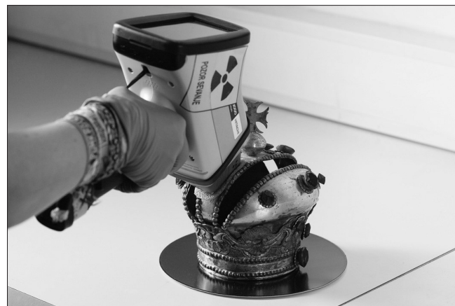
Slika 4: Naravoslovne preiskave z rentgensko fluorescenčno spektrometrijo XRF.