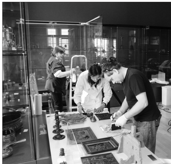
Slika 2: Primer preventivnega konserviranja – razpraševanje predmetov na stalni razstavi kovina, Narodni muzej Slovenije – Metelkova.

Kurativno konserviranje obsega vse dejavnosti, ki se izvajajo na predmetu ali skupini predmetov z namenom ustavitve trenutnih škodljivih procesov ali utrditve strukture