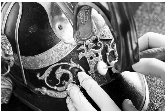
Slika 1: Konservatorsko-restavratorski posegi na čeladi iz 19. stoletja.

no in Južno Evropo«. Sčasoma se je pokazalo, da je izraz precej neroden, neprijazen do uporabnikov in neprimeren za komunikacijo s širšo javnostjo, zato je od konference v New Delhiju v angleščini znova v uporabi krovni izraz conservation , drugače pa je v francoščini, kjer je še vedno v uporabi termin conservation-restauration (Spletni vir 3).