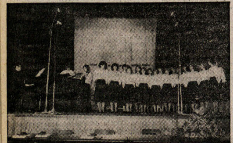
Zbor in ansambel iz Kopra