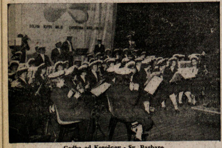
Godba od Korošcev - Sv. Barbara

V Radencih pravijo, da so že doslej vložili veliko truda in denarja v proučevanje avstrijskega tržišča