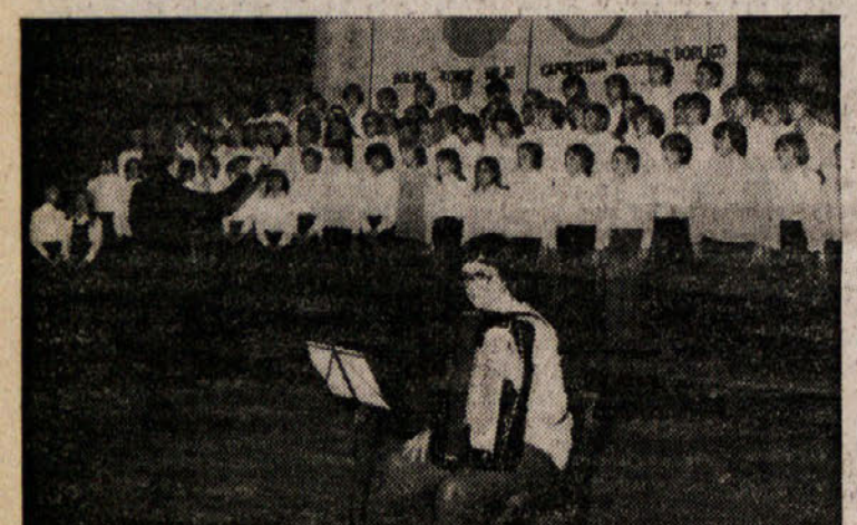
Uradno slovesnost prejšnji petek v gledališču «F. Prešern» v Boljuncu ob podpisu listine prijateljstva med občinama Dolina, Milje in Koper