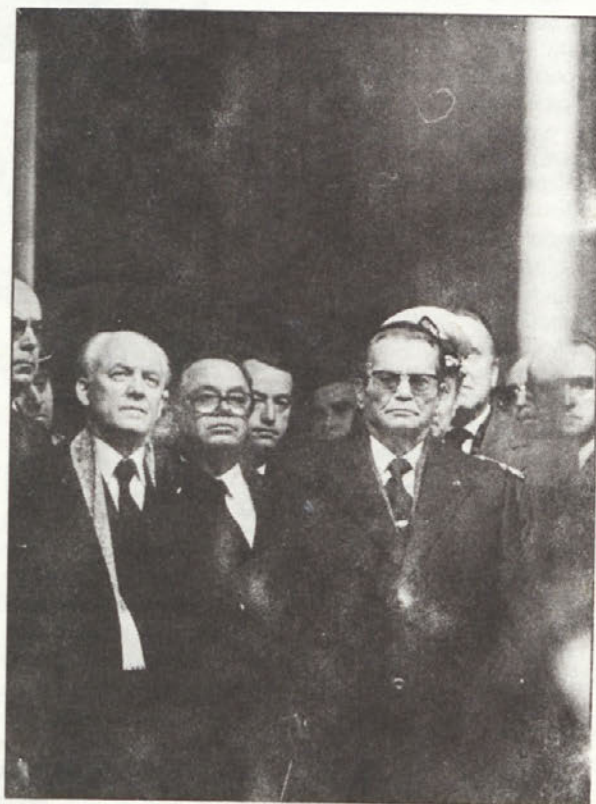
Od dolgoletnega soborca in dragega prijatelja se je poslovil tudi tovariš Tito