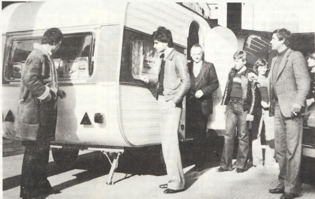
Naše prikolice so na razstavi v Titovem Užicu lani novembra tako kot povsod drugod doslej vzbudile resnično zanimanje številnih obiskovalcev.