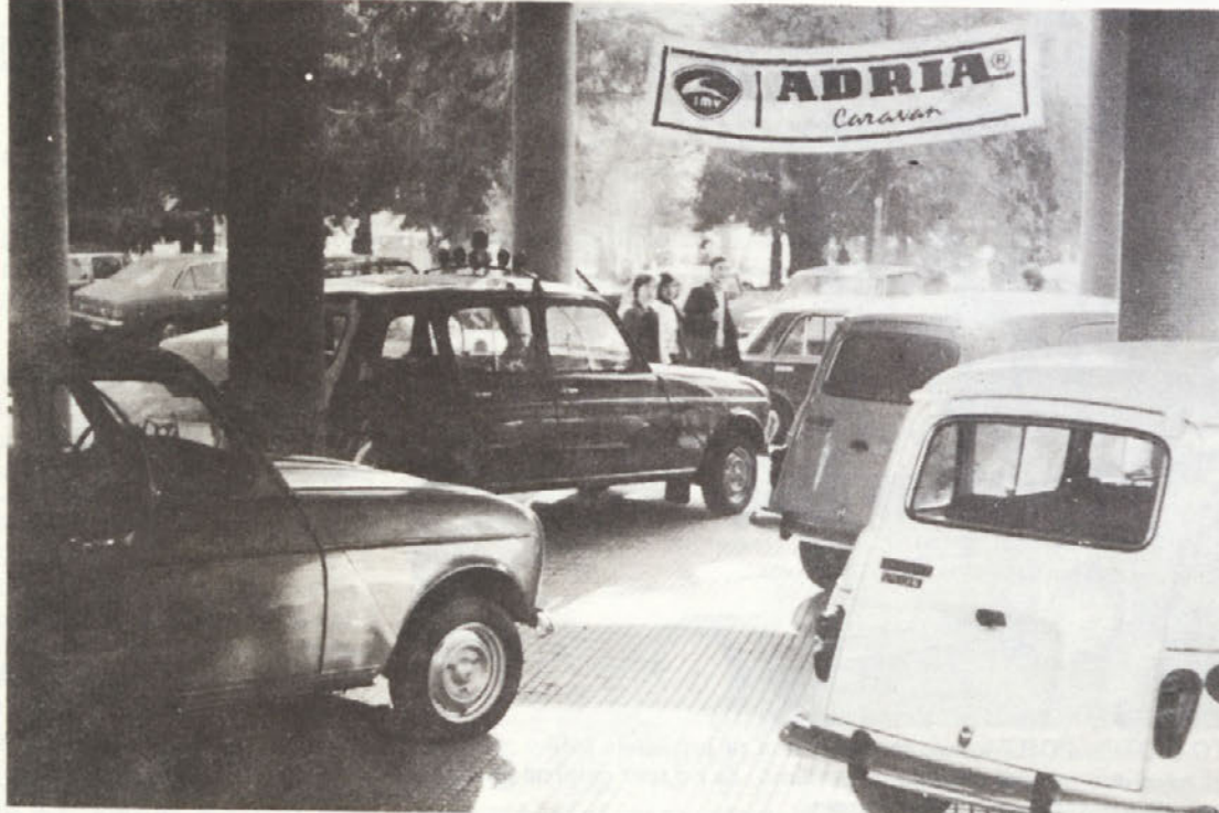
Pogled na del razstavljenih vozil na prostoru hotela Palas v Titovem Užicu, kjer je naše beograjsko prodajno skladišče organiziralo uspešno predstavitev izdelkov IMV.