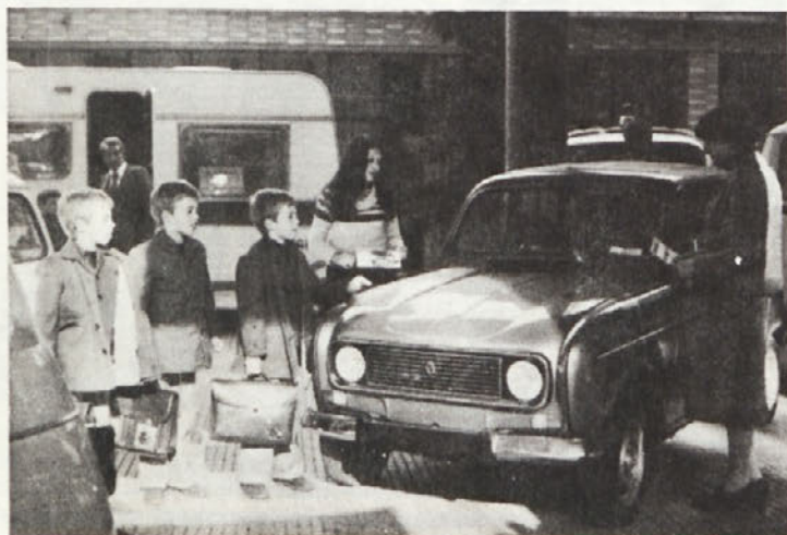
Tudi za otroški svet fantazije in radostnega pričakovanja, kaj vse bo prineslo življenje, je bila razstava naših vozil v Titovem Užicu konec minulega leta pravo razkošje. Tudi med njimi, najmlajšimi, so naši bodoči kupci in prijatelji sodobnih osebnih vozil...

Delavski sveti so na sejah v januarju sprejeli tudi spremembe in dopolnitve samoupravnega sporazuma o združitvi v Ljubljansko banko – Temeljno dolenjsko banko. Sprejeli so tudi samoupravni sporazum o oblikovanju in porabi prihodkov ter razporejanju skupnega dohodka v Ljubljanski banki – Temeljno dolenjski banki Novo mesto.