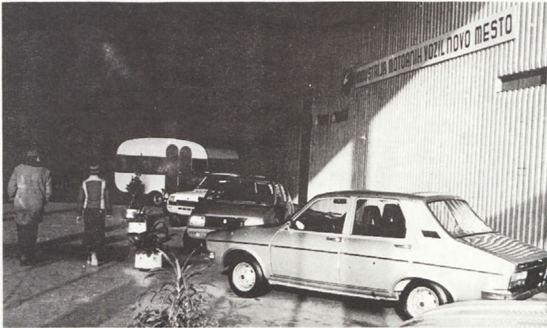
Močno osiromašena razstava AVTO MOTO ŠPORT konec lanskega leta ni pritegnila toliko gledalcev kakor prejšnje čase. Potrebne so ji osvežitve in novi prijemi, če hočemo, da bo spet deležna potrebne pozornosti. Na sliki: pogled na skupino vozil IMV v razstavnih dvorani.