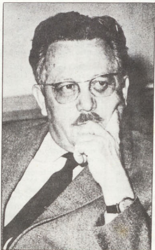
10. februarja 1979 je v Ljubljani preminil po hudi bolezni tovariš Edvard Kardelj