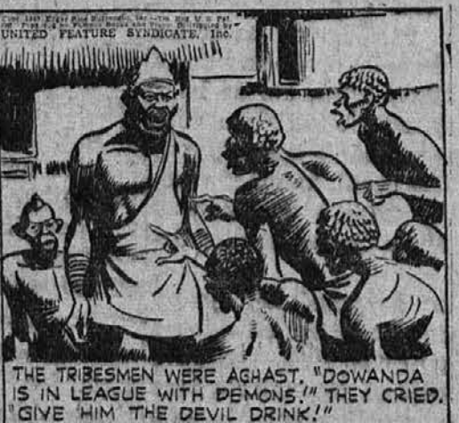
The tribesmen were aghast. "Dowanda is in league with demons!" they cried. "Give him the devil drink!"

Ko je Dowanda zapovedal da Hawqu priimejo in ga obdržijo kot talca za Tarzanovo varnost, je Hawqu vrgl zadnjo karto. Padel je kot od strele zadet na tla in se začel na vse načine zvijati. "Jaz sem začaran!" je kričal. "Dowanda, moj oče me je začaran!" Divjaki so osupli. "Dowanda je v zvezi s hudobnimi duhovi," so vpili. "Dajte mu vražje pijače!"