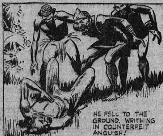
He fell to the ground, writhing in counterfeit anguish.