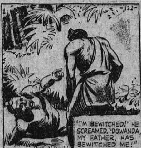
"I'm bewitched!" he screamed. "Dowanda, my father, has bewitched me!"