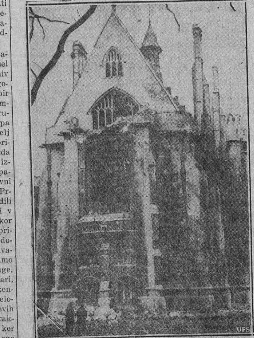
Med drugimi poslopi v Londonu je bila žrtva nazijskega bombardiranja tudi slavna knjižnica, imenovana "Inner Temple Library". Kakor kaže slika, knjižnica sicer še stoji, vendar pa je bila znatno poškodovana in enako tudi mnogo dragocenih knjig.

PREDSEDNIK GOVORIL OB OTVORITVI KONGRESA