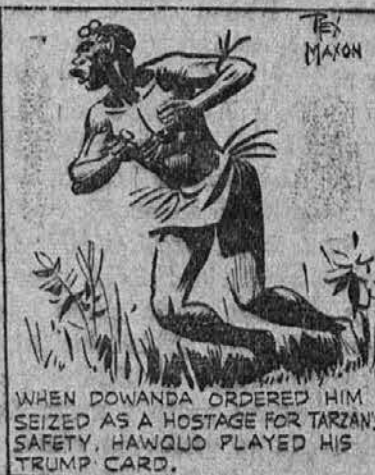
When Dowanda ordered him seized as a hostage for Tarzan's safety, Hawqu played his trump card.