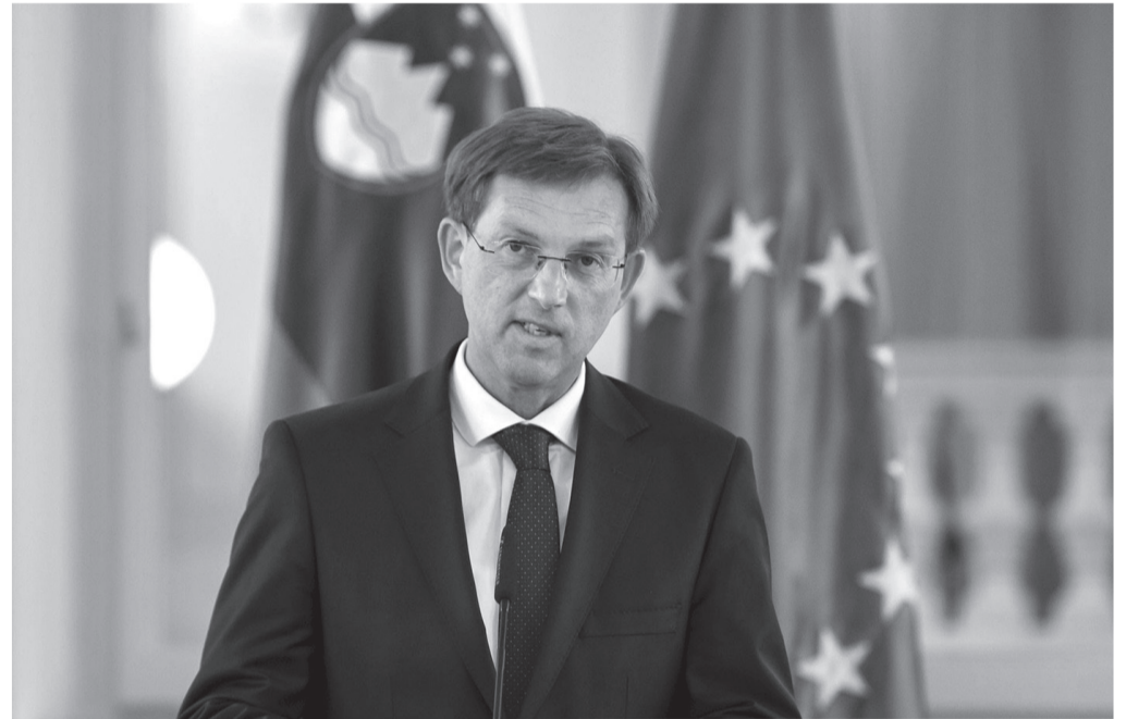
Premier Miro Cerar

Vlada je povečala učinkovitost pobiranja javnih dajatev, storila je tudi marsikaj za preprečevanje sive ekonomije. Prvič od osamosvojitve je bila spre-