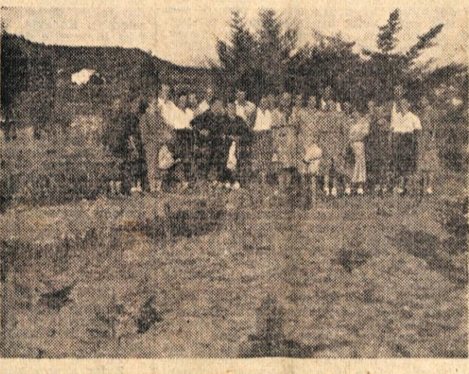
Člani invalidske organizacije iz Novega mesta so 10. avgusta obiskali grobove internirancev na Rabu

S naravo k novemu človeku! Družina gorjanskih tabornikov v Novem mestu