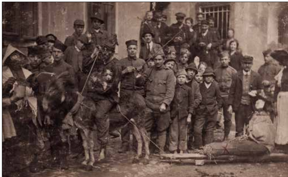
Spomin iz Jesenic.