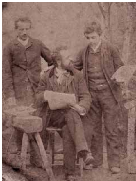
Fotografija posneta ob poslikavi zastora v cerkvi Sv. Antona v Železnikih.