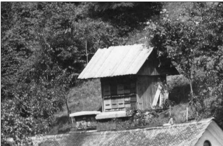
Čebeljak za nekdanjim obratom Tehtnice.

desetih se je lotil izdelave kopije žage venecianke, gnane z elektromotorjem. Po navedbah sina Janka se je pogosto odpravil do Zgage in v Zgornjo Smolevo, kjer sta bili takrat še nespremenjeni originalni žagi te vrste. Maketa žage še sedaj domuje v muzeju. Po otvoritvi muzeja je med drugim sodeloval pri snemanju dokumentarnega filma od Suhe do Sorice, kjer je RTV med drugim posnela del muzeja, dele Železnikov s plavžem ter klekljanje. Aktivno je sodeloval tako pri vodenju po muzeju kot tudi z g. Žumrom pri širjenju, vodenju, pripravi