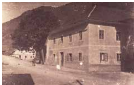
Domača hiša pred prenovo in po prenovi leta 1928.

Njegova duhovitost se je pokazala mnogo let kasneje ob prenovi hiše leta 2004, ko se je odprla hišna kapelica, ki je bila ob obnovi v začetku leta 1928 zazidana. V notranjost je zazidal mapo, ki je vsebovala nekaj njegovih fotografij, in sicer fotografijo stare hiše, notranjosti hiše, svojo fotografijo in fotografijo svoje bodoče žene. Priložen je bil aktualni izvod časopisa Slovenec, srečke Jugoslovanske loterije in kratak rokopis takratnega dogajanja. Napovedal je skorajšnje poroko, z gospodarskega področja pa navaja ponovno pogajanje gospodarske komisije za gradnjo železniške proge v Selško dolino.