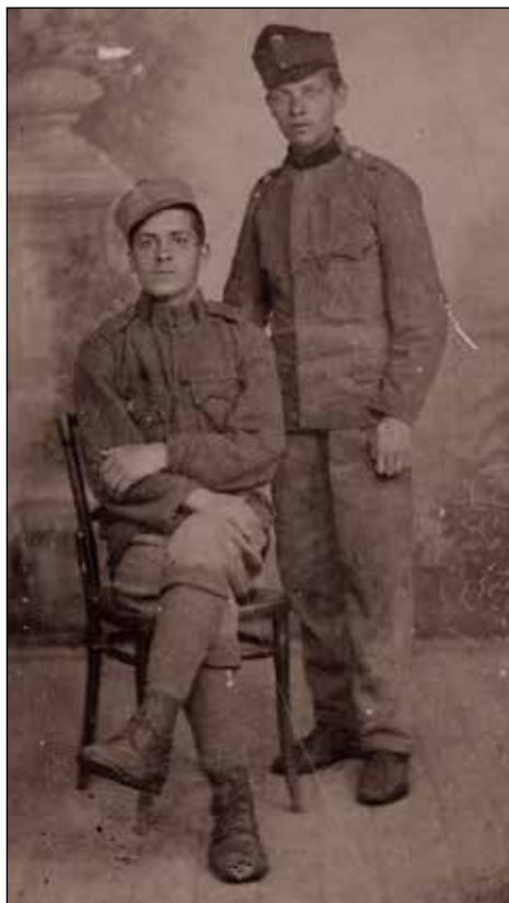
Slika iz Dunaja 1918.

Izkušnje, ki jih je pridobil v Ljubljani, in znanje nemškega jezika, ki ga je pridobil v vojnih letih, so ga pogosto vodila v Ljubljano ali Celovec, kjer je nabavljala material in sledil trendom v čevljarstvu, kar je s pridom uporabljal v svoji delavnici, ki jo je stalno nadgrajeval. Delavnost in gospodarnost sta mu omogočila uresničevati tudi njegove skrite želje, med njimi je bila v tistem času med prvimi fotografija.