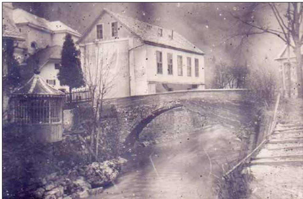
Most na Klovžah.

sneta po katastrofalnih poplavih leta 1926 na Klovžah, kjer se na mostu vidi sanacijo podobnih poškodb, kot jih je ta utrpel leta 2007.