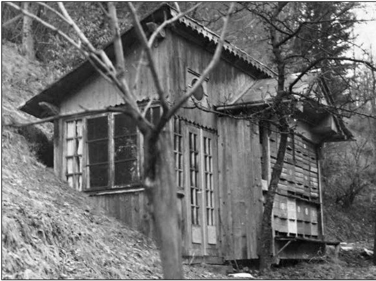
Čebeljak v bregu za domačo hišo.