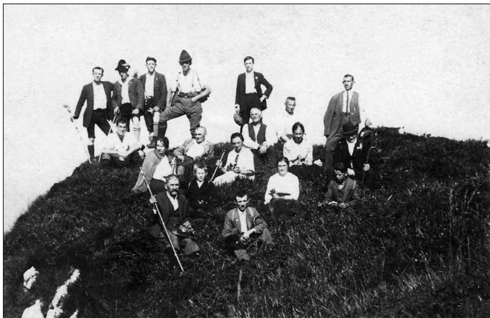
Fotografija prijateljev ob otvoritvi koč na Ratitovcu.

Njegov prvi fotoaparata je bila Kodakova kamera Obscura. Iz tega obdobja je ohranjenih nekaj fotografskih stekel in fotografij. Fotografija, ki je bila po-