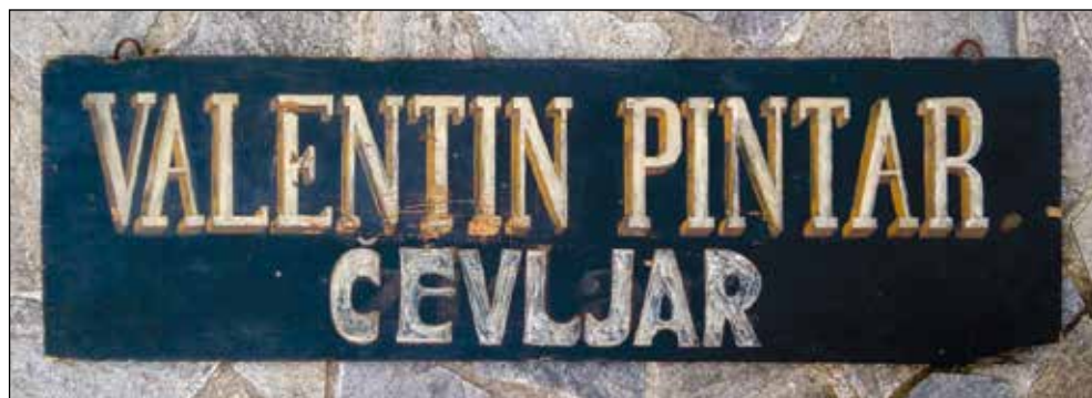
Reklamna tabla z napisom dejavnosti.