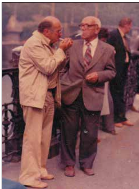
Strastni kadilec v Pragi.

večjih skupin v sodelovanju s Toniko Ramovš skrbel tudi za njeno nadomeščanje pri dežurstvu v muzeju.