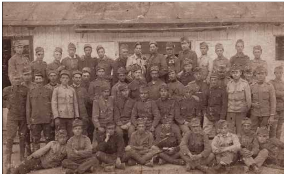
Kozaški polk I. 1917 v Thalerhofu.