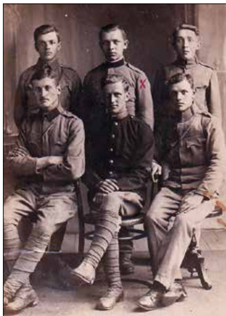
Tinka s sotrpini v Judenburgu.

gu, kaj se je v tistih dveh letih z njim dogajalo, pa se lahko sklepa le po razglednicah in fotografijah, ki so se ohranile. O tem obdobju tudi ni govoril.