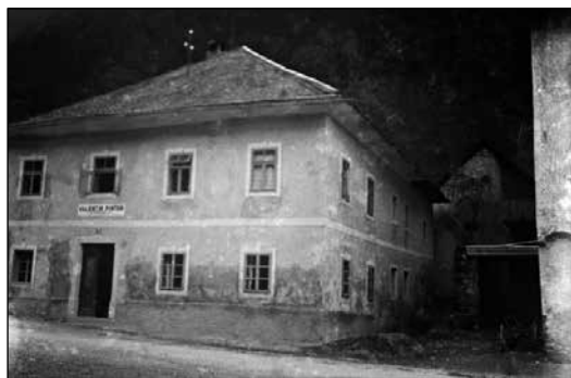
Med bodočim muzejem in domačo hišo ga je ločila le gasa.