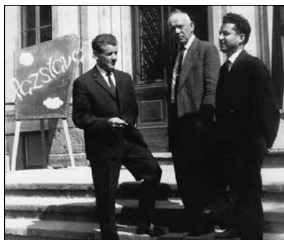
Na čipkarski razstavi v Idriji leta 1968.