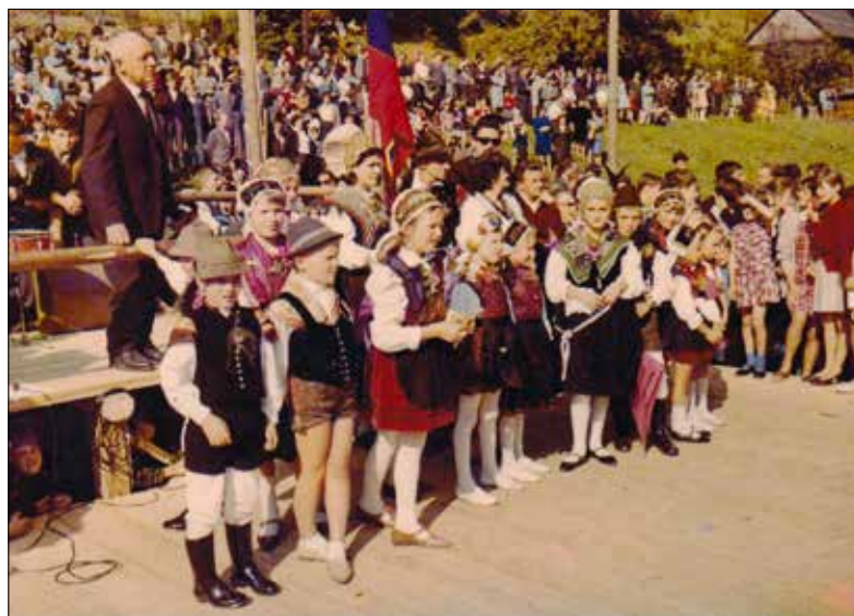
Kot predsednik Turističnega društva in govornik na 2. Čipkarskih dnevih.