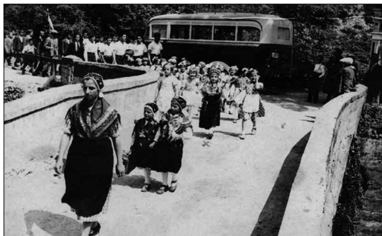
Povorka prosvetnega društva I. 1938 na Klovžah.