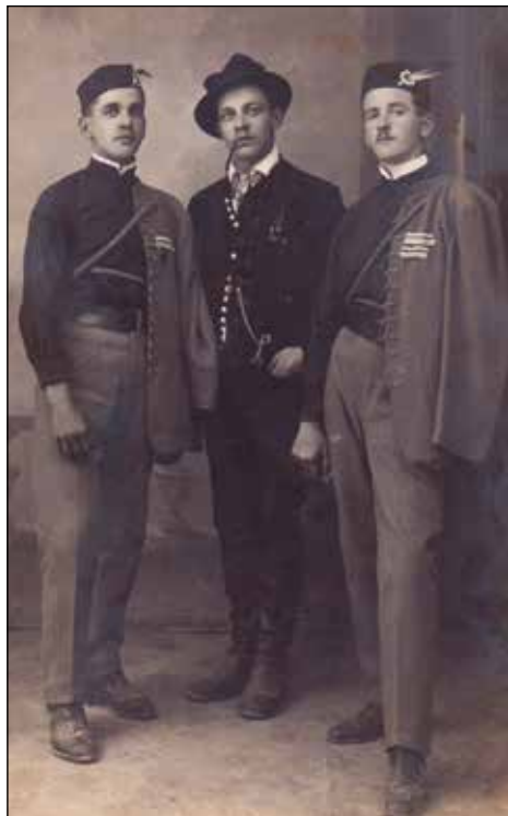
Gostovanje v Škofji Loki.