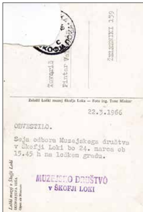
Vabilo na sejo iz leta 1966.

V tretjem življenjskem obdobju mu je močno opešal vid. Ljubezen do naše dediščine, druženje in entuziazem so ga gnali v številne aktivnosti pri Muzejskem in Turističnem društvu. Sredi sedem-