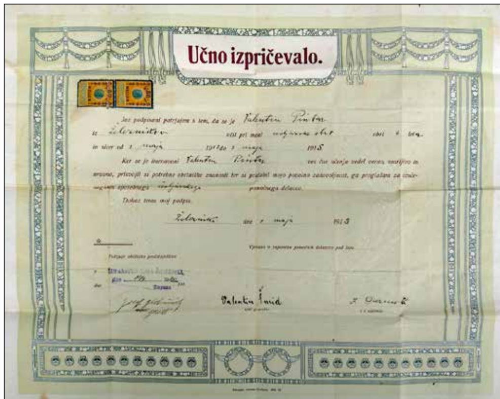
Valentinovo učno spričevalo.

Šolska leta je nastopil v takratni dvorazredni ljudski šoli v Železnikih v šolskem letu 1904/1905.