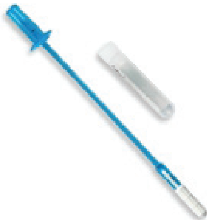
Slika 3. Tester Qvintip za samoodvzem brisa za test HPV doma.

Ženskam iz intervencijskih skupin pilotne raziskave in RNR smo skupaj poslali okoli 12.000 kompletov za samoodvzem. Ženske so po pošti vrnile okoli 5.200 samoodvzetih vzorcev. Ženske so vrnile samoodvzete vzorce v že naslovljeni ovojnici s plačano poštnino v Citološki laboratorij OIL, kjer so sproti analizirali vzorce po metodi Hybrid Capture 2 (hc2). Vsem ženskam, ki so opravile test HPV doma, smo na dom poslali standardizirano obvestilo o izvidu. Priložili smo anketo, v kateri smo ženske zaprosili, da ocenijo izkušnjo s testom HPV doma. Vsem ženskam s pozitivnim izvidom testa HPV doma smo hkrati z obvestilom poslali tudi informativno zloženko Pozitiven izvid testa HPV doma ter datum in uro ginekološkega pregleda v UKC Maribor ali SB Celje, ki smo jih skupaj s sodelujočima raziskovalnima ustanovama določili mi. Ginekološke preglede je opravilo približno 370 žensk s pozitivnim izvidom testa HPV doma. V skladu s protokolom je ginekolog odvezel bris za test PAP, test p16/Ki-67 in test HPV, opravil kolposkopijo ter po potrebi odvezel tkivo za histopatološko preiskavo. Ženske so pred pregledom podpisale privolitvev po pojasnilu.