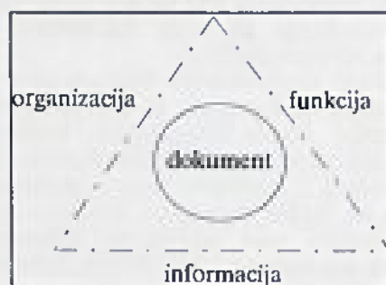
Slika 3: Funkcija kot projekcija dokumentov

S tega vidika arhivske dokumente prenesemo v arhive. Organizacija in funkcija ne obstajata več. S tega vidika bo funkcija projekcija ohranjenih arhivskih dokumentov. Vidik arhivistične funkcije je retrospektiven. V primerjavi s prvim vidikom je precej različen.