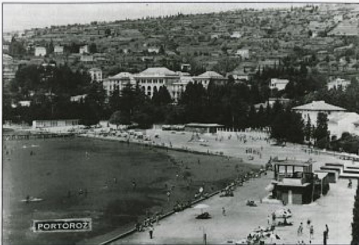
Hotel Palace in plaža v Portorožu razglednica, odposlana 1961

The ultimate goal of the archival function is to preserve and maintain a common memory of the society we are living in as a basis of our identity. In this context old archival concepts are still valid and alive.