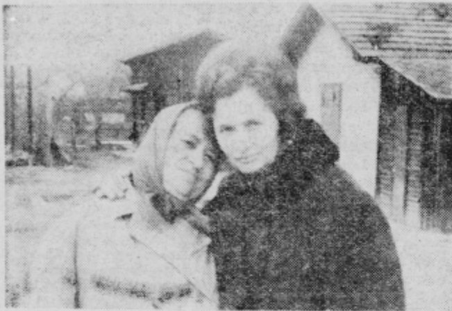
Mati in hčerka spet skupaj