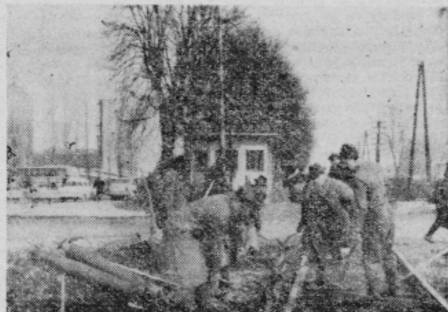
Pri železniškem prelazu v Ptuju so zamenjali odsluženo tračnico. Kdaj bodo pristojni priskrbeli sredstva za ureditev tega prometnega vozla.