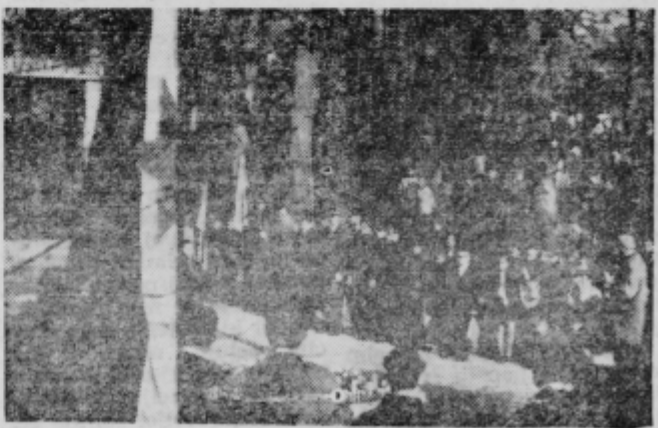
-d Pred spomenikom talcev v Gaju pri Zg. Polskavi