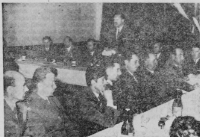
Milničniki postaje milice Ptuj na proslavi 25-letnice službe javne varnosti.

meta je milica vedno bolj angažirana na tem področju.