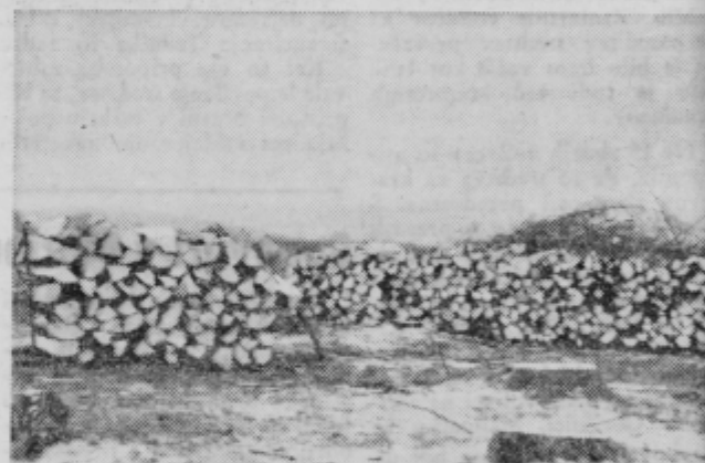
Od prijetnega tibolskega gozda nad Slovensko Bistrico so ostale le še skladovnice.

Tibolski gozd je omenjen že v prvih prospektih Slovenske Bistrice kot prijetna sprehajališčna točka mešanice nov, posebno pa ga bodo pogrešali starejši, ki so ga do-