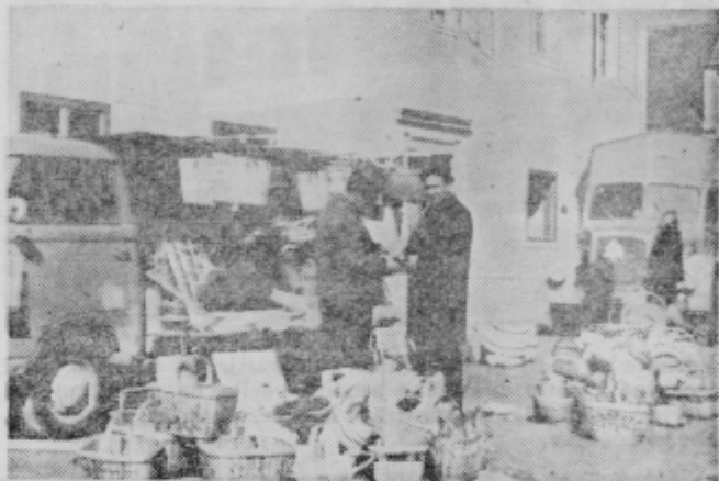
Ribničani so imeli na sejmu v Slovenski Bistrici dovolj kupcev

Pa sem se odločil in poberal tudi enega izmed Ribničanov, kako gre s poslom. In Ribničan bi ne bil Ribničan, če ne bi potarnal in obudil spomin na dobre stare čase, ko je bila njihova roba malce bolj spoštovana. Kljub tar-