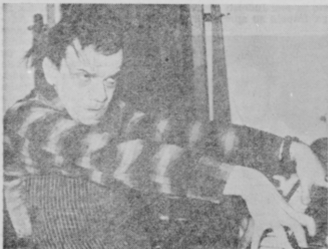
Ježek pri klavirju

vih otrok nima smisla za gledališče in da se eden navdušuje za cirkus. Ker sta dva brata doktorja, sestra profesorica, mislim, da je pri tem mislil mene. Tako sem se pač začel baviti z umetnostjo na-