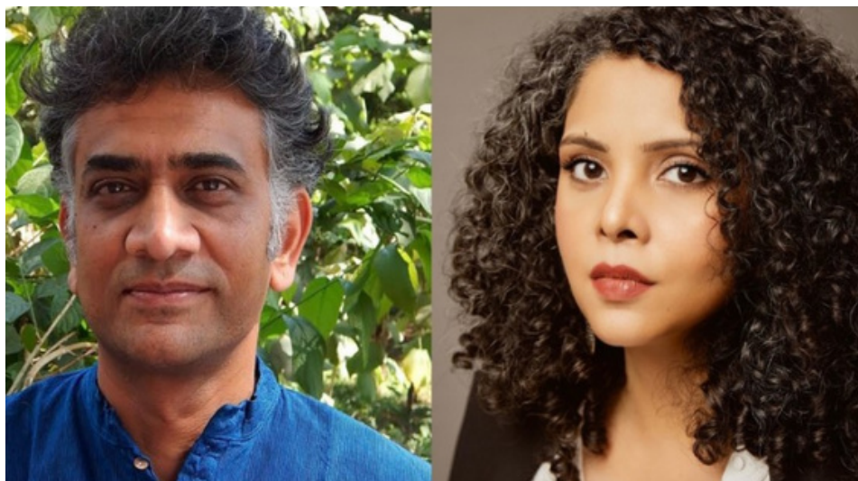
Aakar Patel in Rana Ayyub

Mednarodni PEN je prejel poročila, da so indijske oblasti pisatelju in borcu za človekove pravice Aakarju Patelu skušale samovoljno preprečiti potovanje v ZDA ter s tem kršiti njegovo pravico do svobode izražanja in gibanja. Ta zaskrbljujoči dogodek je najnovejši primer samovoljne uporabe omejitev potovanja proti pisateljem, novinarjem in aktivistom, ki kritizirajo indijsko vlado.