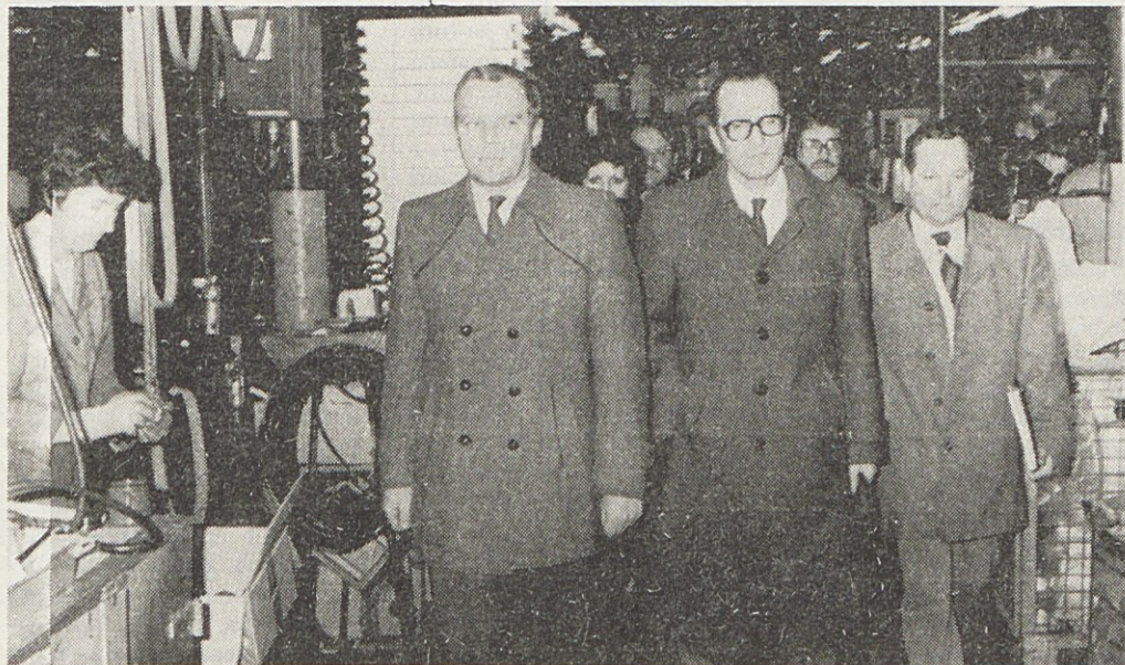
Gorenje je minuli petek obiskal predsednik CK ZKS Andrej Marinc. V spremstvu Hermana Rigelnika si je s sodelavci ogledal več proizvodnih tozdov.