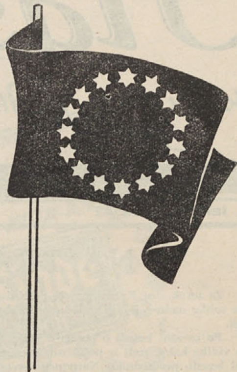
ZASTAVA ZDRUZENE EVROPE

Brezposelnost se je na Koroškem kljub poznemu letnemu času v zadnjem mesecu še zmanjšala. Pričakovati je, da bo tudi v bodoče brezposelnost manjša kakor pa je bila v preteklem letu, ker je bilo mogoče zagotoviti potrebne vsote za nekatera večja javna dela. Tako bodo gradili v prihodnjem letu tri velike kolodvore in sicer južni kolodvor na Dunaju ter kolodvora v Grazu in v Innsbrucku. — Nadaljevali bodo pa še to zimo in nato prihodnje leto z avtomatizacijo telefonskega omrežja na Koroškem in Vzhodnem Tirolskem, nato pa tudi v ostalih deželah. Ta dela omogoča večji kredit, ki ga je dobila vlada v Švici.