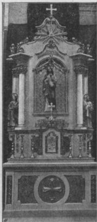
Jezusovoga Szrcá oltár pri Szvetom Szebestjani.

Da je zse tmica nasztánola, cerkev je oznotraj i ozvünaj lepo razszvetlena, pri steroj szvetloszti szmo to proszili od Szrca Jezusovoga, naj nam dá priti vu njegovo szvetloszt. Iz szrca zselemo to vam tüdi lübléni estevci!