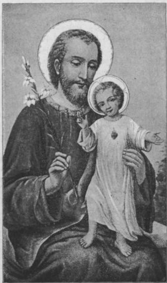
Szv. Jozsef hranitel Jezusov,

v-szrci szv. Jozsefa? Z-gorécsov lübéznosztjov sze je szkrbio za szv. drúzsinu, delao je, trúdo sze je za Goszpodna Jezusa i Marijo. Od angela je prijao recsi: „Jozsef, Davidov szin, ne boj sze k szebi vzéti Marijo szvojo zseno, ar ka je vnjej rojeno, je od szv. Dúha.“ Iz zsive vere je