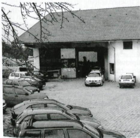
AVTO CERAR, VRBA - danes, kmalu bo tu avtocesta