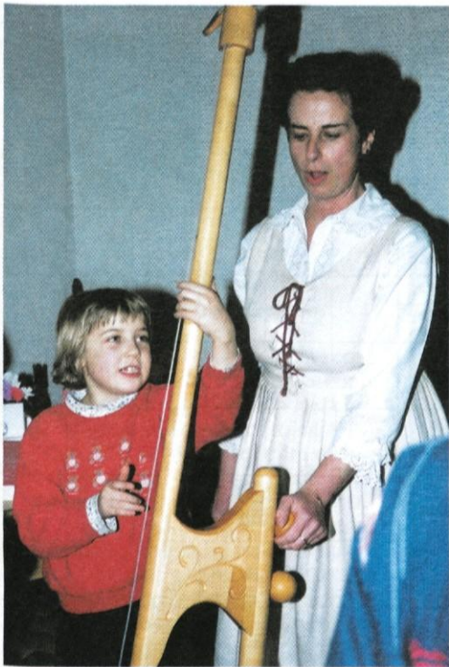
S skupnimi močmi gre kar dobro