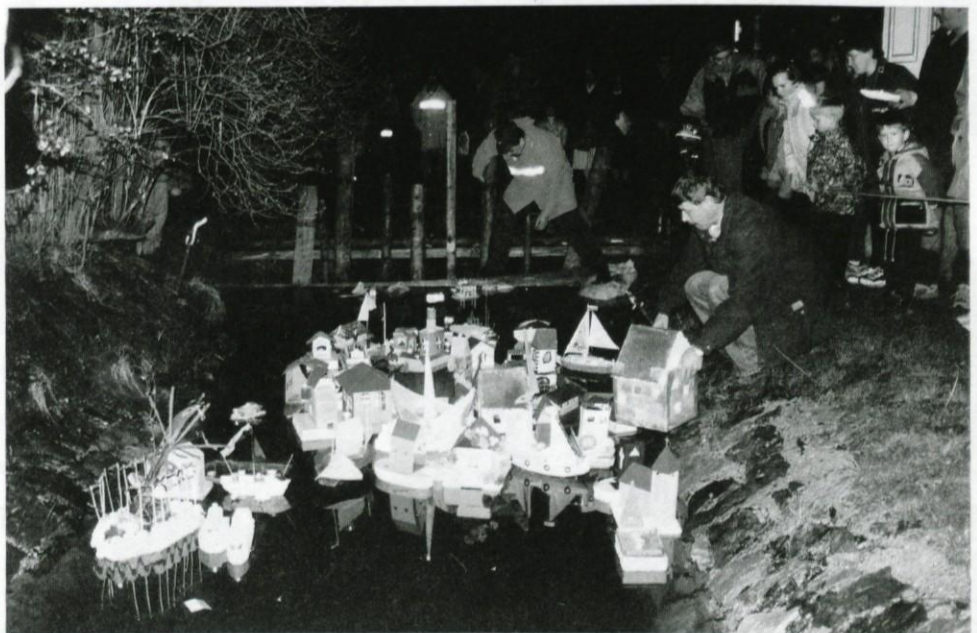
Gregorčki so pristali