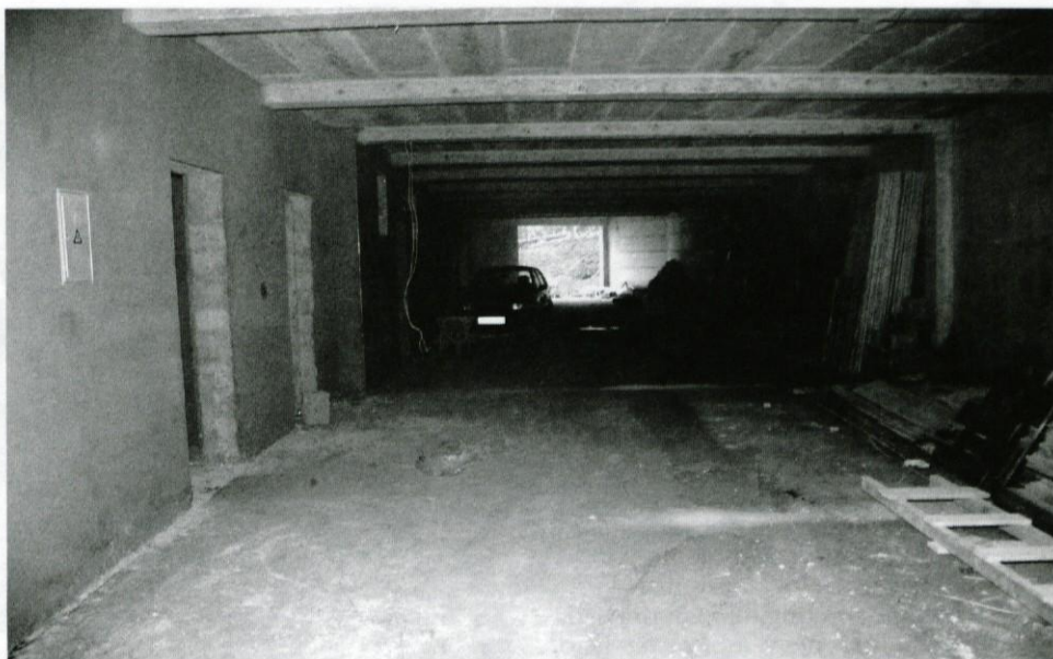
Dovozna pot za Čebelarji center

“Na južnem delu bomo postavili dva vodnjaka”, nadaljuje Bine, “pa tudi deset čebelnjakov, ki pa ne bodo vsi živi. Naj-