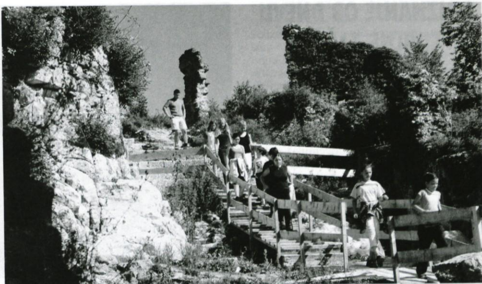
Na gradu Kostel

ZAKAJ SE ODLOČAM ZA ŽIVLJENJE BREZ ALKOHOLA?