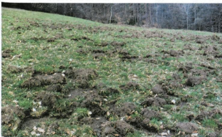
Divji prašiči so »uredili« travnik