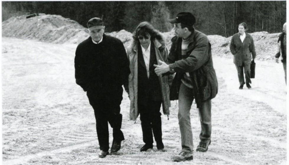
Pogovorov ni nikoli preveč

Prostorska dokumentacija je bila obravnavana tudi na ostalih sejah odbora, na katerih so člani razpravljali o posameznih aktualnih prostorskih področjih, kot so kamnolomi, deponije komunalnih odpadkov, športno-rekreacijske površine, komunalni vodi idr., ter o drugih pomembnejših temah: poslovanje JKP Prodnik, aktivnosti dimnikarske službe, aktivnosti na področju izgradnje vrtca, odkup javnega dobra, povračilo za priklop na vodovodno in kanalizacijsko omrežje, predlog povišanja cene vodarine idr.