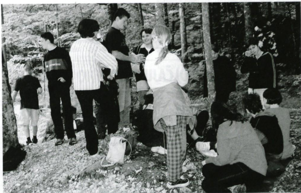
V Kamniški Bistrici