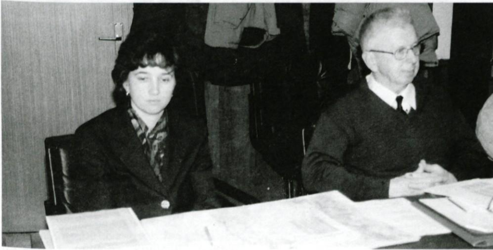
Predstavnika zavoda Naš laz

Pred zaključno fazo izdelave razvojnega programa sta predstavnika zavoda Naš laz prišla na pogovor o željah in možnostih izvedbe načrtovanih razvojnih nalog.