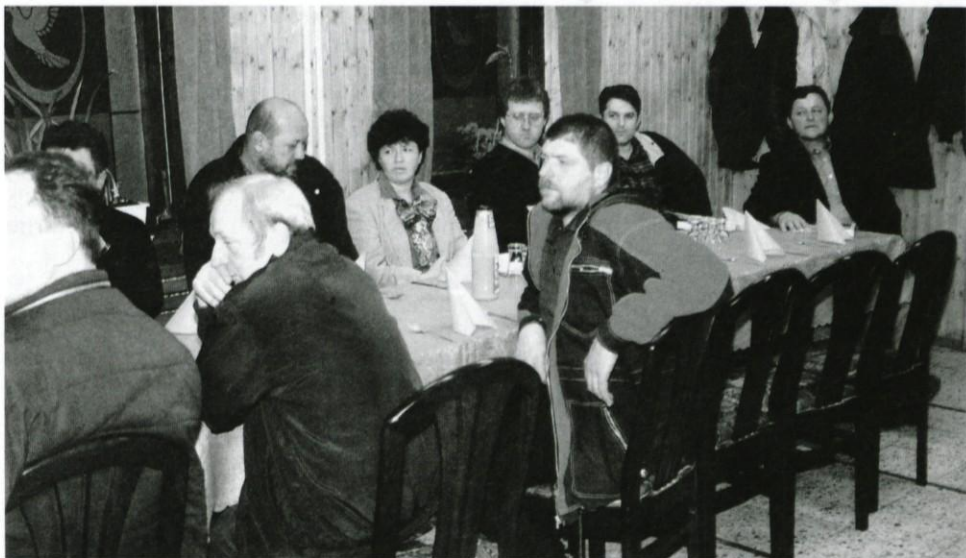
Na občnem zboru

Člani društva so iz Lukovice, Moravč, Domžal, Litije in tudi iz dela kamniške občine. Svoje pridelke bodo prodajali pod blagovno znamko BIO DAR. Pridelava in prirreja take hrane pa seveda ni ravno enostavna, saj mora kmetovalec kar tri leta pripravljati zemljo in naravna gnojila, da zatem lahko kandidira za eko znamko. V Sloveniji je le 700 kmetij, ki se ukvarjajo s tako proizvodnjo. Pravilnik kakovosti je zelo zahteven. Trenutno vrši nadzor Kme-