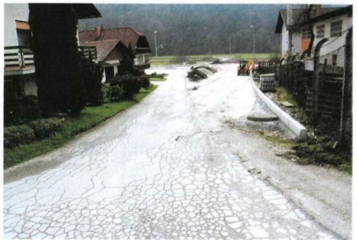
V Krašnji se solidarnost kaže na prav poseben način