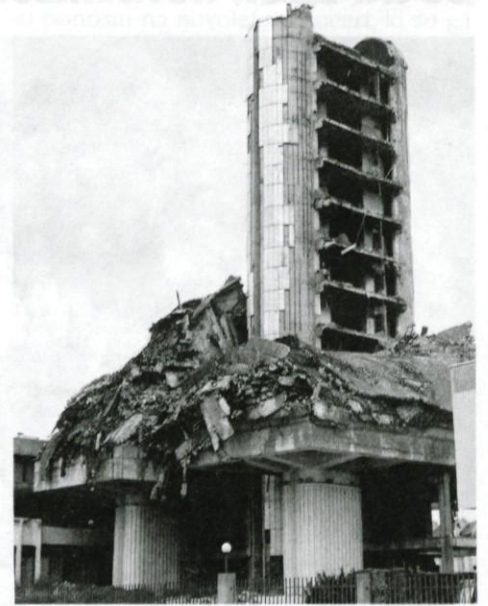
Porušena RTV, tipični prizor v povojnem Sarajevu

Najbolj vnete zgodbe so tiste o podzemnem tunelu, ki je potekal pod sarajevskim letališčem in bil tako edini izhod iz mesta. Letališče je ležalo ravno na meji med obkoljenim mestom in osvobojenim ozemljem, zato je bil prehod preko njega strateško še bolj pomemben. Ker je srbska stran podpisala sporazum z UN (združeni narodi), da letališče lahko služi samo za dostavljanje humanitarne pomoči, je bil prehod Sarajevčanov iz obkoljenega mesta nemogoč. Ker pa je življenje v mestu brez hrane samomorilsko, je veliko prebivalcev poskušalo prečkati letališče, mnogim žal ni uspelo uiti srbskim ostrostrelcem na drugi strani. Zato se je vojska odločila, da zgradijo predor pod letališčem in tako omogočijo komunikacijo z osvobojenim območjem. Tunel je dolg 800 m, povprečne višine 1,5 m in je bil ročno izkopan v petih mesecih. Skozenj so tovorili vojni material,