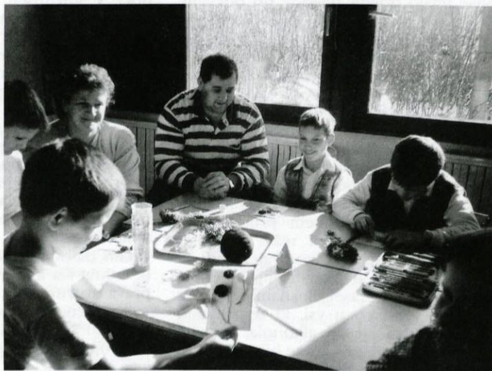
Tri generacije pri delu

pripravili program in tako počastili njihov praznik v marcu. Spet se je pojavila trema in strah pred nastopom. Plahe, a ljubeče besede o mamicah, o njihovi ljubezni in delu, pa otroški ljubezni in sreči so prihajale iz otroških ust. Vse je bilo dano z ljubeznijo, vsaka pesmica posebej, vsaka vejica resja, vsako spominsko darilce, ki so ga učenci izdelali že v prejšnjih dneh. Vse je bilo zanje, ki jih imajo radi in jim pomenijo vse na svetu.