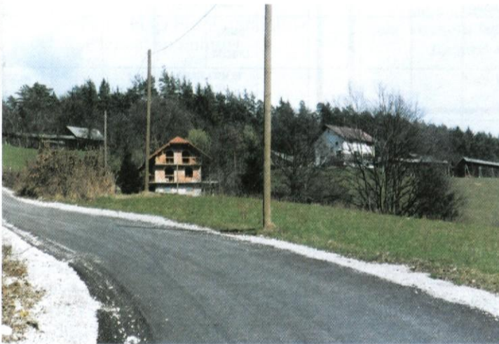
Nova obleka ceste v Brezje