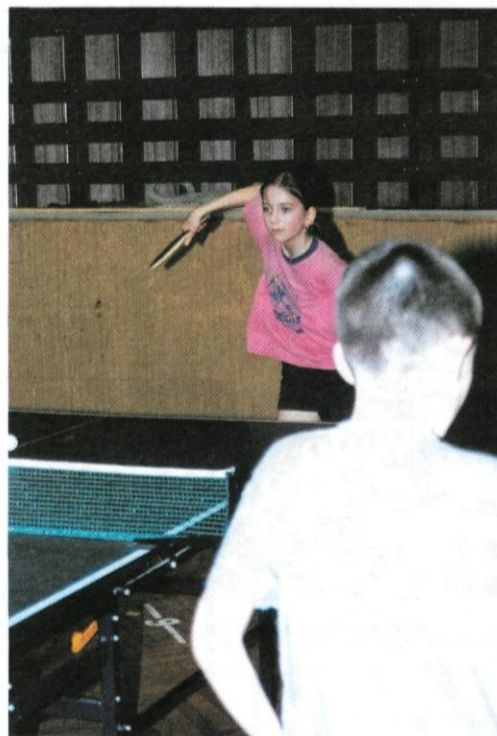
Mladi v Krašnji pridno trenirajo