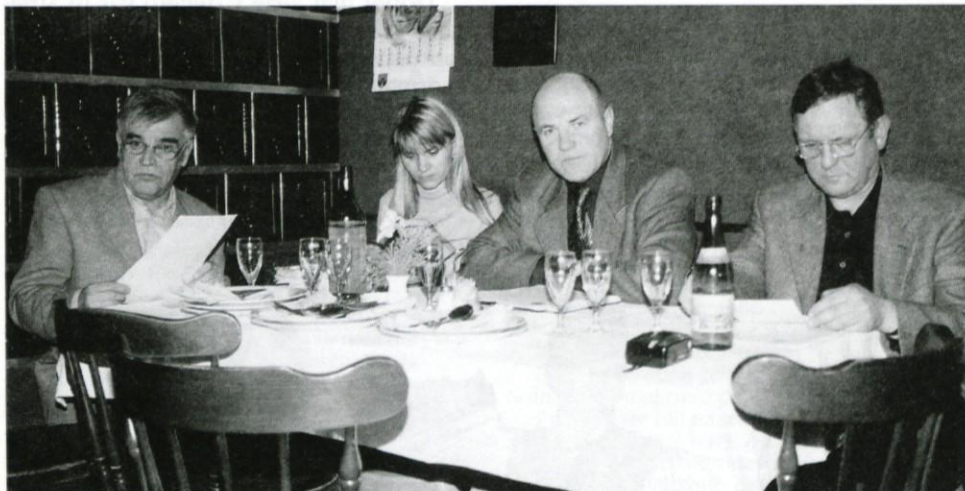
Predsedstvo občnega zbora

V petek, 23. marca, so se godbeniki zbrali na svojem občnem zboru. Ugotovili so, da je za njimi uspešno leto, saj je v njihove vrste stopilo več novih članov. Poleg igranja na vseh večjih občinskih prireditvah so pripravili srečanje pihalnih