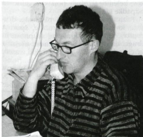
Svetovalec za kmetijstvo