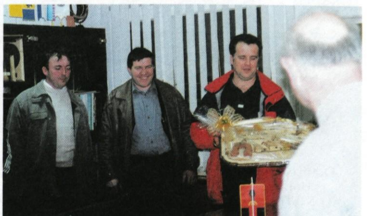
Tudi predsedniki KS so se spomnili županovega jubileja