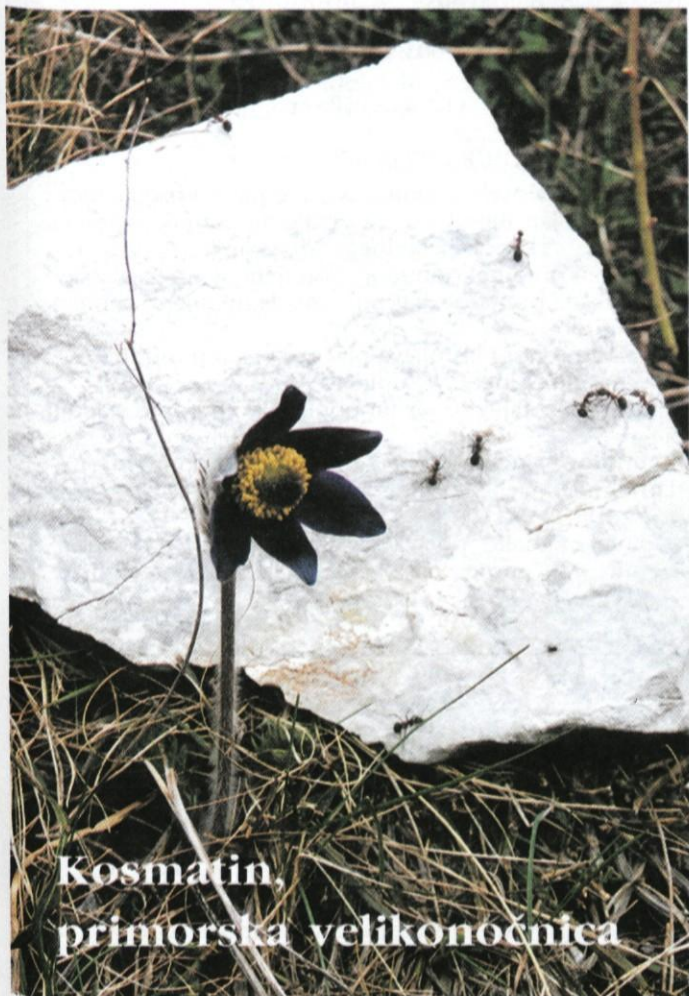
Kosmatin, primorska velikonočnica