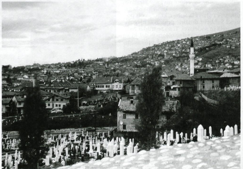
Tipični pogled na mesto, pokopališča