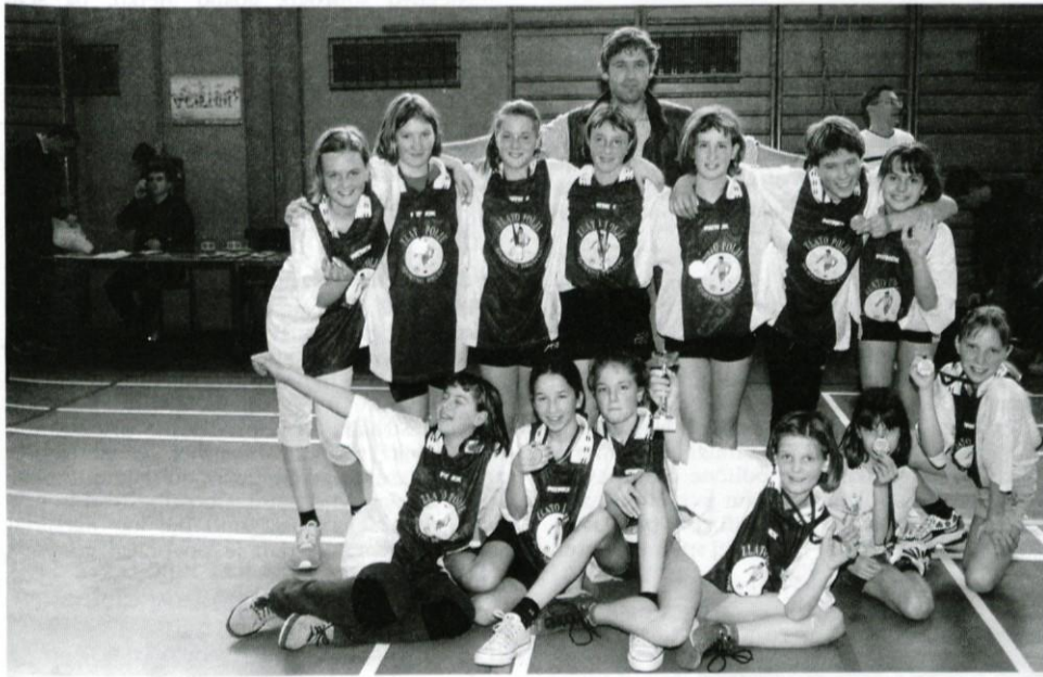
Po osvojenem 1. mestu v Domžalah

Šolska košarkarska liga ima vse več privržencev. Tudi na Osnovni šoli Janko Kersnik na Brdu vse več mladih igra ko-