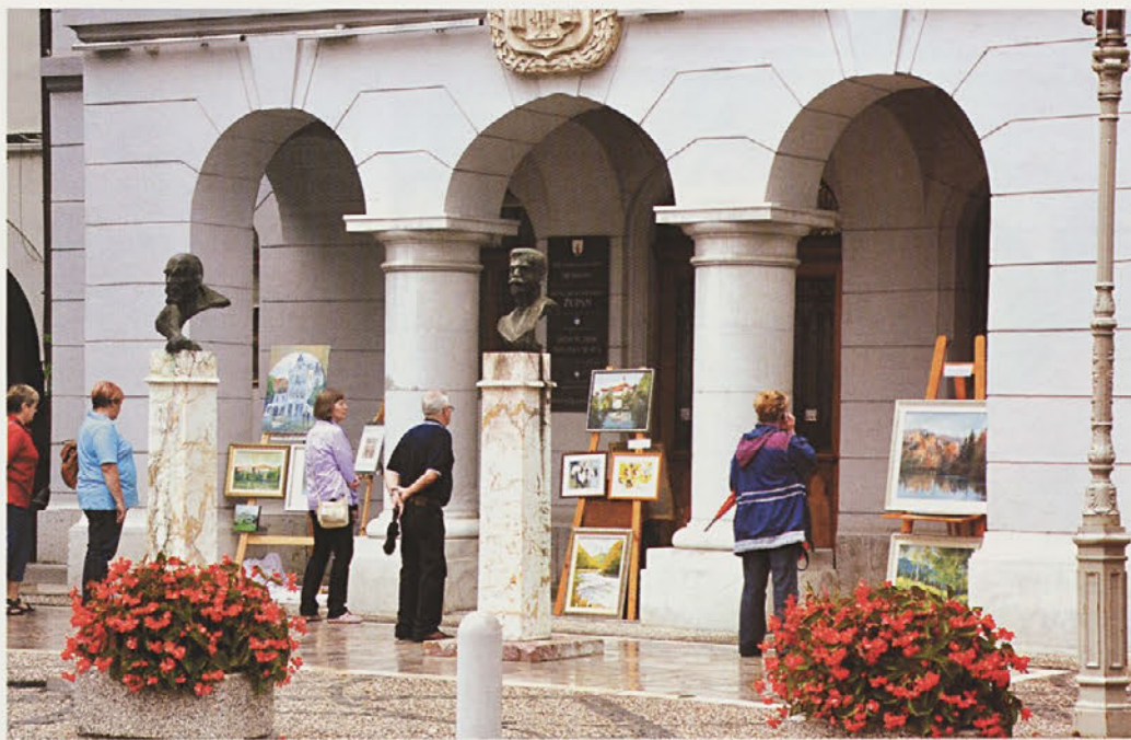
Takole so se umetniki predstavili občinstvu konec avgusta

V od boga in občine zapuščeno spomeniško poslopje, ki je kazalo samo še rebra in razbite šipe, so se vselili mladi alternativci, ki slikajo in improvizirajo na ves glas. Za varnost pa bo vseeno morala poskrbeti občinska oblast, ki si je do zdaj samo ušesa zatiskala.