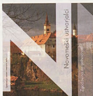
Novomeški ustvarjalci - zgodovina za prihodnost

Tema, ki se v vsem tem času ni premaknila z mrtve točke oziroma je celo nazadovala, je prav gotovo urejenost mesta in njegova podoba. Prizadevanja Društva Novo mesto od pogovornih večerov (urejenost