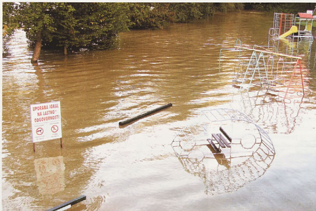
UPORABA IGRAL NA LASTNO ODGOVORNOST! Ob zadnji poplavi je tudi Krka spet pokazala zobe: v parku Evropske skupnosti na Seidlovem travniku v Novem mestu je do kolen zalila otroško igrišče. Sicer tukaj ni naredila posebne škode, s čolnom se pa tudi ni nihče priplul igrat