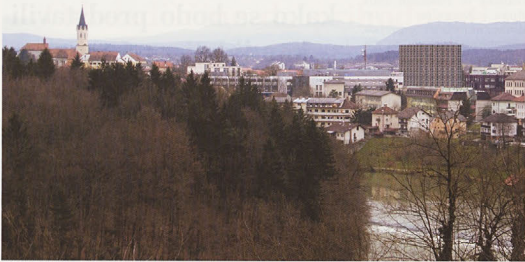
Takole bi bila videti panorama mesta z nebotičnikom s severa (fotomontaža)