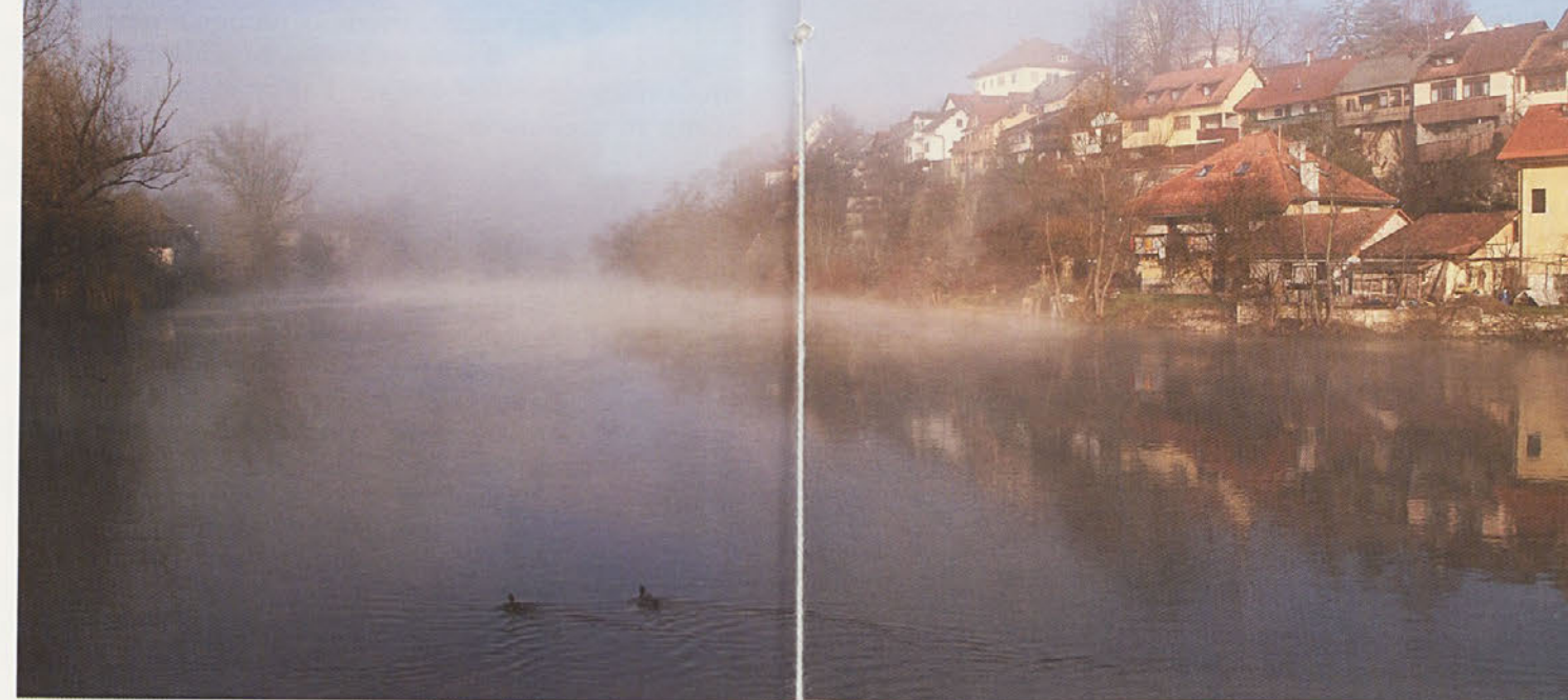
NAD MESTOM SE DANI ... Megla se dviga in napoveduje lep sončen dan. Bo po letošnjih volitvah svetnikov in župana tudi novomeško štiriletje tako vedro?

Evropska komisija je zaradi slabe kakovosti zraka v naših mestih pred kratkim vložila tožbo proti Sloveniji. Evropska strategija namreč govori o trajnostnih mestih, kar po eni strani pomeni zmanjšanje prometa in izpušnih plinov v urbaniziranih območjih, po drugi strani pa uporabo zelene energije in povečanje zelenih površin v mestnih okoljih. Torej je eden od glavnih vzrokov za onesnažen zrak v naših mestih slabo vodena