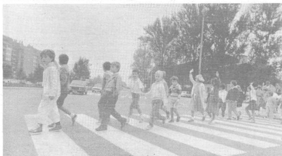
Hura, šola se je pričela, z njo pa skrbi in radosti tudi za te mlade Trnovčane.

Izid brošure je omogočila delovna organizacija Beogradska banka, ki bo 12. septembra imela tudi obrambni dan in se bo priključila našemu srečanju. Poudariti velja,