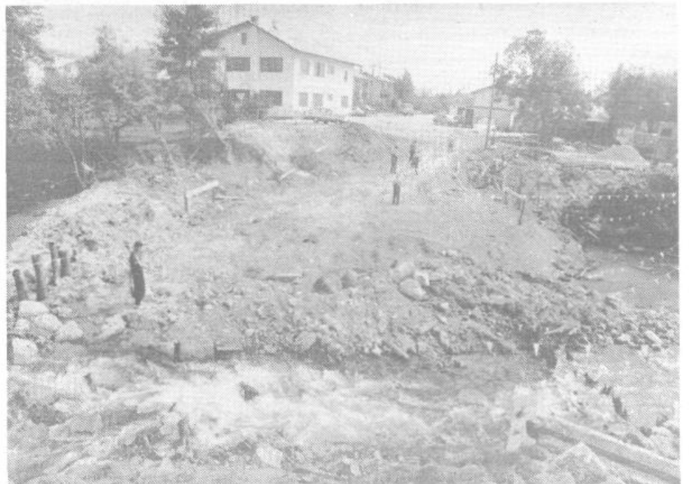
Tole pa je pogled na gradbišče novega »kozarskega« mostu. Staro se je vendarle umaknilo novemu.

V tej številki našega glasila Samoupravna stanovalska skupnost občine Ljubljana Vič-Rudnik odnosno njen Odbor za solidarnost objavlja OSNUVTEK PREDNOSTNE LISTE ZA PRIDOBITEV DRUŽBENEGA STANOVANJA, NAD KATERIM JE STANODAJALEC SSS OBČINE LJUBLJANA VIČ-RUDNIK, PO PRVEM NATEČAJU, KI JE BIL OBJAVLJEN DNE 11. 11. 1986 v glasilu Naša komuna.