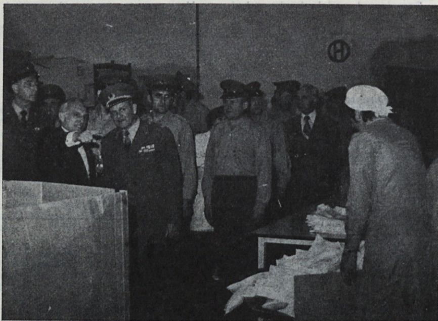
Predstavniki JNA so si z zanimanjem ogledovali proizvodnjo sanitetnih izdelkov