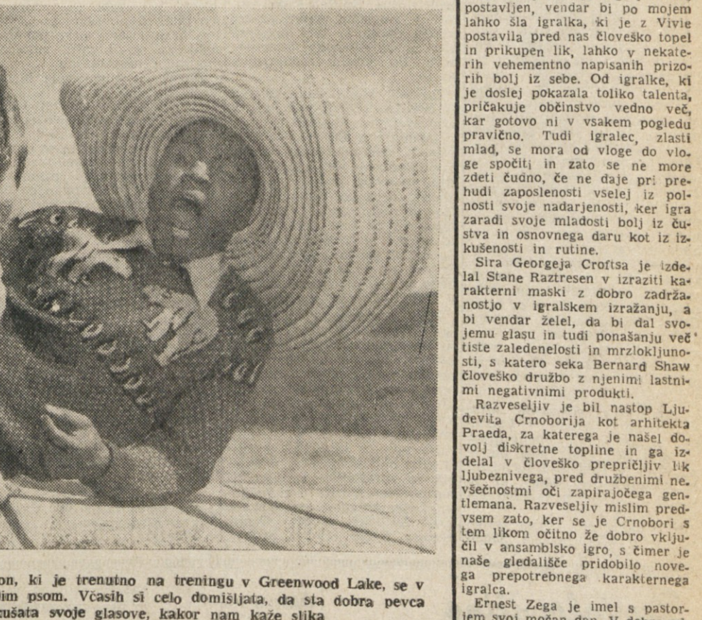
Ameriški boksar Johnny Bratton, ki je trenutno na treningu v Greenwood Lake, se v prostem času rad zabava s svojim psom. Včasih si celo domisljata, da sta dobra pevca in v duetu preizkusita svoje glasove, kakor nam kaže slika