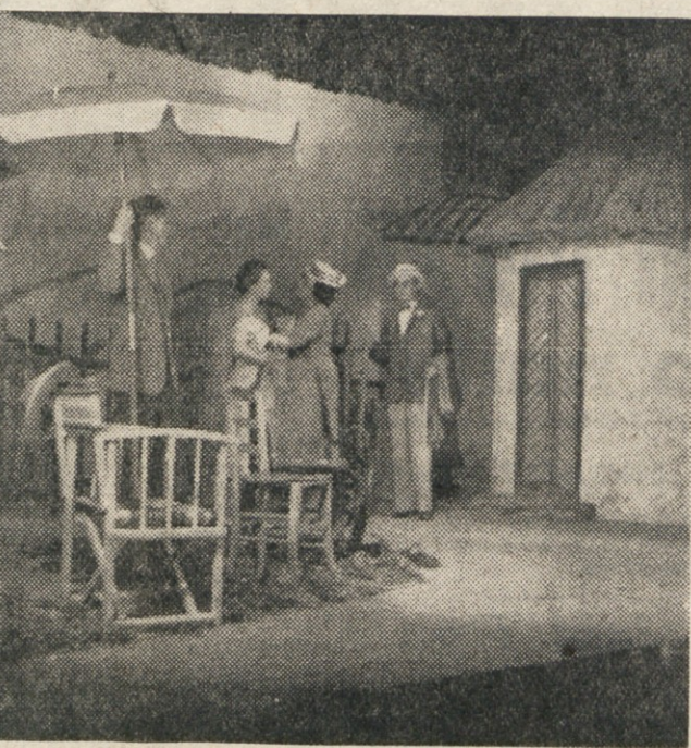
Prizor s premiere