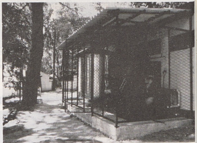
Sistem segrevanja sanitarne vode toplotne moči 15 KW je vgrajen v bungalovu Riviere Poreč

Zanimiv je visok porast popraševanja in s tem prodaje izdelkov elektronike široke potrošnje, saj so lani v novembru in decembru poslovali brez zalog. Prodajo teh izdelkov je prav tako spremljalo nihanje popraševanja, ki so ga s prodajnimi akcijami učinkovito obvladovali. Vse kaže, da so k tako povečanemu popraševanju po Gorenjevih te-