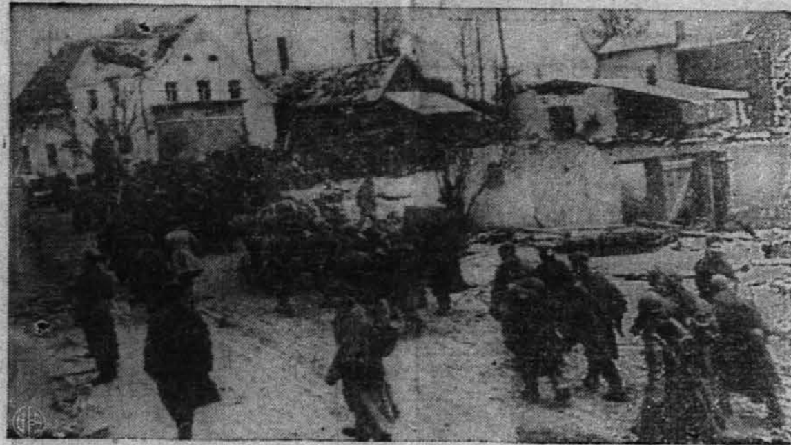
Po globokem snegu gazijo, nad njimi pa se razprostira temno nebo, ko Amerikanci korakajo skozi razdejano belgijsko mesto St. Viht, ki so ga zavzeli. Malo prej so težki sneženi viharji in zamele vihrali po celi zapadni fronti. To je bilo pred nekaj tedni. Sedaj pa je tam samo blato.