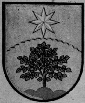
REČICA OB SAVINJI