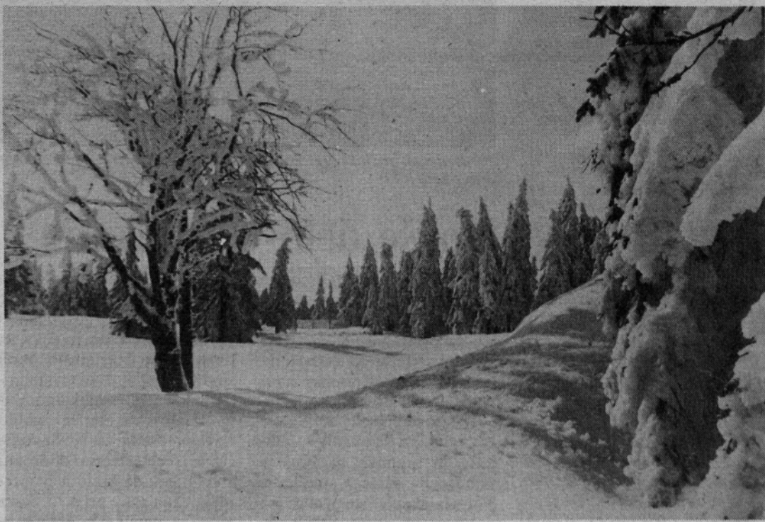
Lepe zime

Stanovanjska skupnost: Šaponič Drago, Marjanovič Nikolaj.