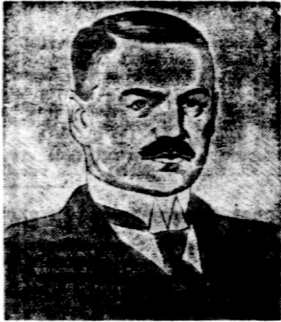
Novi češkoslovaški ministrski predsednik JAN ČERNÝ.

Danes je bil otvorjen VII. pomladanski velesojem, ki je kljub gospodarski krizi dosegel že prvi dan zelo lepe uspehe. Število posetnikov je znašalo v nedeljo 65.000. Prvi dan je bil bolj informativnega značaja, vendar so se pa sklepale manjše kupčije, osobito v stekleni industriji, keramiki in motornih kolesih. Velesojemski urad je priredil kot atrakcijo prvega dne stafeto po Pragi, ki je zbudila splošno zanimanje. Poleg tega se je priredila dne otvoritve v velikem gledališču »Variete« modno revijo pod devizo »Venera in modna dama«. Gledališče je bilo že teden dni poprej popolnoma razprodano. Revija se ponovi 28. marca.