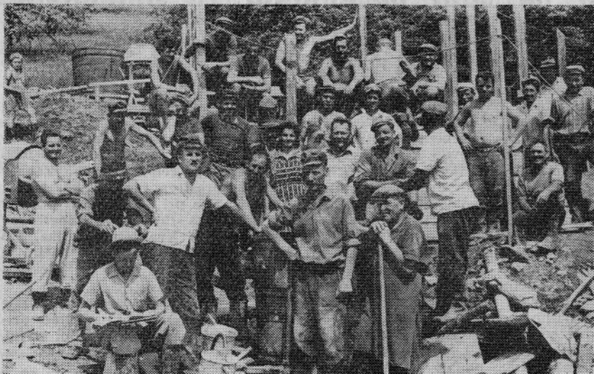
PO TEŽKEM DELU SO SE ODDAHNILI IN NAPRAVILI SE TA POSNETEK

Težja naloga je bila najti zadostno količino vode, ki bi odgovarjala vsem sa-