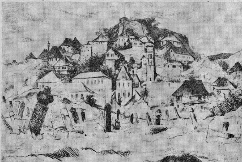
BOZIDAR JAKAC: JAJCE, 1946 (JEDKANICA)

Ko slavimo rojstni dan naše republike, dan naše socialistične revolucije, smo dolžni v tem trenutku povedati, da v temeljih naših dosežkov in stvaritev ležijo revolucionarne, socialistične, demokratične in humane ideje, ki so vodile udeležence II. zasedanja AVNOJ v Jajcu in navdihovale stotisoče borcev, ki so prijeli za orožje in šli v boj za življenje in smrt pod zastavo narodne osvoboditve, socializma in demokracije.