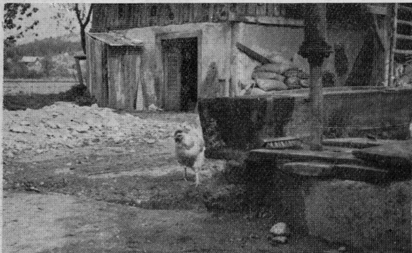
NEPRIMERNA LOKACIJA V BLIŽINI STRANIŠČA. POSLEDICA: VEČ OBOLJENJ ZA TIFUSOM

Dolžnost organov pa je, da nadzirajo gradnjo in v nasprotnem primeru tudi ukrepajo po veljavnih predpisih.