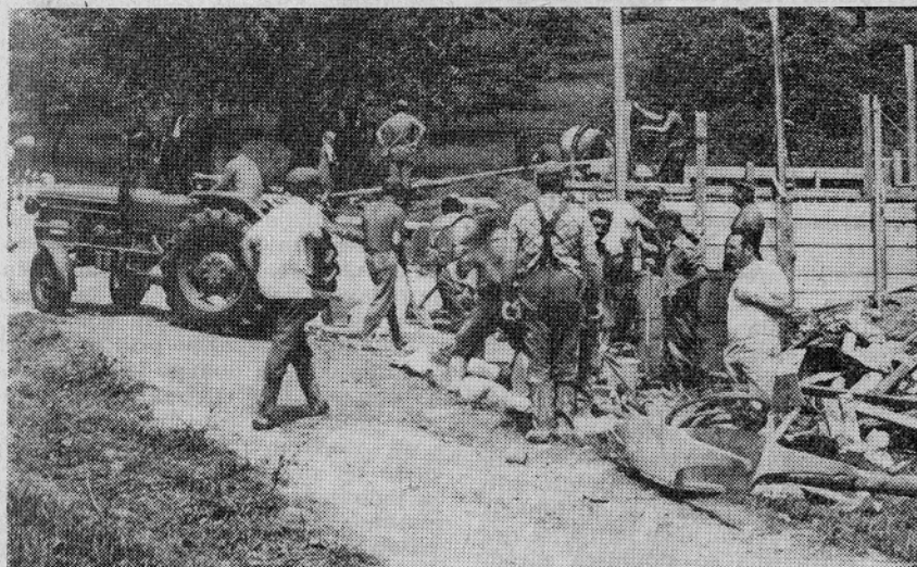
KO SO POPRIJELI VSI, SO V PIČLIH OSMIH URAH ZABETONIRALI 70 M 3 VELIKI REZERVOAR ZA VODOVOD V SEDRAŽU

nitarnim in drugim zdravstvenim predpisom. V Sedražu in njegovi neposredni bližini namreč takih izvirov ni, če pa so že, pa zaradi jamskih del rudnika niso sigurni. Zato so bili Sedražani prisiljeni zajeti vodo pod vasjo Turje v hrastniški občini, čeprav je to gradnjo znatno podražilo. Namreč samo glavni vod je ob takšni rešitvi dolg več kot 2 km. Stroške pa povečuje še neugodna višinska lega zajetja.