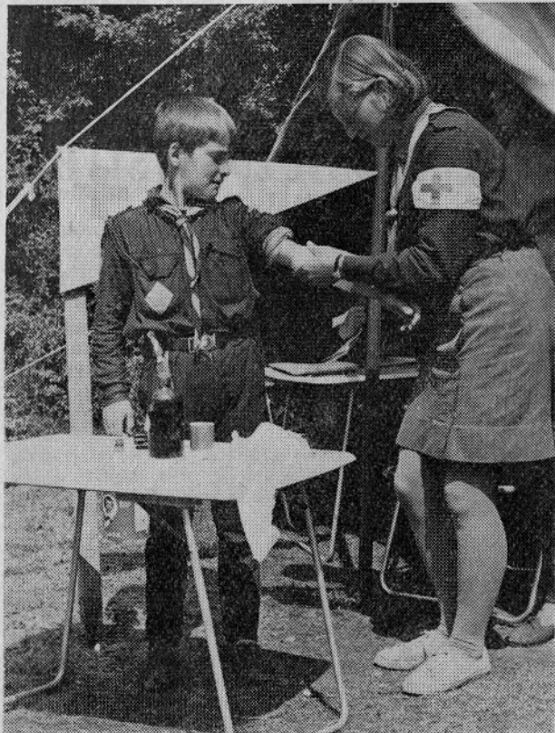
NA PREVIJANJU V IMPROVIZIRANI AMBULANTI NA TERENU

Enote civilne zaščite ustanovijo delovne in druge organizacije ter krajevne skupnosti. Če tako določa predpis, se enote civilne zaščite ustanovijo tudi v večjih naseljih v okviru krajevnih skupnosti in v stanovanjskih hišah.