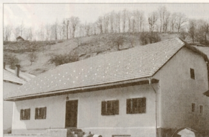
Prave kmečke dobrote bodo pri Golobovih ponujali v kmečki hiši.

prostor za goste, ki se včasih ustavijo pri nas. Potem se je vse obrnilo čisto v drugo smer.