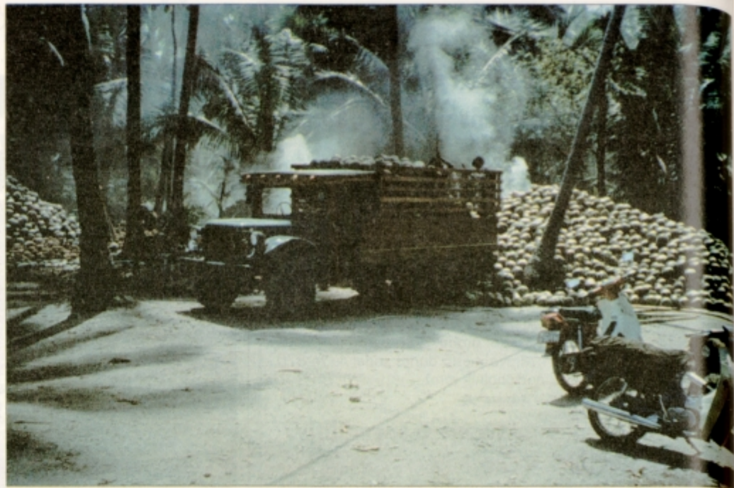
Kokosovi orehi so temelj gospodarstva na otoku Koh Samui

Tajska je danes prijetna in varna dežela, zaradi cenenosti dostopna tudi našim ljudem. Največje zagotovilo varnosti je tajski človek, ki je vedno nasmijan, dobrovoljen in miroljuben. Večina Tajcev še danes živi v vaseh, kjer v svojih ličnih hišicah na kolih živijo umirjeno življenje, ne glede na menjavo oblasti v Bangkoku. Notranjo trdnost mu daje miroljubni budizem, kjer pa ta zaradi odmaknjenosti in vzvišenosti odpove, se zateče po bolj praktično duševno pomoč k domačim duhovom in zaščitnikom. Tajec ostane dostojanstven in umirjen tudi v najbolj nemo-