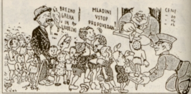
Karikatura iz 'Poglejmo se' karikaturlista Štefana Jerka Čiča iz leta 1939

ski predpisi. Posebej so opredeljena določila za stalne kinematografe in za potujoča podjetja. Stalni kinematograf je moral imeti dovolj izhodov, prostor za gledalce, garderobe, čakalnice in stranišča. Natančno so določeni predpisi glede sedežev, stojišč, ogrevanja, ventilacije, ognjevarne konstrukcije, zagotovljena je morala biti celo zdravniška pomoč. Zelo natančni so bili predpisi o požarni varnosti (javljalec požara, sredstva za gašenje, prepreči kajenja). Predpisano je bilo, kakšen mora biti prostor za aparature in kakšna električna napeljava. Če so bile kinematografske predstave v gledališčih,