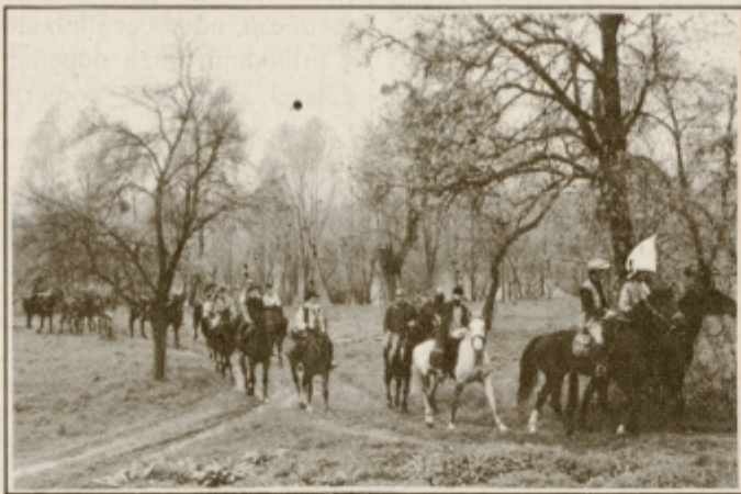
Konjeniki med pohodom.

Za varnost med 150 km dolgo potjo je skrbela konjeniška enota UNZ. Med potjo so jih pogostili župani nekaterih občin z območja Prlekije, v Ljutomeru je bil opravljen blagoslov konjev in jezdec. Predsednik konjenice Branko Brumen je ob koncu povedal, da so veseli, da se je