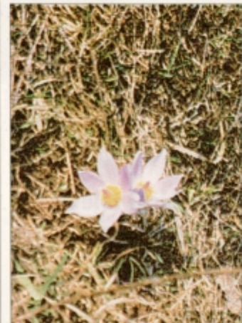
Na ograjenem rastišču cveti velikonočnica.

Kot končno pririneš na vrh, se ti odpre lep pogled. Levo po cesti vodi pot do dobro oskrbovane planinskega doma, desno pa proti rastišču velikonočnice. Že od daleč te pozdravlja tabla z napisom, da je tod z odlokom