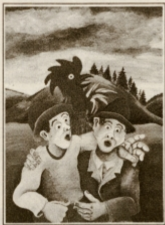
Janez Repnik: Pevci (olja na platnu, 1993)

pa jih ulovi in ustavi, da jih lahko za vedno ponese v čas.