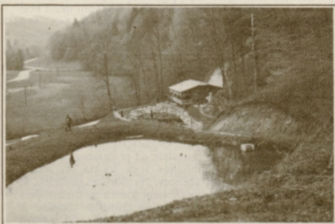
Dva ribnika in prijetna brunarica v Zgornji Sveči

DESTRNIK / DENAR OD MAJSKE PRIREDITVE SO NAMENILI ZA ŠOLSKI PRIZIDEK