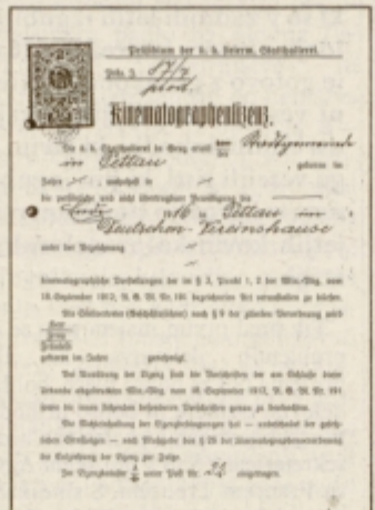
Prva stran licenčne knjižice za delovanje kinematografa v Ptujju leta 1913.

občini Ptuj licenco za delovanje kinematografa v Nemškem društvenem domu (Deutsche Vereinhaus) za čas od leta 1913 do 1916. Pred tem je bil opravil