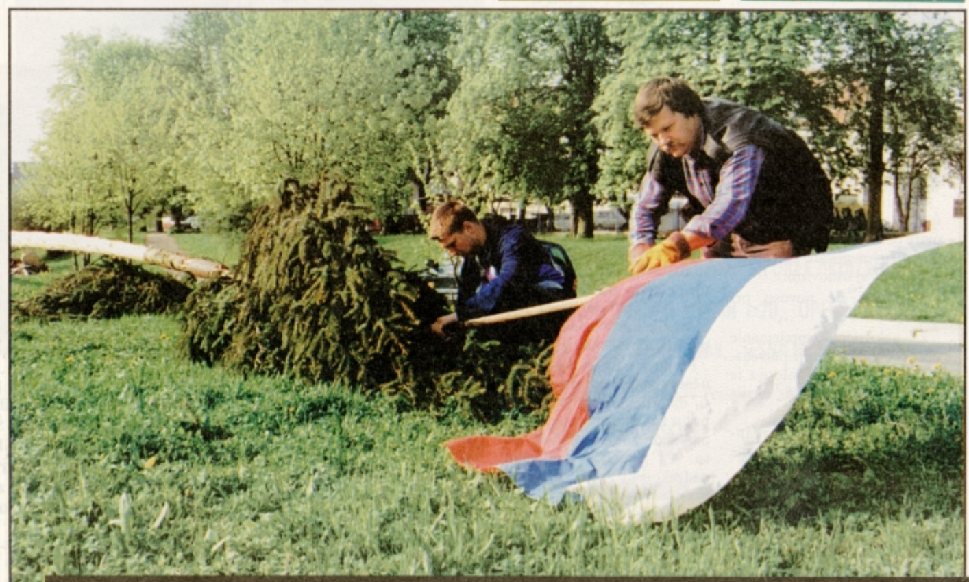
Na vrhu majskega drevesa že peto leto slovenska zastava.