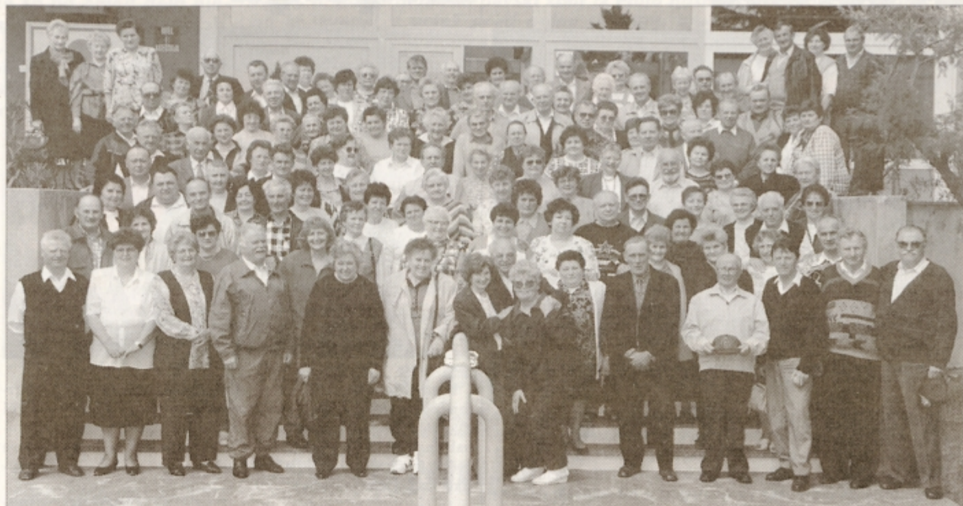
Udeleženci izleta pred hotelom MIMOZA, kjer smo bivali.

Že prvi večer okoli polnoči je ene od udeleženk dobila srčni napad, ki bi bil za njo usoden, če ne bi bilo hitre medicinske pomoči. Medicinska sestra in vodstvo izleta so hitro ukrepali