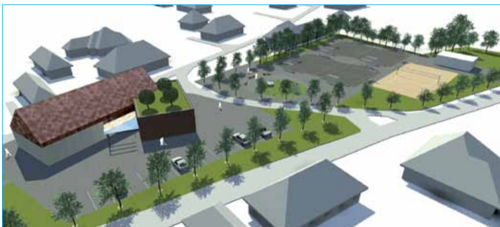
Prikaz ureditve večnamenskega centra Sobetinci

Operacijo delno financira Evropska unija, in sicer iz Evropskega sklada za regionalni razvoj. Operacija se izvaja v okviru Operativnega programa krepitve regionalnih razvojnih potencialov za obdobje 2007–2013, razvojne prioritete Razvoj regij, prednostne usmeritve Regionalni razvojni programi za obdobje 2012–2014.