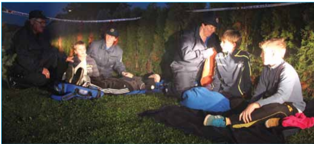
Postroj ob koncu vaje