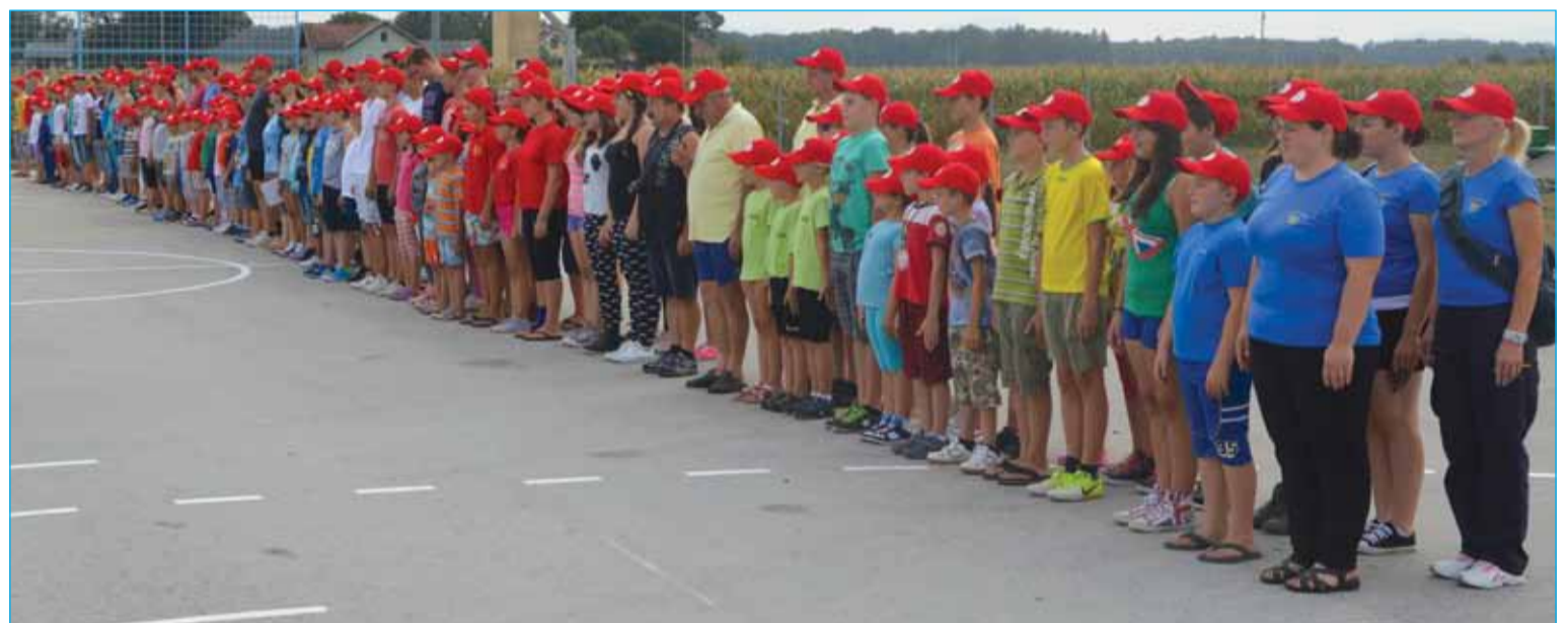
Skupinska fotografija udeležencev z mentorji