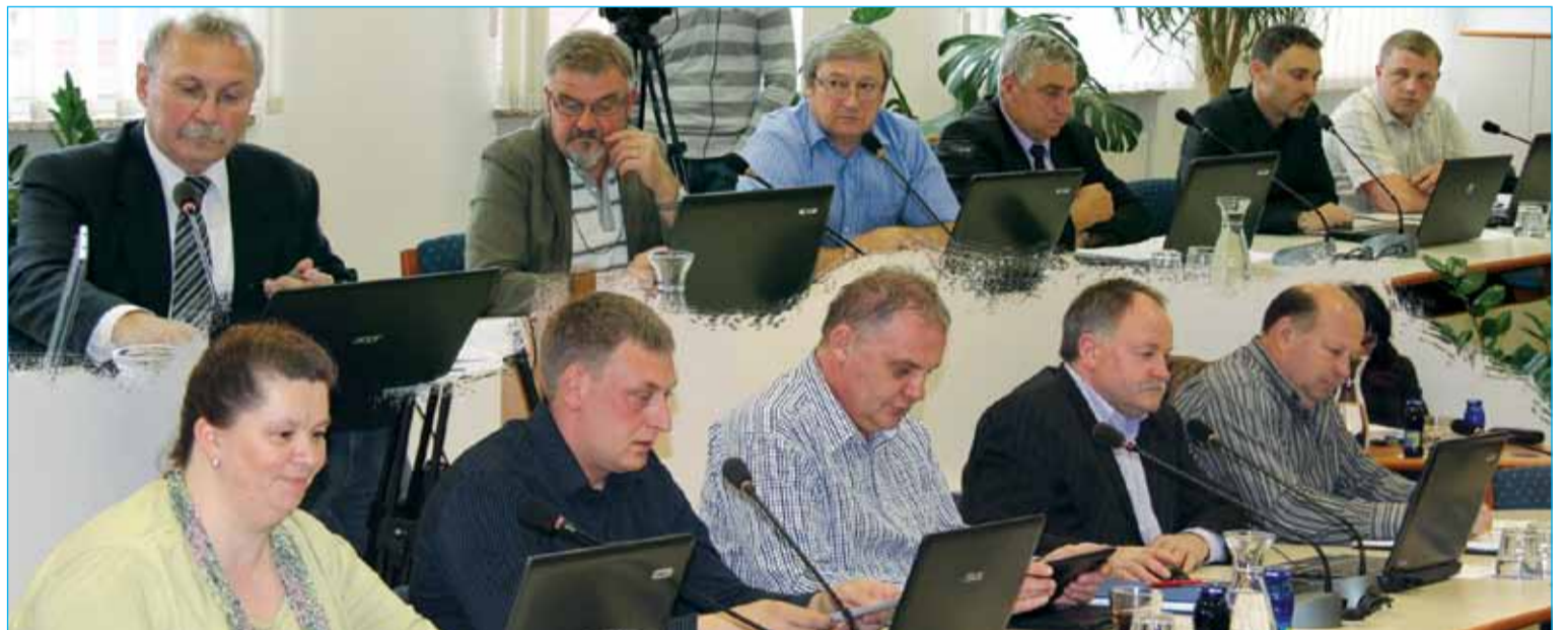
Člani občinskega sveta občine Markovci