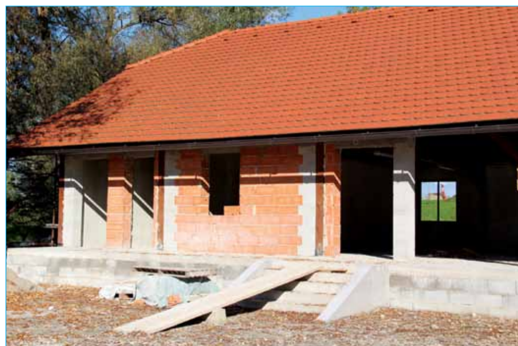
Gradnja ribiškega doma

ŠRD Markovci ima 65 članov, društvo je aktivni organizator raznovrstnih ribiških tekmovanj. Med drugim so prireditelji meddruštvenih tekmovanj, organizirajo dru-