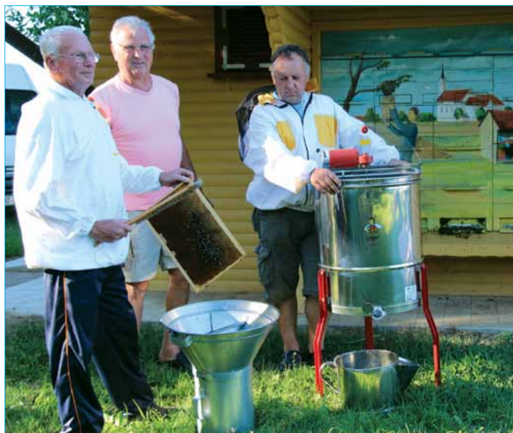
MZ Točenje medu v mesecu juliju

Jesen pa je tudi čas, ko se sezona čebelarjenja zaključuje. Medtem ko se zadnji med toči v poletnem času, je potrebno v jeseni čebelje družine pripraviti na zimo, jih nahraniti in panje pred zimskim mrazom ustrezno zaščititi. Ker čez zimo v čebelnjaku ne bo dela, bodo čebelarji ta čas prav gotovo izkoristili za strokovna izobraževanja in se udeležili predavanj, ki bodo organizirana bodisi v okviru zveze čebelarstva društev bodisi v okviru društva.