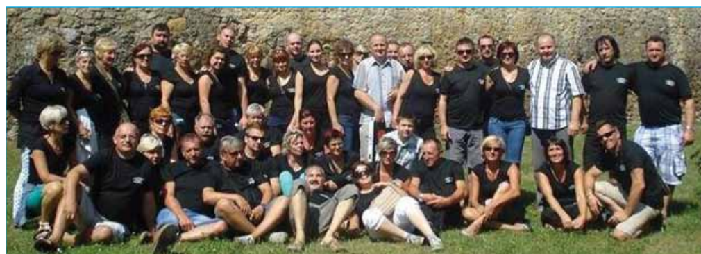
Člani TD občine Markovci na gostovanju na Poljskem