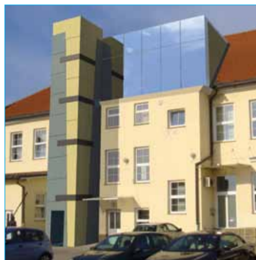
Umestitev osebnega dvigala ob občinski stavbi

Gre za dva projekta, financirana iz različnih virov, ki pa sta z vidika gradnje medsebojno povezana, zato je seveda smiselna istočasna izvedba obeh projektov z enim izvajalcem.