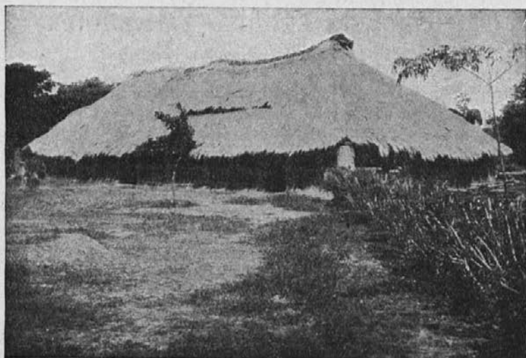
Siromašna misijonska cerkvice — prav tako kot betlehemeski hlevček

naprej brezpogojno zaupal v Boga. Ljubi Bog naj mi odpusti, ako sem kdaj ob prazni blagajni skoro obupaval, saj nisem prostovoljno, vendar je bila tudi ta preizkušnja dobra zame. V prihodnje pa tudi ob največjih težavah ne bom obupal.