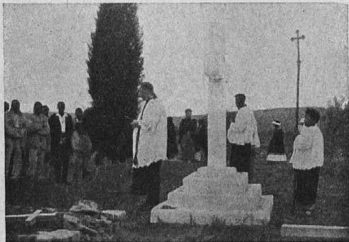
Misijonsko pokopališče v Pretoriji