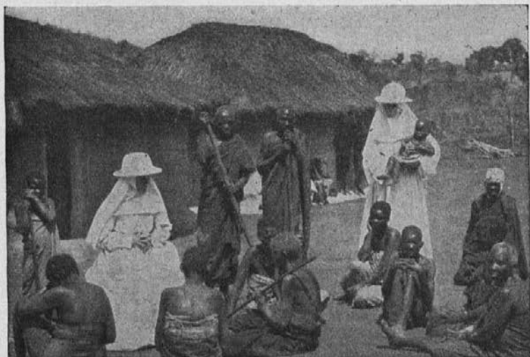
Pred misijnsko lekarno