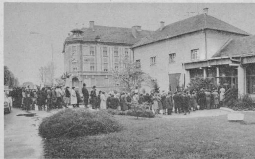
Pred delavskim domom Franca Krambergerja v Ptujju, kjer je dnevno odprta knjiga žalosti od 7. do 19. ure se stalno pomika dolga vrsta delavcev, kmetov, delovnih ljudi in občanov ptujjske občine vseh starosti

Delo in vpliv tovariša Tita sta vtakana tudi v revolucionarno pot slovenske partije in v slovensko delavsko gibanje. Tito je razmere v Sloveniji vedno poznal zelo dobro in skupaj z Edvardom Kardeljem, Borisom Kidričem in drugimi revolucionarji je oblikoval nadaljnjo strategijo našega revolucionarnega boja z njeno narodnoosvobodilno razsežnostjo vred. Enako kot boj za novo Jugoslavijo je bil za nas pomemben tudi Titov prispevek v boju za združeno Slovenijo, za pravice naših manjšin zunaj naših meja in za prijateljske odnose z našimi sosedmi. To je bil čas revolucionarnih sprememb v sami partiji, v katero je Tito vnesel novega revolucionarnega duha, tako zelo različnega od dogmatičnosti in doktrinarstva, ki se je razširilo pod vplivom Kominterne