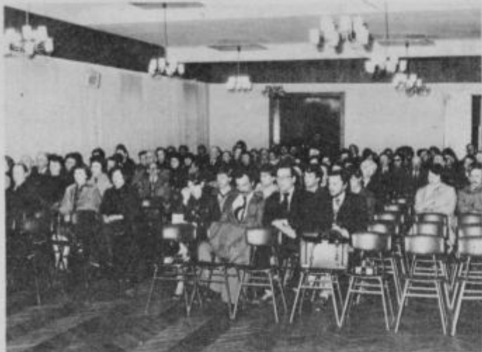
Žalni zbor krajanov KS Boris Zihel Ptuj v avli Centra srednjega usmerjenega izobraževanja

Z globoko žalostjo se zavedamo, kaj je s tovaršem TITOM izgubila vsa naša domovina, z neizrekljivo bolečino v srcu dojemamo, da smo izgubili največjega človeka naše revolucije. Ta kruta in neizprosna resnica, nas je zadela v trenutku, ko je v naših srcih še tlela iskrica upanja, ko smo se pripravljali na praznovanje našega skupnega praznika vseh krajevskih skupnosti mesta Ptuj, praznika osvoboditve in končne zmage nad fašizmom, praznika, ki je tako tesno povezan z vlogo in osebnostjo maršala TITA.