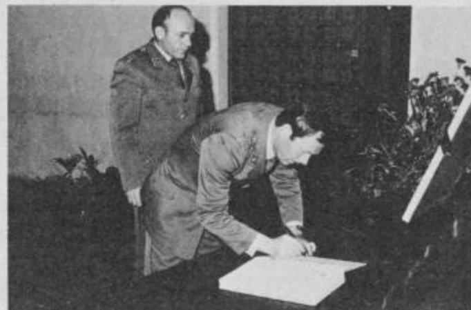
V knjigo žalosti so se med prvimi vpisali tudi vojaki in starešine ptujjske garnizije JLA

V vseh organizacijah združenega dela, v samoupravnih delovnih skupnostih, ptujjski vojašnici Dušana Kvedra, v