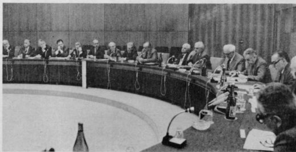
Skupno zasedanje predsedstev SFRJ in CK ZKJ pod predsedstvom Lazarja Koliševskega, ki je bilo v Beogradu, 7. novembra 1979, kjer so sprejeli temeljne usmeritve družbeno ekonomske politike tudi za leto 1980. Na seji je imel uvodno poročilo Veselin Djuranović, predsednik zveznega izvršnega sveta in član predsedstva CK ZKJ

Obljubljamo, da se bomo za ta načela dosledno in povsod bojevali, bojevali za tako socialistično samoupravno demokracijo, v kateri ni možnosti za uveljavljanje privatističnih ambicij in karierizma, v kateri se vse posamične funkcije vse bolj in bolj podružbljajo. S tem uresničujemo Titovo pot, s tem bomo pripomogli, da se bo Jugoslavija v stabilnih razmerah še naprej uspešno razvijala kot socialistična, samoupravna in federativna skupnost.