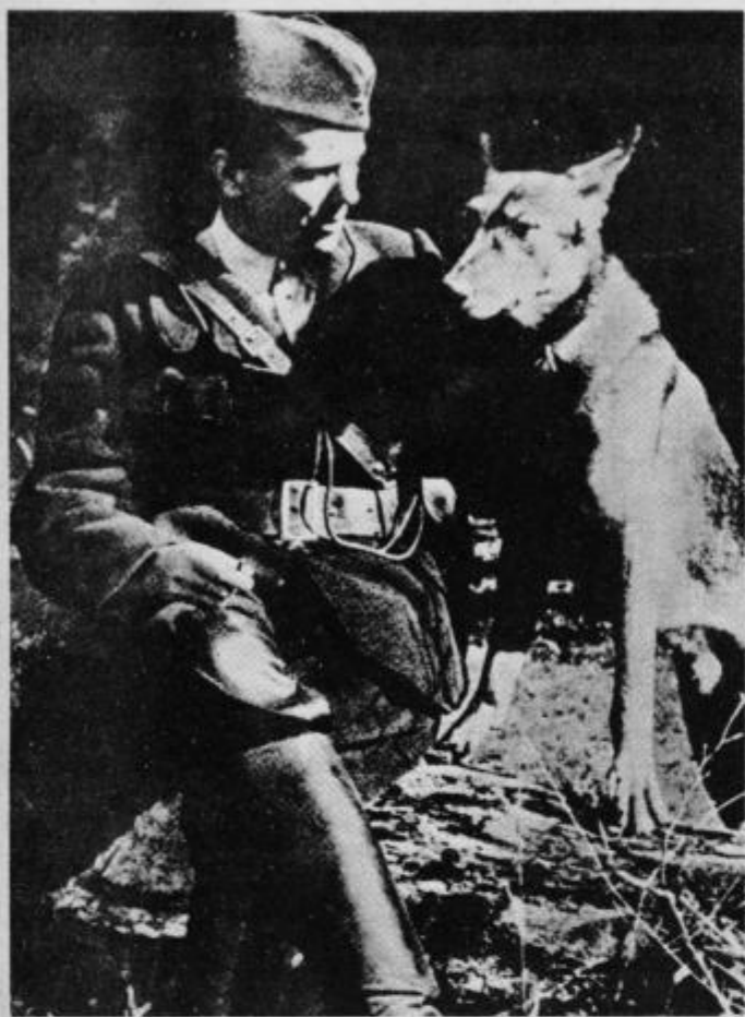
Vrhovni komandant TITO s psom Luksom, ki mu je junija 1943 na Sutjeski rešil življenje

Tito je zrasel z delavskim gibanjem, zanj je živel in za uresničevanje se je vedno dosledno bojeval. Tito je s svojim prispevkom ustvarjalno oblikoval naš zgodovinski položaj. Za vse Titovo ustvarjalno življenje, za vso njegovo revolucionarno dejavnost, je bistveno — vedno je stal na realnih tleh. Ohranil je neokrnjeno ljudskost, moč in ideje je vedno črpal iz ljudstva. Nikdar ni verjel v nadljudi, vedno v človeka. Zato je tudi