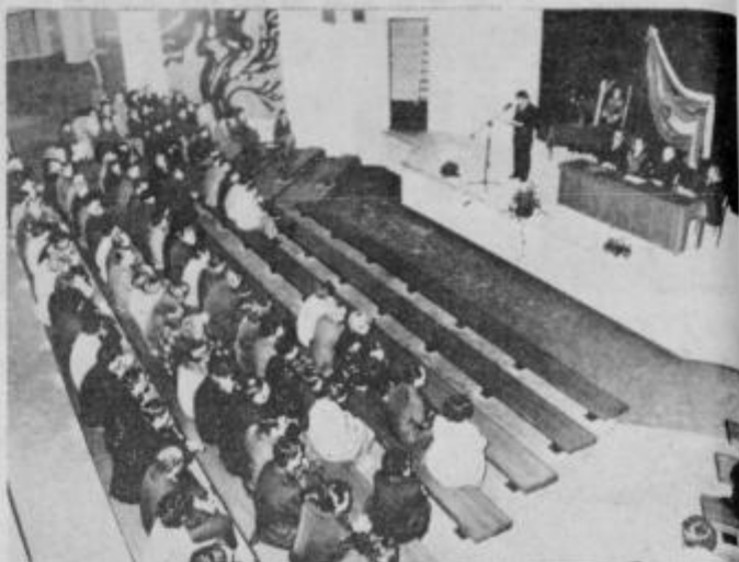
Žalni zbor krajanov KS Jože Potrč Ptuj v dvorani Narodnega doma

Krajanje krajevske skupnosti Boris Zihel Ptuj