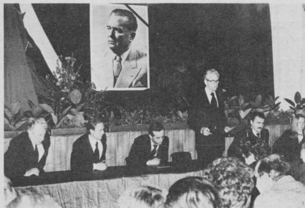
Delovno predsedstvo osrednje žalne seje, ki je bila v ponedeljek v dvorani mestnega kina v Ptujju. Seje se je udeležilo nad 400 delegatov iz vseh samoupravnih in družbenopolitičnih struktur v občini