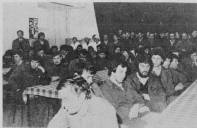
Delavci obrata v Dolanah v nemi žalosti na žalni komemoraciji