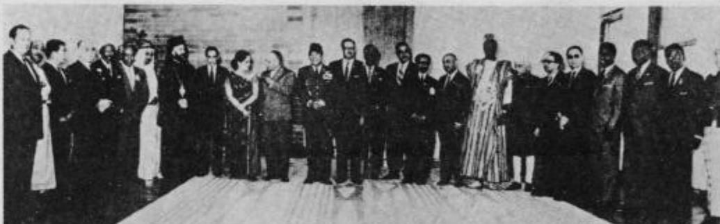
Udeleženci prve konference voditeljev držav in vlad neuvrščenih septembra 1961 v Beogradu

V novoletni poslanici je tovariš Tito povedal: »To je daljnosežnega pomena, kajti gibanje in politika neuvrščenosti se čedalje odločneje postavlja po robu blokavskemu tekmovanju in delitvi, posledice česar nevarno ogrožajo ves svet...« Naš velik dolg tovarišu Titu je, da kar najbolj enotno podpiramo, uresničujemo in nadaljujemo politiko neuvrščenosti, kar bo tudi realen prispevek k ustvarjanju ugodnejšega ozračja za reševanje nevarnih kriz v raznih delih sveta.