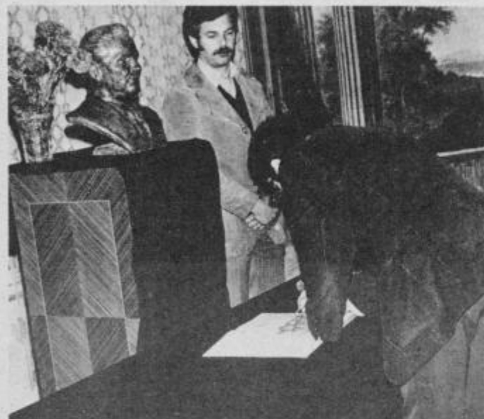
Nemo, z bolečino v srcih so se Ormožani vpisovali v knjigo žalosti in se tako še zadnjič poklonili spominu tovariša Tita.

neomajna volja in jasno začrtana razvojna pot pa bo ostala v srcih vseh naših ljudi, narodov in narodnosti za vselej! JB