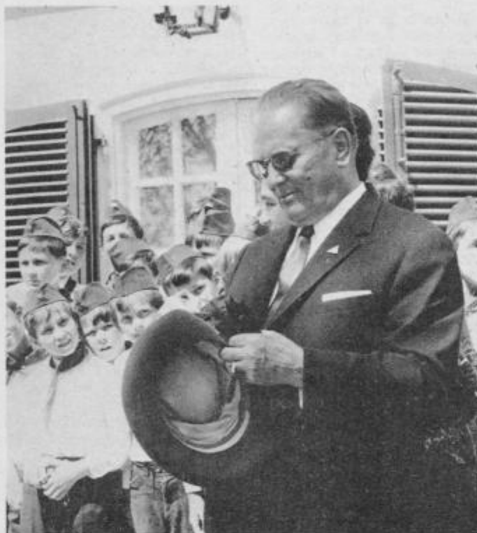
Ptujski pionirji so prosili tovariša TITA, da bi se fotografiral skupno z njimi