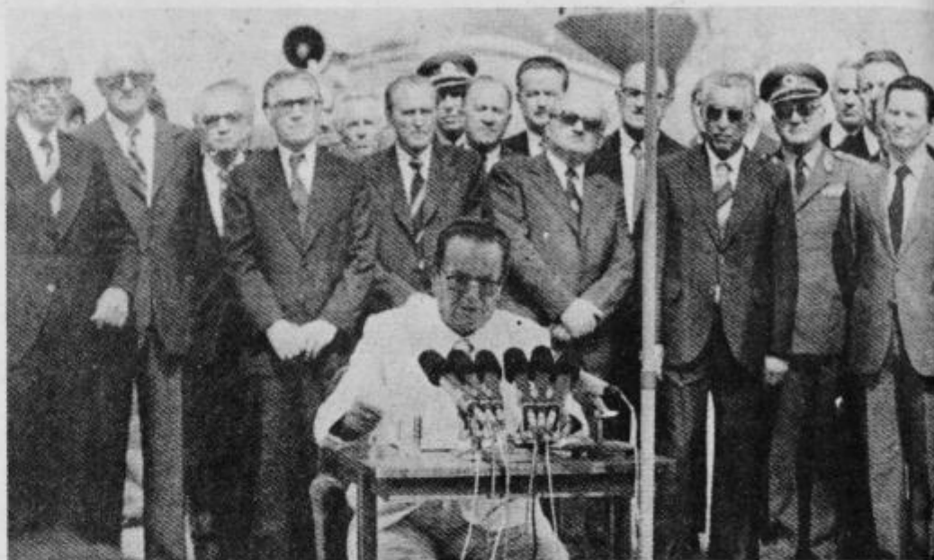
Predsednik Tito govori občanom Jugoslavije po vrnitvi s šeste konference neuvrščenih v Havani

Umirjene, trezne in kot biseri čiste resnice v besedah tovariša Tita na konferenci v Havani, so odločilno vplivale na predstavnike več kot sto držav, dveh tretjin človeštva, na javnost vsega sveta, da so bila in sprejeta izvirna načela neuvrščenosti in uveljavljena kot trajne vrednosti. Brez izredne