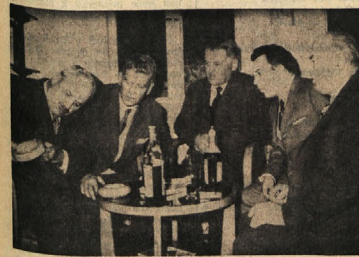
Na županstvu v Repentabru