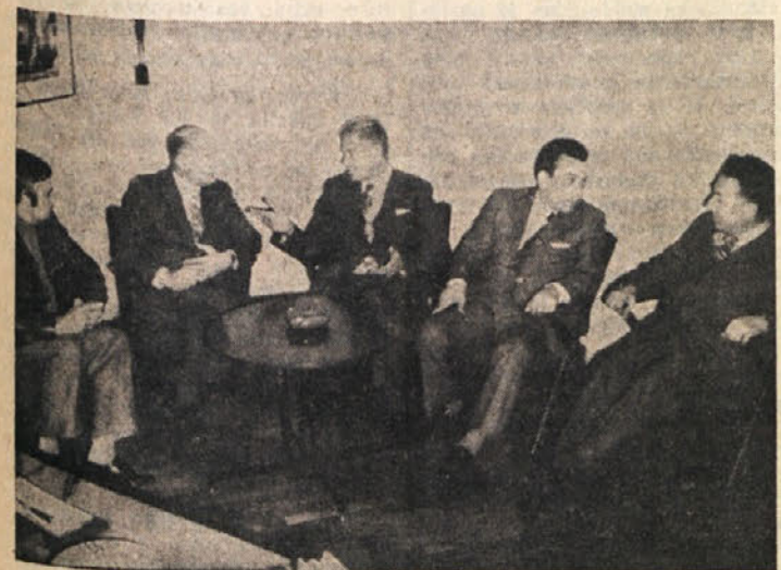
Na razgovoru v Milji

Razgovarjal se je z občinskimi predstavniki Milj, Zgonika, Nabrežine, Repentabra in Doline