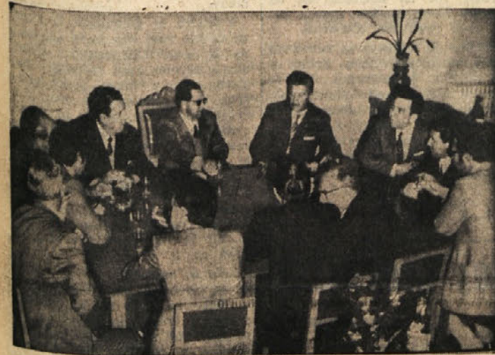
Na županstvu v Nabrežini