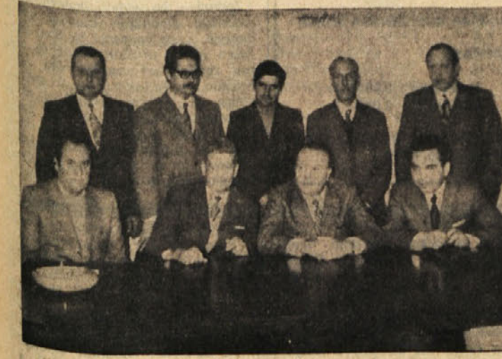
Na županstvu v Dolini