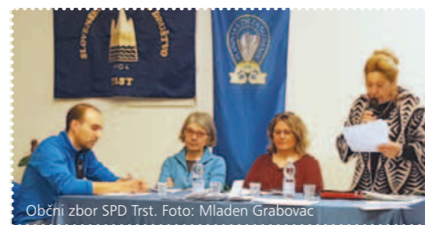
Občni zbor SPD Trst.