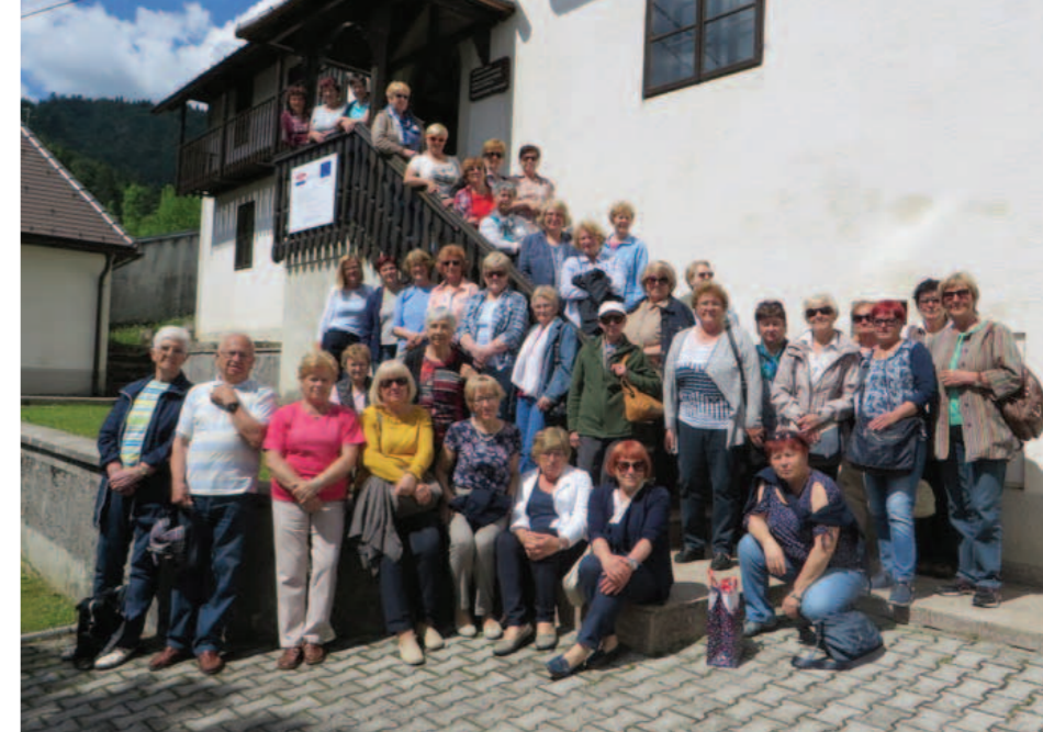
Pred knjižnico.