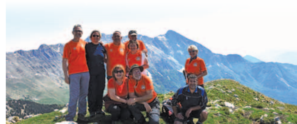
Na Krasjem vrhu, v ozadju Krn.