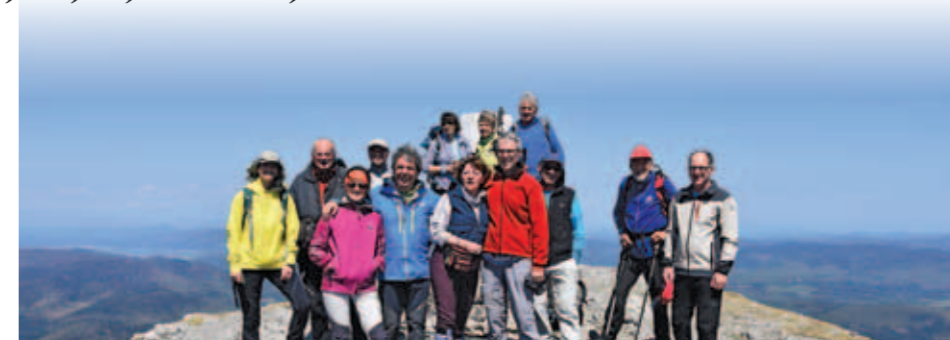
S srečanja skupine A. Arhiv Darka Moharja.

Tržaški planinci iz SK Devin iz Nabrežine, ŠD Sloga iz Bazovice in SPD Trst ter planinci PD Snežnik iz Ilirske Bistrice in PS KPD Bazovica so se prvič srečali pred trinajstimi leti na Črnih njivah nad Ilirsko Bistrico. Srečanja so se vrstila, druženja postajala vse pogostejša in izpeljani številni drugi skupni izleti. Raslo je tudi veselje do medsebojnih srečanj. Tako je bila prisrčnost značilnost tudi letošnjega srečanja, čeprav so se tržaški planinci in vodja PS Bazovica videli le teden dni prej na Krku na prelepem pohodu do Vele luke. Letos so organizatorji iz Ilirske Bistrice pripravili dve turi, lažjo in suho do kočice na Kozleku, za katero se je odločila večina udeležencev, ter snežni in beli vzpon na Snežnik. Načrtovani vzpon na Planinc je zaradi obilice snega v gozdu žal ostal za cilj šestnajstega pohoda čez tri leta. Po vrnitvi vseh udeležencev s tur je sledilo še užitvaško druženje pred domom na Sviščakih, v lepem in toplem vremenu. Žal se dogodka zaradi bolezni ni udeležila pred-