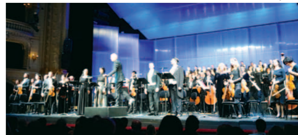
Izjemen večer.

Reško občinstvo se je z dolgim aplavzom zahvalilo za enkratno, globoko doživetje. Glasba je čudovita povezava med ljudmi, v pravem trenutku in v času, ko se Reka pripravlja, da postane evropska prestolnica kulture."