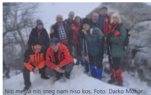
Niti meгла niti sneg nam niso kos.

Kljub slabi vremenski napovedi so se planinci Bazovice držali tradicije in svoje dame ob dnevu žena popeljali v hribe. Zaradi goste megle in visokega snega je namesto vzpona na Velo Pliš, visoko nad tisoč metrov, prišel v poštev rezervni načrt, vzpon na Kamenjak nad Grobniškim poljem. Čeprav je bila skupina majhna, so se pogumno odpravili na zasneženi in delno poledeneli Kamenjak, prisopihali na vrh in na njem lahko uživali, predvsem v družbi. Razgleda ni bilo, tudi kakšno kapljico dežja je s sabo prinesel južni veter. Družba se je podvojila na družabnem delu v eni od "grobniških oštarij". Razpoloženi planinci, dobra hrana in vrtnica za vsako izmed dam so pripomogli k temu, da se je druženje zavleklo daleč proti večeru. Tradicije so zato, da jih ohranjaš.