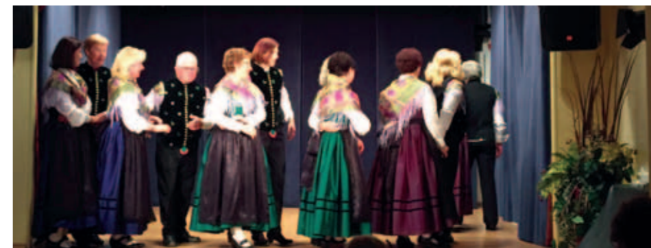
SKD Ajda v vedrem razpoloženju