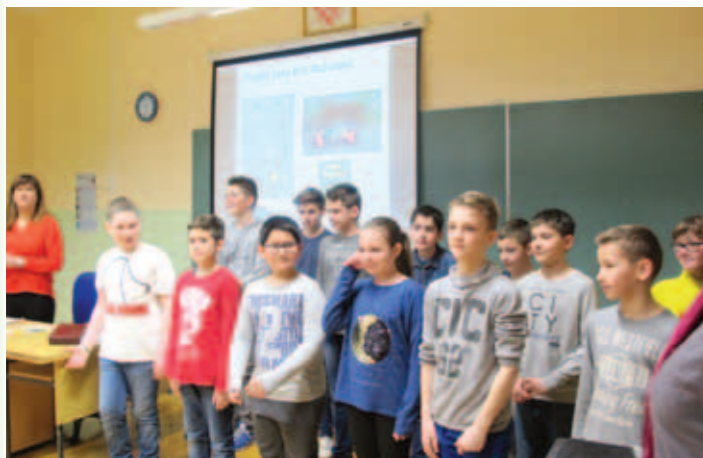
Z nastopa in srečanju na OŠ Pečine.