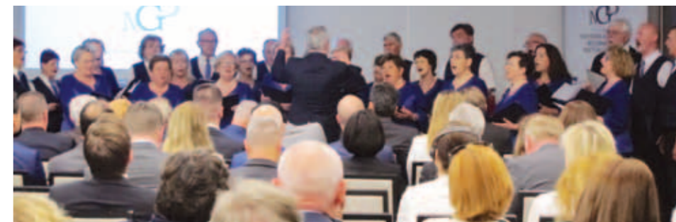
Z obiska v KPD Bazovica. Arhiv društva.

MePZ KPD Bazovica obogatil konferenco. Foto: Marjana Mirković