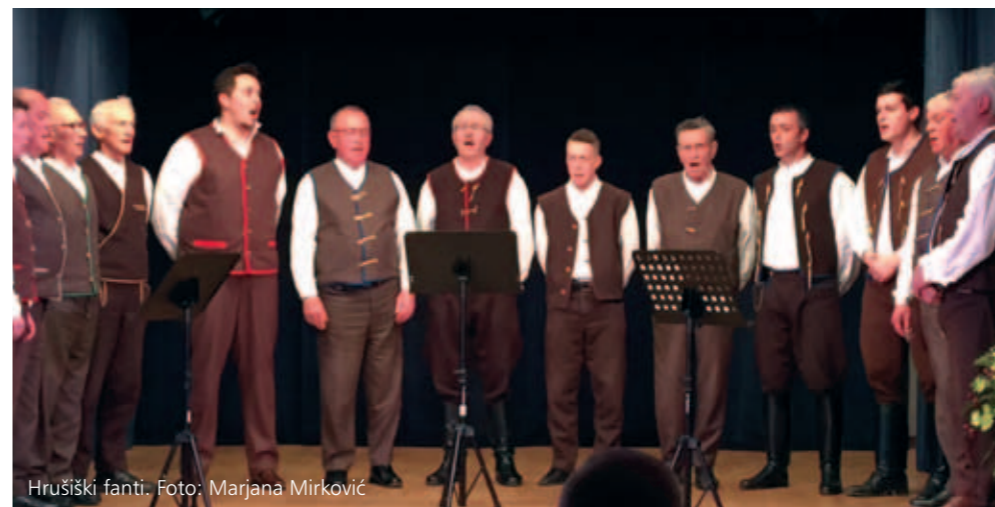
Hruški fanti.