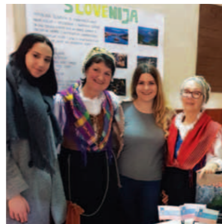
Članici KPD Bazovica z dijakinjama.

Srednja ekonomska šola Mijo Mirković z Reke praznuje letos 107 let delovanja. Dijaki in profesorji so ob tem pripravili zanimiv in bogat program z