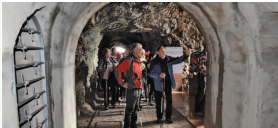
Po sledeh soške fronte.

Skupni izlet z Obalnim PD iz Kopra, imenovan Kjer se stekata Soča in Kras, se je dolgo kuhal, no, na koncu je izpeljan brezhibno. Določen je bil vzpon iz Gaberja na Debelo grižo na doberdobskem območju, kjer se Soča dotakne tržaškega krasa. Številne trobentice, jesenski podlessek, kot sneg bele vijolice in drugo zgodnje spomladansko cvetje nakazujejo, da se bo zima le morala umakniti iz teh krajev, čeprav oblaki in mrzli veter na začetku vzpona niso kazali na to. Nad Brestovcem se je prikazal tudi kanček sonca, še vedno ne preveč toplega. Tam so si planinci