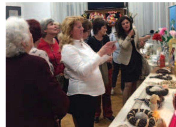
Bogata razstava KPD Snežnik in Branka Širola.