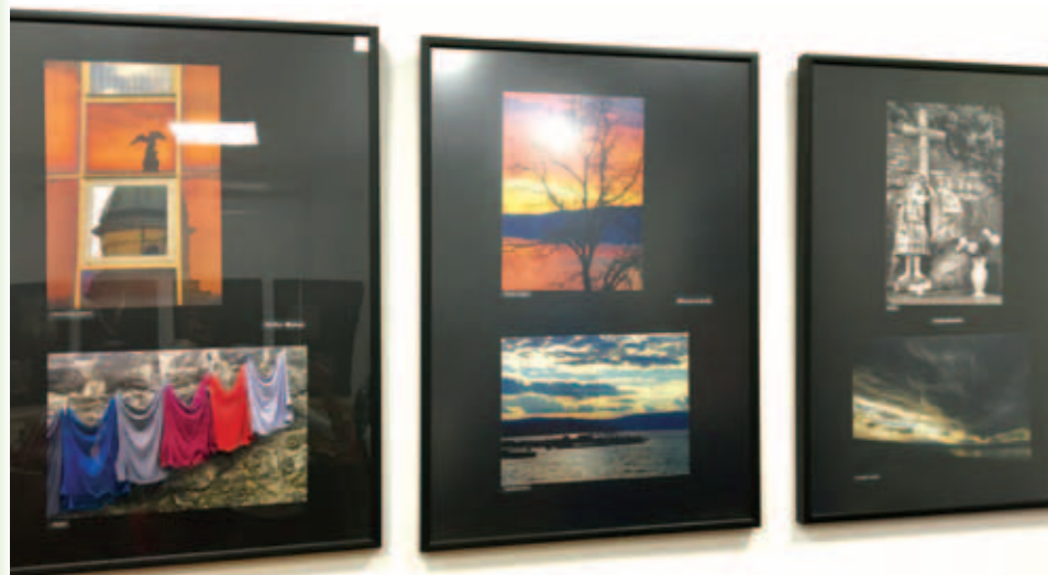
Z razstave Tempus