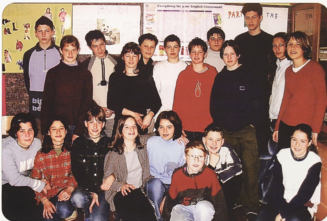
7.C V 7.c pravijo, da gre Slovenija naprej, vključno z njimi.