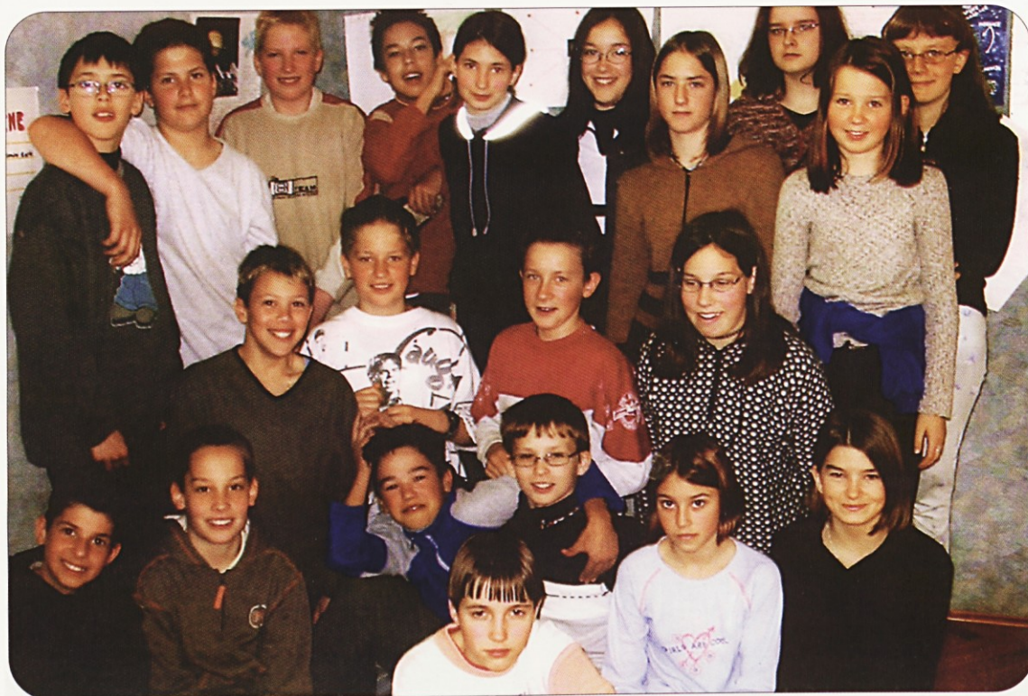
5.A V petem a nam je anonimna oseba povedala, da radi nagajajo in se zbadajo.