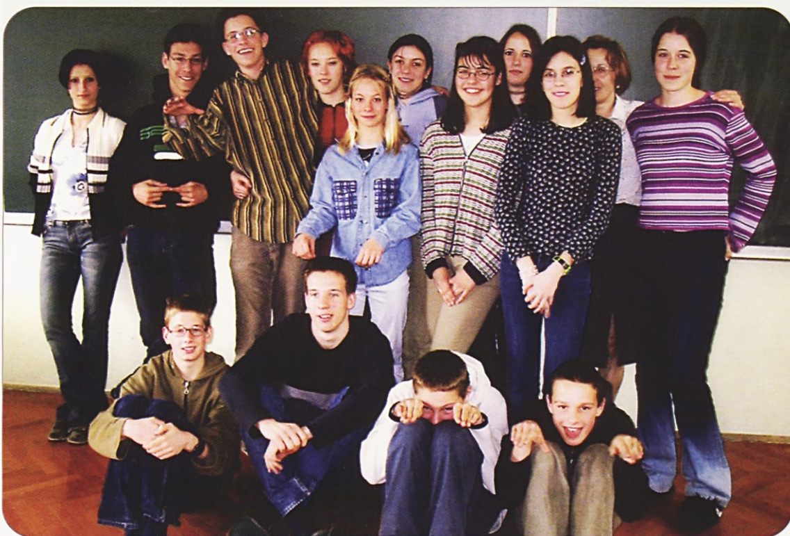
8.A "Smo prijazen razred, ki zna učitelje očarati ali jih spraviti v slabo voljo."