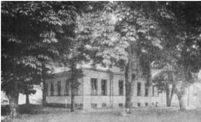
Sl. 3. Kuhinja, 1913.