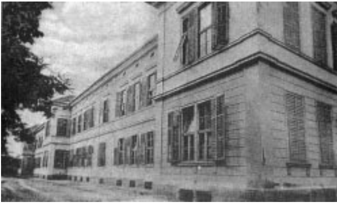
Sl. 1. Medicinska stavba, 1913.