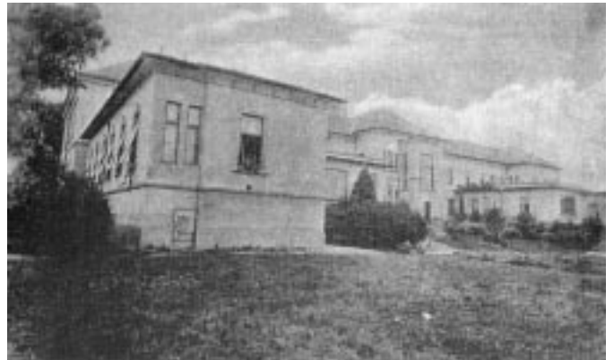
Sl. 4. Kirurška stavba, 1913.

jev, Leobnu 52 goldinarjev in pol, v Knittenfeldu in Judenburgu pa 75 goldinarjev (10). Dve leti zatem se je v mariborski bolnišnici zdravilo že 1116 bolnikov, odpuščenih jih je bilo 921, umrlo pa jih je 99 (umrljivost je bila nižja od 9%, če odštejemo neozdravljivo bolne, pa nižja od 4%). Med umrlimi in neozdravljivo bolnimi je bilo petnajst bolnikov z vodenico, deset s sušico, osem s pljučno jetiko, osem s pljučnim edemom, bolnik z želodčnim tumorjem, eden s srčno napako, eden s sapnično jetiko, dva bolnika sta izkašljevala kri, dva sta utrpela izliv krvi v pljuča, pet jih je zadela kap. Najpogostejše bolezni so bile pljučni katar, gastritis, vročica in mrzlica (11). Leta 1868 (12) so se pri 1215 obravnavanih bolnikih tega leta poleg zgoraj naštetih najpogostejših bolezni pojavili še komplicirani zlomi nog in ranitve, kožne bolezni in bolezni neznanega izvora.