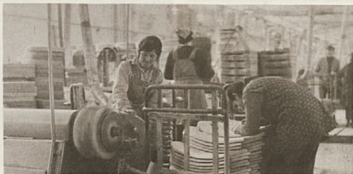
Novi sistem plačevanja je velik prispevek k stabilizaciji gospodarstva.

Kot je razvidno, prinaša nov zakon veliko novega. Gospodarstveniki pravijo, da se bodo kmalu pokazali pozitivni rezultati tega za naše gospodarstvo v tem trenutku izredno pomembnega zakona.