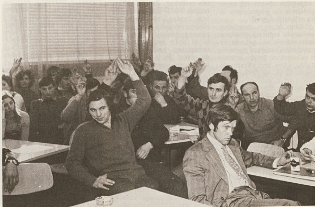
Novi zakon veliko pozornosti posveča zboru delavcev.

O osnutku zakona o združenem delu, tej mali ustavi, bo razprava do jeseni v vsaki delovni organizaciji, v vsaki temeljni organizaciji. In tudi je prav tako, ker delavec dobiva z novim zakonom močno orožje v boju z birokracijo.