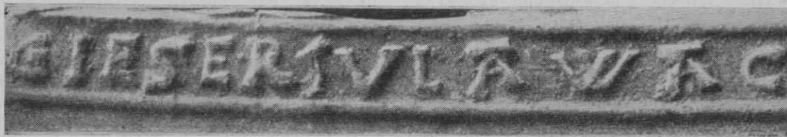
Slika 2. Mojstrski napis livarja Lenarta (reprod. iz Gnirs I, 41)

Tretji zapisek o njem je še iz istega leta, ko ga je mestni svet poslal z »mestne pravde« v petek 9. marca 1537 skupaj z Gregorjem Šorcem26 k ženi Janeza Schona vprašat, ali privoli v prodajo njune hiše, ki je stala »na Starem trgu med Gregorjem Tribavšičem (tribauschitz) in mestnim zidom proti vratom, segajoče gor v hrib« (danes Florijanska ul. 39).27