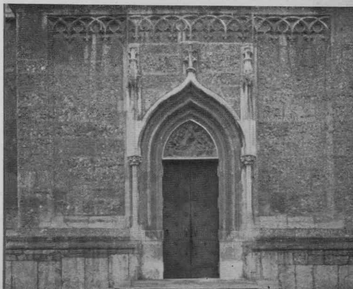
Slika 1. Glavni portal župne cerkve

Kakor more biti zgodovinski prikaz kate- tere koli umetnostne stroke v okviru nekega mesta komaj kaj več kakor registracija usedlin splošnih kulturnih tokov, ki se jim mesto le redko pridružuje s samobitnim ustvarjalnim delom, prav tako velja ta ustgovitev seve tudi za razvojno vrsto arhitekturnih členov, od katerih nas v teh vrsticah zanima usoda portalov v Kranju.