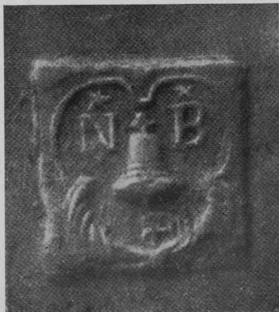
Slika 5. Znak livarja Nikolaja Boseta (reprod. iz Guirs I, 152)

L. 1897 je daroval tedanji turški sultan nemškemu cesarju 9 starih topov. Eden od teh je bil Giesserjev z napisom: »Lienhart Giesser hat mich gossen zu Laibach — Ferdinandus Dei Gratia Romanorum Ungariae et Bohemiae Rex.« 76