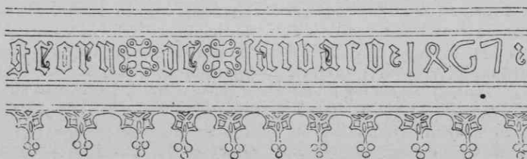
Slika 1. Napis mojstra Jurija Ljubljanskega na zvonu iz l. 1467 v Trstu (reprod. iz Gnirs I, 186)

V zapiskih se sin navaja med leti 1435 do 1445. 4 Sledil jima je »campanator Thomas«, 5 ki se imenuje l. 1446. 6 Naslednji zvonar, ki je deloval v Zagrebu med leti 1458 in 1487, pa ima tudi priimek Zvonar, je Elija Zvonar, livar zvonov, zagrebški mešan, sin Benediktov iz Požege (Ilya — tudi Elyas = zvonar, campanarum fusor, filius Benedicti de Posega). 7 Do l. 1480 se imenujejo v istih virih še trije drugi »campanatores« v Zagrebu, »fusor campanarum« pa je nazvan samo Elija Zvonar. Med leti 1480 in 1523 se imenuje Nikolaj Zvonar (Nicolaus Zwonar, včasih samo Nicolaus campanator), ki je bil mestni svetnik (consilia-