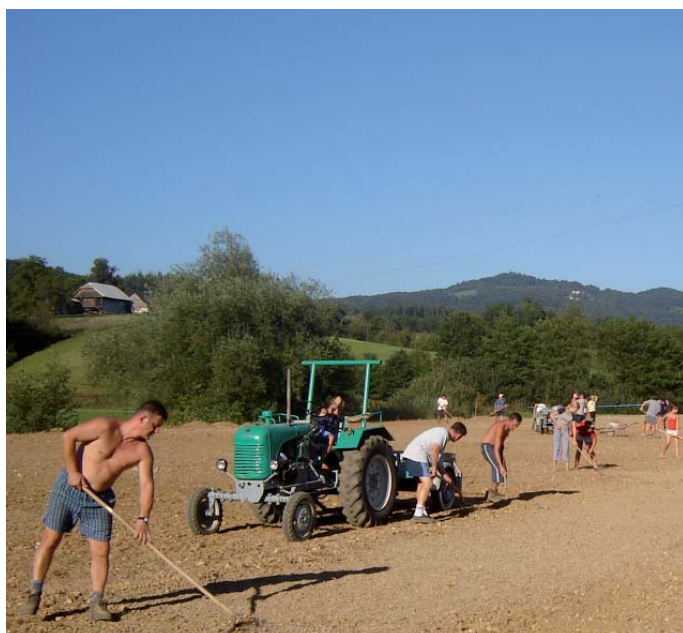
Stara Cegunca - člani društva niso šteli delovnih ur, posebno mladi pa ne žuljev, ki jih je bilo kar nekaj

Sodelovali so na pustem karnevalu na Viru in v pustnem rajanju v Moravčah. Na Kmečkem prazniku v Moravčah so sodelovali v povorki in slikovito prikazali kmečka opravila. Organizirali so dva izleta, za odrasle in za mladino. Izvedli so nekaj standardnih pohodov. Očistili in označili so pot na Miklavž. Obiskali so vse krajanke ob njihovih jubilejih in vse novorojenčke. V kraju so postavili kozolčke in novoletno jelko.