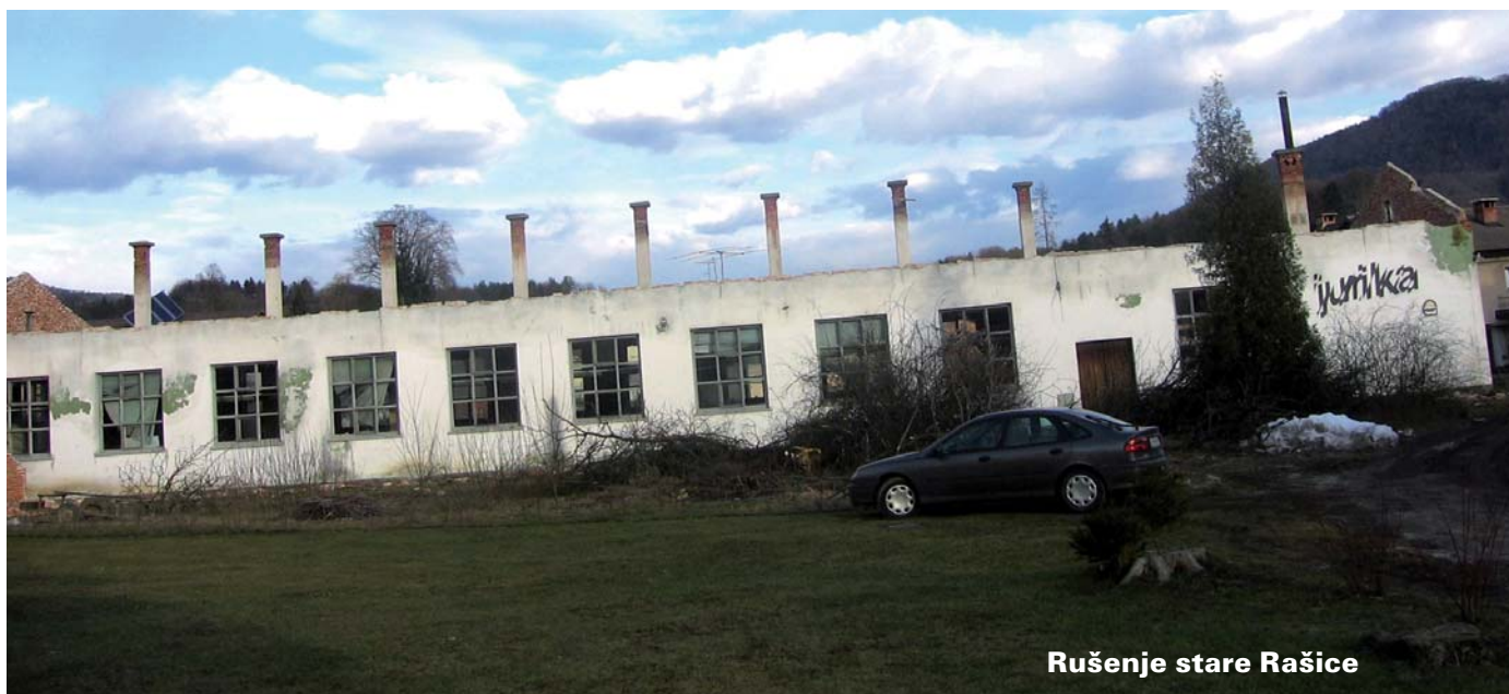
Rušenje stare Rašice