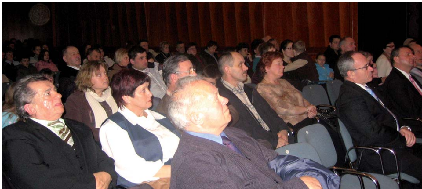
Obisk na prireditvi za kulturni praznik