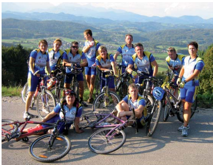
Člani kolesarskega društva ŠKTD Bicikl v domačem okolju

V planu za leto 2009 so predvideli ponovitev vseh dejavnosti iz preteklega leta, nekaj pa so jih še dodali. Tako so v februarju predvideli turnir namiznega tenisa, v juniju