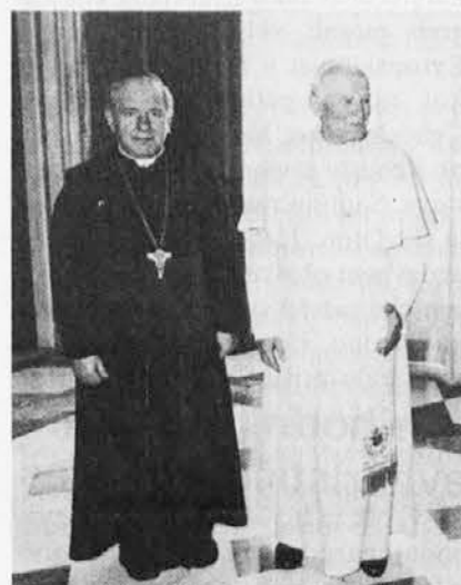
Tržaški škof pri papežu

Letos je sv. oče pozval škofo iz cerkvene province Treh Benečij in iz Južne Tirolske nekoliko nepričakovano, kot pravi msgr. Bommarco. »Ta obisk ni bil programiran v začetku letošnjega leta, temveč v januarju prihodnjega leta«. Toda, čeprav nekoliko nepričakovano, je obisk pri sv. očetu prinesel svoje bogate darove. Predvsem ta, da se je vsak škof osebno razgovoril s papežem. Tako tržaški kot goriški pa ugotavljata, da je bilo osebno srečanje »le kratko«. Poleg tega da se je sv. oče srečal s posameznim škofom na štiri oči, je zadnji dan obiska, v soboto 26. januarja somaševal z vsemi škofi v svoji privatni kapeli, opoldne so vsi škofje s papežem skupno bili pri kosilu. Sedanji papež ima sploh rad kake goste pri zajtrku in pri kosilu.