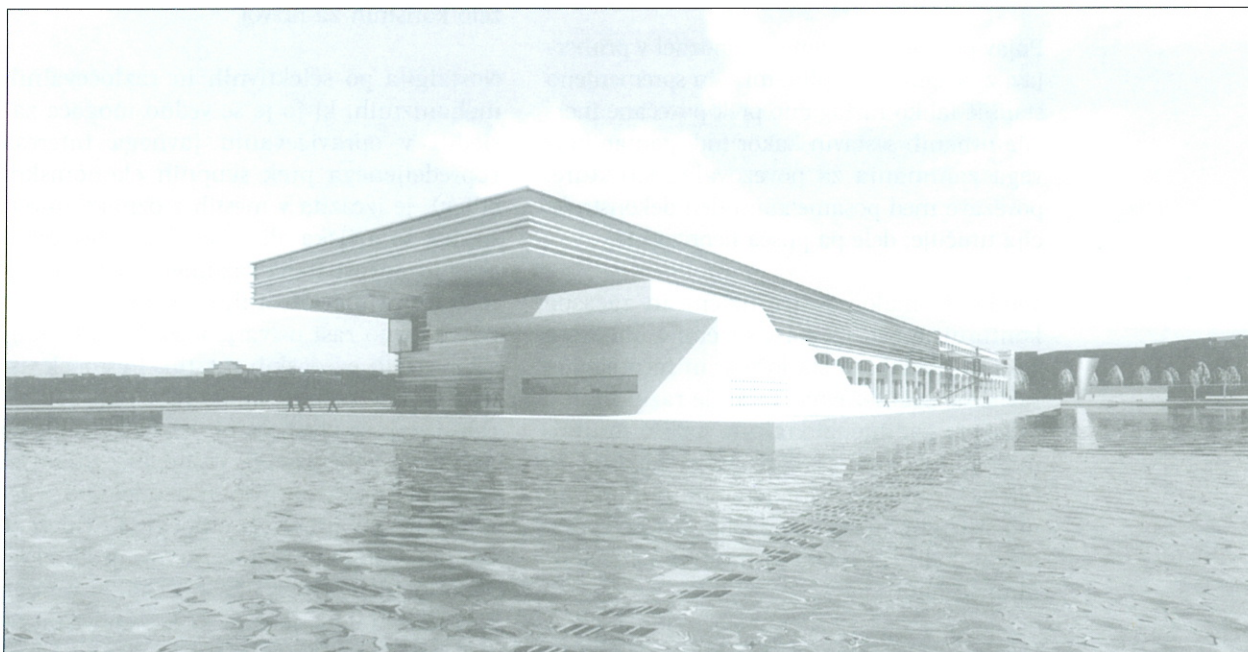
Slika 3: Zmagovalna natečajna rešitev arhitekta Borisa Podrecce za opuščeno opuščena skladišča vina na tržaški obali. Arhitekt je predložil tudi urbanistično zasnovo vsega območja

Vzporedno z upadom urbanih politik za podporo razvoju poteka zmanjšanje razvoja v različnih sektorjih, ki jih označujejo manj pogoste lastne značilnosti in prednosti. Z gledišča planiranja je bil do zdaj osrednji problem prepoznavanje sedanjih virov in njihova distribucija med prostori in družbenimi skupinami. Danes lahko govorimo o smeri, zaenkrat brez teoretskih izhodišč, ki ne razlaga planiranje kot način raz-