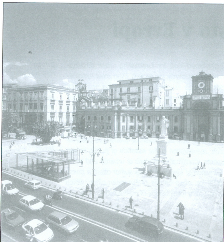
Slika 1: Postaja podzemne železnice Dante v Neaplju, ki jo je zasnoval arhitekt Gae Aulenti, s svojo minimalno strukturo v ničemer ne posega v metafizičen pogled na trg.