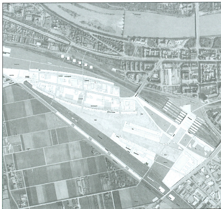
Slika 4: Zasnova območja Bahnstadt v Heidelbergu (arhitekti Venturi, Bezenberger in Brech)

Transformacije v Italiji, na primeru je navidezno nemogoče primerjati z drugimi uvedenimi modeli, temveč s tistimi, ki imajo enako preteklost. Ta pristop napeljuje k prevratu pododanega mesta v skladu z nedialektičnim dihotomnim sistemom. Premagovanje takšnih razmer se približuje koncu, vendar brez hegelijskega konservatizma. Rojstvo mesta