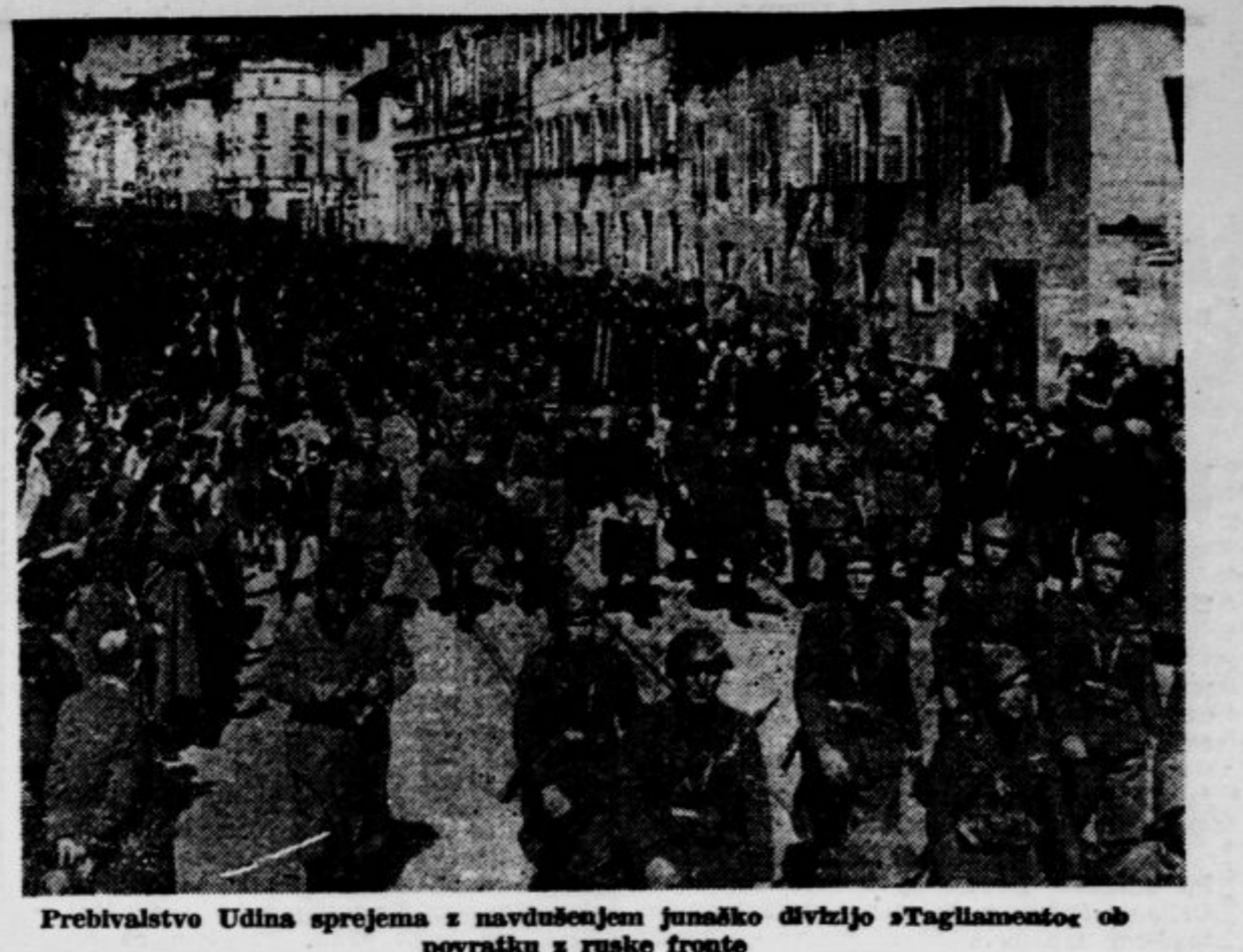
Prebivalstvo Udina sprejema z navdušenjem junaško divizijo »Tagliamento« ob povratku z ruske fronte

LEZIONE DICIASSETTESIMA Bello, si... Ma non cammina Quando guardavano il bimbo, che essa portava sempre in collo, la gota sulla gota, sorridero e dicevano: »Guarda bello! Che angelo! Guarda se non sembra una rossa...«, la mamma lo dondolava un poco, abbassava gli occhi, rispondeva: »Bello, si... Ma non cammina...« Ora lodavano meravigliati i suoi ricciolini biondi e leggeri come piumini d'oro, ora i suoi occhi celesti e illuminati, ora le labbrucce umide come un fiorellino carnoso. »Bello!« esclamavano, sorridero alla madre, che se lo teneva stretto contro la gota, quel suo tutto oro azzuro e rosa. Ma senza sorridero la mamma scoteva il capo e a tutti rispondeva sempre con la stessa voce: »Non cammina...« La mamma abitava in una di quelle immense case giallastre che sorgono sui prati, oltre il fiume, quasi in aperta campagna. Era una casa di poveri e di operai, con tanti piani e tante finestre, e così fitte e nere che, al solo pensiero della moltitudine che l'abitava, c'era da averne orrore. Quando rincassava era buio, e per le scale di quella casa nera brillava appena una fiammellina gialla di ga. Ma né lei né il bambino avevano orrore di quel buio, e lo attraversavano senza fretta. Appunto perché la casa era immensa, la loro stanza era poco meno che un buco e dava sopra un ballatoio che correva tutto intorno al cortile. La mamma accendeva il luce e metteva a sedere il bambino sul ballatoio, nella luce che usciva dalla finestra aperta. Allora voci di donne e