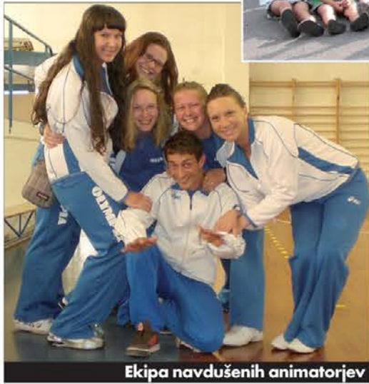
Ekipa navdušenih animatorjev

v Zavod med 7.45 in 9. uro; kdor želi, lahko zapusti središče ob 13. uri, ostali pa, ki jim društvi nudita tudi kosilo, ob 15. uri. Razdeljeni so v starostne skupine. Sedem triletnih otrok je v prvi skupini, več