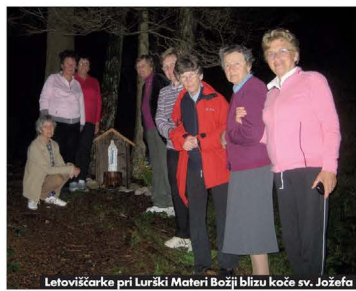
Letoviščarke pri Lurški Materi Božji blizu koč sv. Jožefa

Kljub nestanovitnemu vremenu so se tudi letos odločile poročati k Mariji na Svete Višarje. Ker jim je spomladanska utrujenost odzrla moči, se k Višarski Materi niso povzpele peš, ampak z žičnico. V višarski cerkvi, na stičišču treh narodov, so začutile tisto blagodejno pomirjenost, ki jo zna v srca vlti le Božja bližina. Ukve so jih zvalile na kratak izlet na ogled prenovljene cerkve in hiš, ki jih je pred nekaj leti tako močno prizadela povodenj ob velikem deževju. Zaradi muhastega vremena so najraje hodile na krajše sprehode in se ob večernih urah pomudile pod bližnjimi smrekami, pri kipu Lurške Marije, ki ji je leseno ostrešje naredil oskrbnik