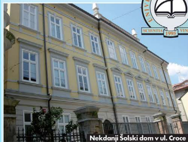
Nekdanji Šolski dom v ul. Croce

preselila tudi nižja srednja šola Ivan Trinko. Leta 1991 sta se učiteljske in klasična gimnazija ter licej skupaj s Trgovsko šolo Ivan Cankar in Tehničnim zavodom Žiga Zois preselila v novo šolsko središče v ul. Puccini, medtem ko je nižja srednja šola po raznih začasnih namestitvah v šol. letu 1996-1997 bila premeščena v ul. Leopardi. Od šol. leta 2006/07 je njen novi sedež v ul. Grabizjo.