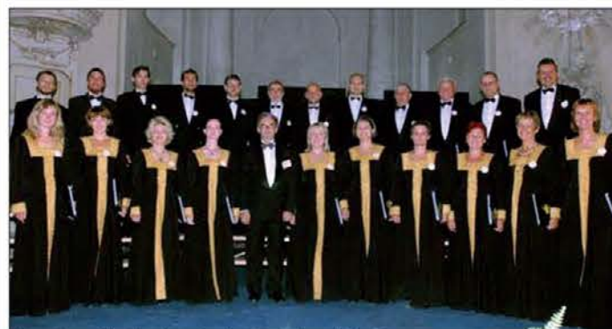
Zbor Cappella Musicae Antiquae Orientalis iz Poznana

pianov, da bi ob glasbi vrednotila besedila z zbranstvo pobožne molitve. Ubrano petje je namreč prepričalo poslušalce brez širine zvoka in dinamičnih kontrastov, ki najbolj prepoznavno zaznamujejo izvajanje pravoslavne literature in je predstavilo zanimivo, alternativno pot za odkrivanje te glasbene in duhovne dimenzije. Predstavniki poljske zborovske scene bodo nastopili v cerkvi na Opčinah tudi v četrtek, 15. julija, ob 20.30, ko bo Slovensko