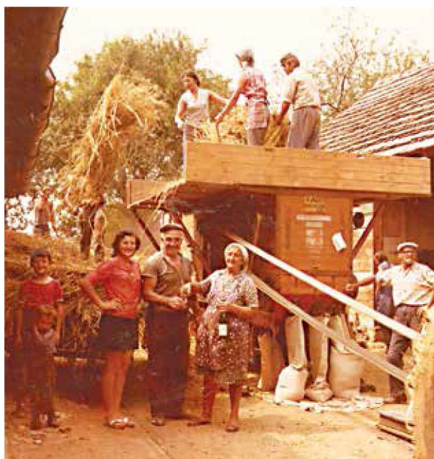
Tako je potekala mlatitev z mašinarom pri Slamarjevih pri Gradu v sedemdesetih letih