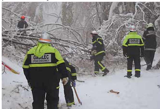
Žled je uničil veliko drevja, ki so ga gasilci odstranjevali

V mesecu februarju smo doživeli ponovno vremensko katastrofo. Ta je bila taka, da nihče ne pomni, da bi se kaj takega že zgodilo. Žled je dobesedno ustavil življenje ljudi na Notranjskem. V objemu žledu je dobesedno bilo vse, kar se premika. Vlaki niso vozili, elektrike ni bilo, drevesa in daljnovodi so se pod težo žledu lomili. Ljudje so bili odrezani od sveta. Da bi se življenje ljudi tam vsaj malo ponovno postavilo na noge, je bilo potrebno veliko pomoči dobrih ljudi.