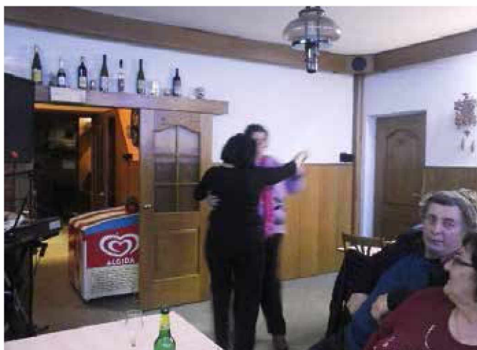
Ženske so se ob ritmih glasbe tudi zavrtele