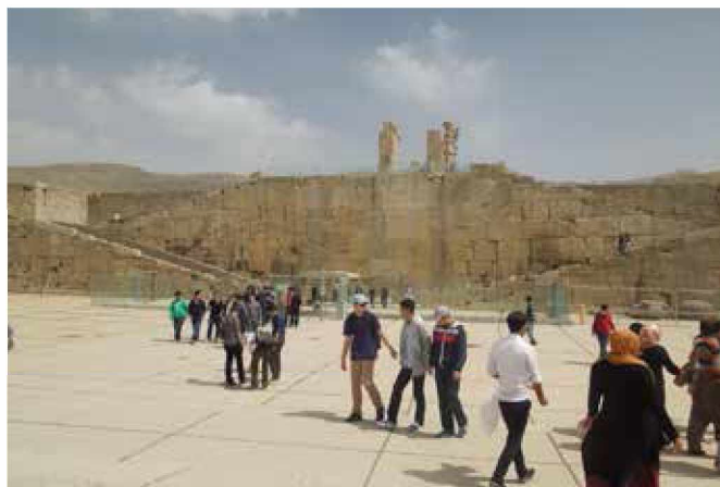
Ostanki Persepolisa