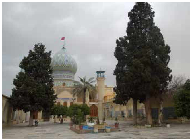
Vrtovi v Shirazu, v ozadju grobnica

Presenečenje so tudi iranske tržnice, kjer ni pretiranega barantanja, predvsem pa ni vsiljivosti, ki jo poznamo iz arabskega sveta. Tudi sicer so Iranci precej drugačni od Arabcev in zelo ponosni na svoje arijske korenine.