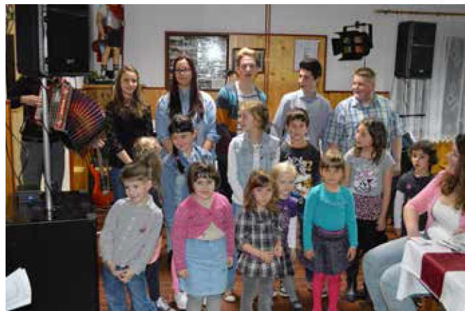
Otroci so zapeli pesem Mamica je kakor zarja