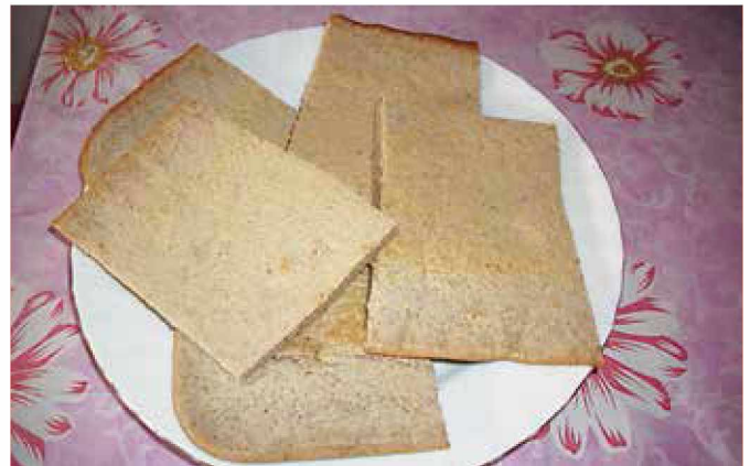
Idinski šterc lahko po želji potrosimo z ocvirki