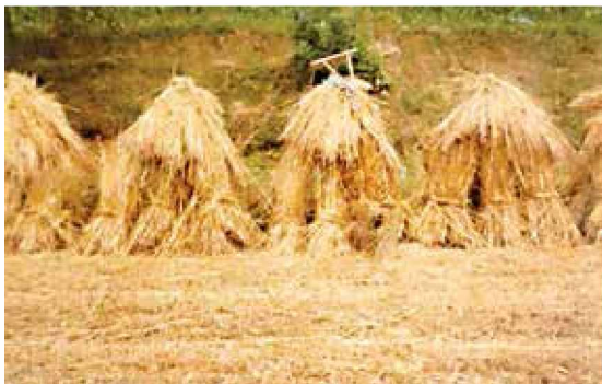
Snope so postavili v kozoro

Marsikdo ne bi vedel, pri čem uporabiti določene predmete in stroje, ki so jih uporabljali pri mlatitvi nekoč. Sploh mlajše generacije in današnji mladi. Žetev je bila nekoč veliko bolj naporna in delovna kot danes. Ni bilo gromozanskih strojev, ki jih lahko v današnjih časih vidimo po poljih.