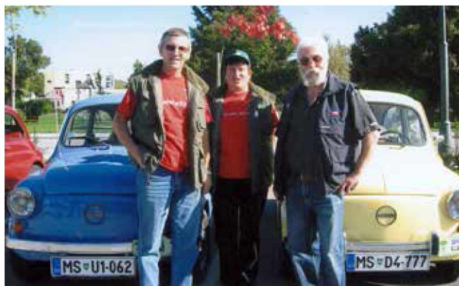
Na srečanju fičkov v Moravskih Toplicah, kjer so se srečali tudi domačini

Naši občani so zvečine ljubiteljski »oldtajmerji«, nekateri pa so že nekaj let člani AMK Goričko (Avto moto klub starodobnikov) s sedežem v Rogašovcih. Seveda so njihova srečanja in dogodki večkrat povezana tudi z našo občino, saj skorajda ne mine skupinske vožnje tudi po naših cestah. »Fički, hrošči, tomosi, puhi ... zatrobijo v pozdrav in zberejo množice radovednih občudovalcev.« Vsako leto pod okriljem APM Goričko priredijo člani kluba otvoritveno vožnjo, oldtajmerski vikend s sejmom, na jesen pa zaključno vožnjo. Seveda so aktivni širom po Goričkem, še posebej pa, če jih kdo povabi na kakšno otvoritev ali drug dogodek.