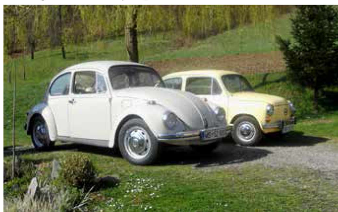
Fiček in hrošč (letnika 1982 in 1973) – last Alojza Ropoše