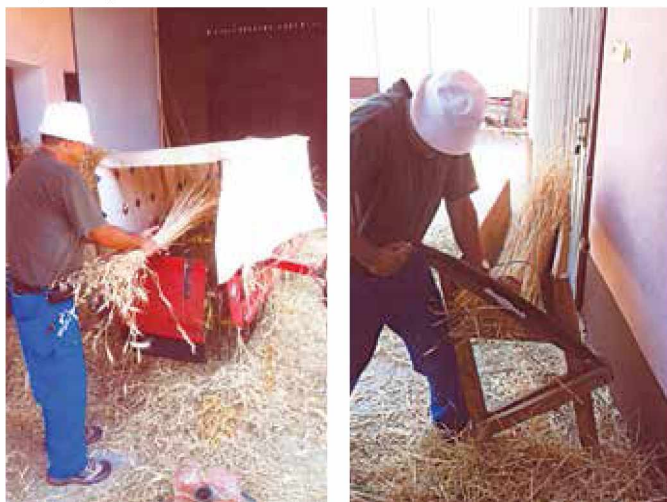
Priprava slame za slamnato streho

Glede na obilico dela, ki je povezano s to dejavnostjo, izdeluje predvsem ptičje krmilnice, božične jaslice, nadstreške, krite s slamo. Kakšnih večjih objektov se žal ne more lotiti, saj bi potreboval dodatno delovno silo in seveda veliko materiala, za katerega pa bi potreboval tudi večje skladišče, kar pa mu finančne zmožnosti ne dopuščajo.