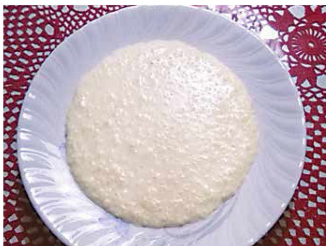
Proseni močnik