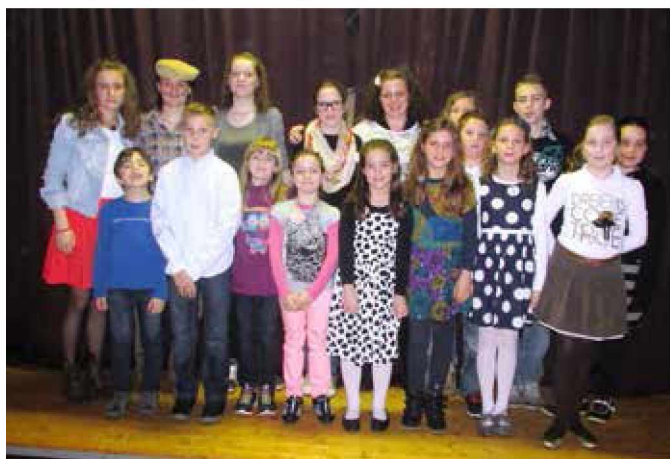
Otroci so poskrbeli za lep večer

V Radovcih smo se v soboto, 8. marca, spet v zelo lepem številu zbrale žene, mame, babice in dekleta, da praznujemo praznik vseh žensk. S tem smo dokazale, da si kljub hitremu tempu življenja znamo vzeti čas za praznovanje, druženje in pogovor s prijatelji in znanci.