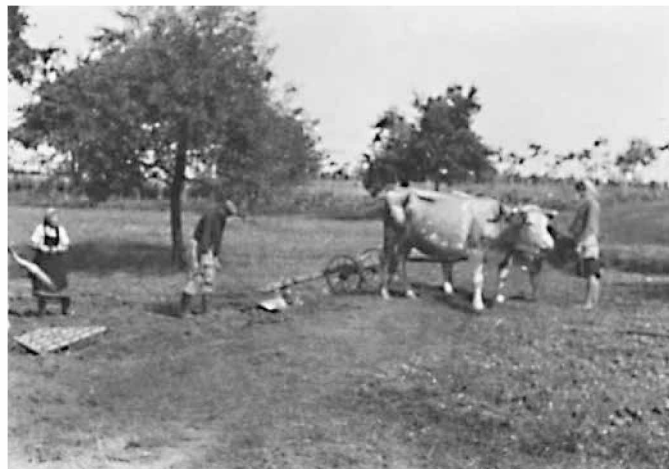
Oranje s kravjo vprego

Nekoč je veljalo, da če je kruh padel na tla, ga je bilo treba vzeti gor in ga poljubiti. Tedaj je kruh veljal za nekaj dragocenega, dandanes ko ga lahko kupimo na vsakem vogalu, nam zagotovo ne pade na pamet, da bi ga še poljubljali, če nam pade na tla. Bodimo odkriti – kruh, ki nam pade na tla, roma v odpad. Odnos do kruha se je zelo spremenil, kot se je tudi spremenil naš odnos do dela, ki pripelje do tega, da imamo na mizi dobrote iz žit. Vse, kar danes lahko naredi strojna mehanizacija v enem dnevu, da so tla pripravljena na setev, je nekoč bil večdnevni proces, ki je terjal veliko moči in vztrajnosti.