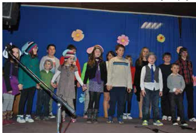
Otroci so mamam namenili lepe besede