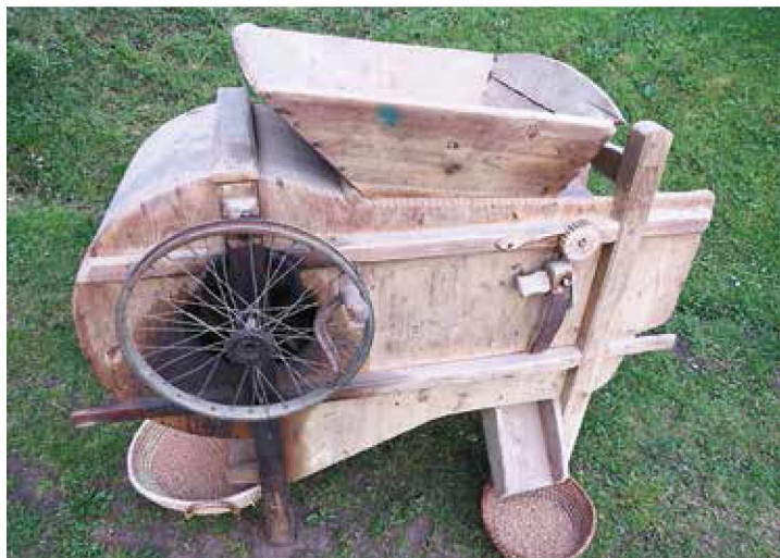
Roštalu (roštal), ponekod imenovan tudi bint