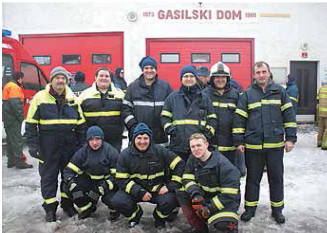
Naši gasilci, ki so šli pomagat