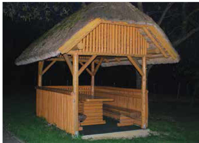
Zasebno ljudje s slamo prekrivajo senčnice, vikende in druge manjše objekte

čez sleme. Nato se postopek ponavlja, dokler streha ni prekrita. Na slemenu se naredi zaključek z ilovico ali vetrnicami. Slama se veže z žico, pred časom pa se je vezala s šibjem (pantovec). Pri pokrivanju strehe se uporabljajo lesena orodja kot so deska za poravnavanje slame, kratka lestev in močna zakrivljena palica. Vendar sam vsa dela opravlja večinoma ročno.