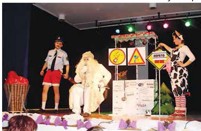
Dedek Mraz s policistom in kravico