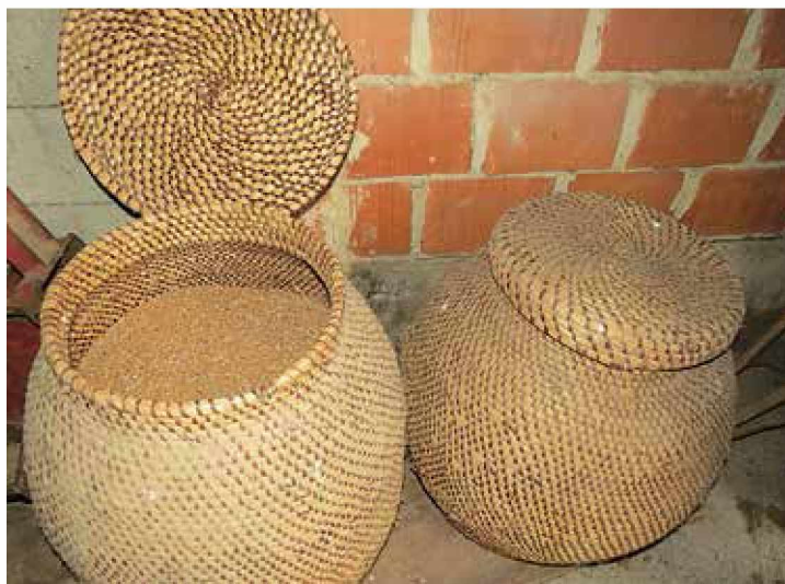
Žita so nekoč spravljali v pletene koše