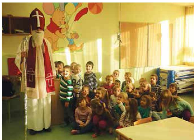
Otroci z Miklavžem