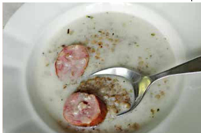
Mlečno juho lahko dodatno začínimo z domačo klobaso