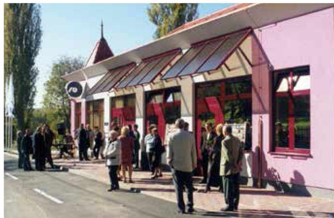
Ob otvoritvi banke v novi zgradbi leta 2001

mljiščem Pomurski banki. Ta je leta 2001 prešla direktno pod upravo NLB, oziroma v podružnico Pomurja.