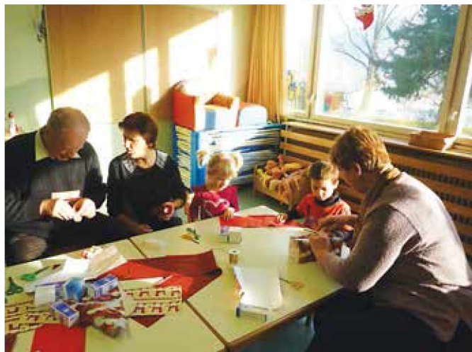
Novoletne okraske so izdelali otroci z dedki in babicami