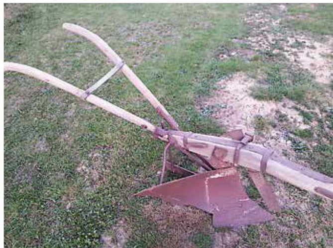
Lesen plug z železno desko

Pred samo setvijo žita je bilo potrebno pripraviti tla. Da bi zemlja dobro rodila, je bilo potrebno njivo pognojiti. Hlevski gnoj so »nakapali« na »kola«, tega so potem z živalsko vprego pripeljali na njivo, kjer so gnoj zmetali na kupe po njivi. Sledilo je težko delo »raztrošenje« gnoja po celi njivski površini, kar so počeli z vilami. Sledilo je oranje kakih 10 dni pred setvijo. Za to so uporabljali krave, vole in bogatejše kmetije tudi konje, katere so vpregli v jarem. Lesen plug je bil sestavljen iz lesenega droga, na koncu je bil lemež, ob strani lesena deska, ki je obračala zemljo, kasneje se je pojavila že železna deska. Največkrat so