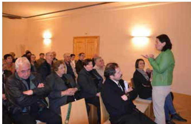
Na srečanju z rokodelci in vinarji