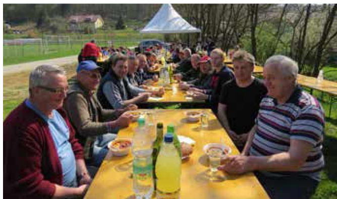
Udeleženci akcije na zasluženi malici