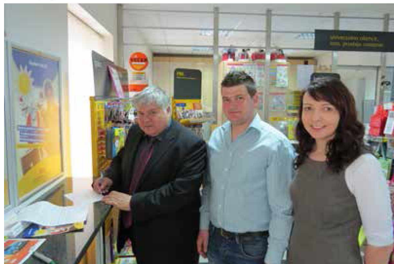
Župan je odprl osebni račun na pošti pri Gradu

S svojim prestopom k Poštni banki Slovenije sporoča vsem svojim občanom, da je odprtje bančnega računa na domači pošti pametna rešitev, saj je pošta v domačem kraju, dovolj blizu in odprta vsak dan do 17. ure, poslovanje pa se lahko ureja tudi s pomočjo pismonoše, ki pride na dom vsakemu občanu. Prav tako je poslovanje na domači pošti prijazno in enostavno.