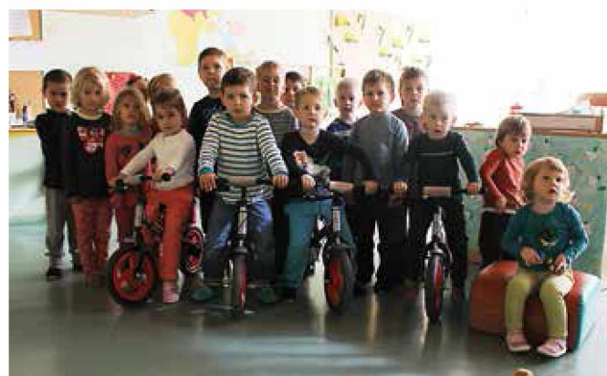
Otroci na poganjalcih