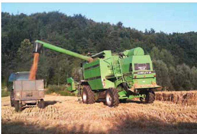
Žetev je danes s kombajnom enostavna. Po naših vaseh hodi kmetom s kombajnom »Žet« Darko Huber.

Zatem je že pripravljen sejalec žit. V naših krajih med najpogostejša žita še vedno spadata ječmen in pšenica, ponekod še rž in redkeje ajda, na večjih kmetijah pa največji del pridelka predstavlja kornjača. Vse to se seveda uporablja predvsem za hranjenje živali (goveda, prašiči). Ko je pridelek posejan, sledi škropljenje za zatiranje plevela, ponekod še dognojevanje z mineralnimi gnojili, ko pridelek že nekoliko zraste.