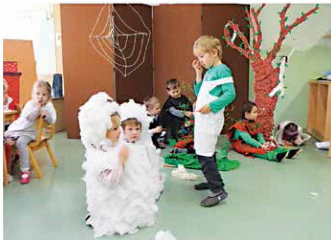
Predstava za mame