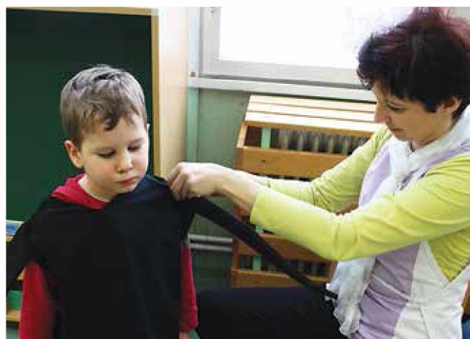
Sami smo si izdelali kostume