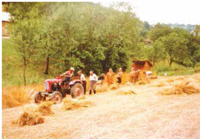
Žetev v Rankovi grabi konec sedemdesetih let