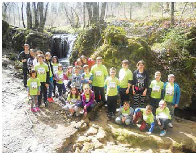
Bili smo v deželi čemaža ob brzicah v Beli krajini

V mesecu marcu smo se udeležili zaključnega izleta, in si- cer nas je petindvajset učencev šlo na izlet v Belo krajino, v vas Črmošnjice, kjer smo skupaj z OŠ Kobilje preživeli prekrasen dan. Izdelali smo si belokranjsko pisanico ter se odpravili po gozdni učni poti, polni čemaža.