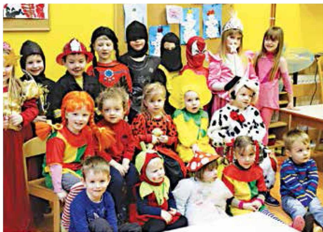
Pustne maske so otroci izdelali skupaj s starši

Meseca decembra je skupina mamic pripravila lutkovno-dramsko igrico z naslovom Babica Zima. To je bilo za otroke veliko doživetje, saj so mamice v vrtcu nastopale za otroke in ne otroci za mamice, kot je v navadi. Na vso moč so se potrudile in nam pripravile prečudovito popoldne. Takoj po novem letu pa so v drugi skupini začeli s pripravami na pust. Skupaj s starši so si izdelali čudovite maske, s katerimi so se predstavili na pustni torek. Otroci so na pustni torek v vrtcu rajali in se zabavali, žal pa nam vreme ni dopuščalo, da bi se sprehodili v pustni povorki skozi vas.