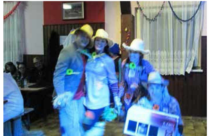
Prvonagrajena skupina maškar Ledavska strašila