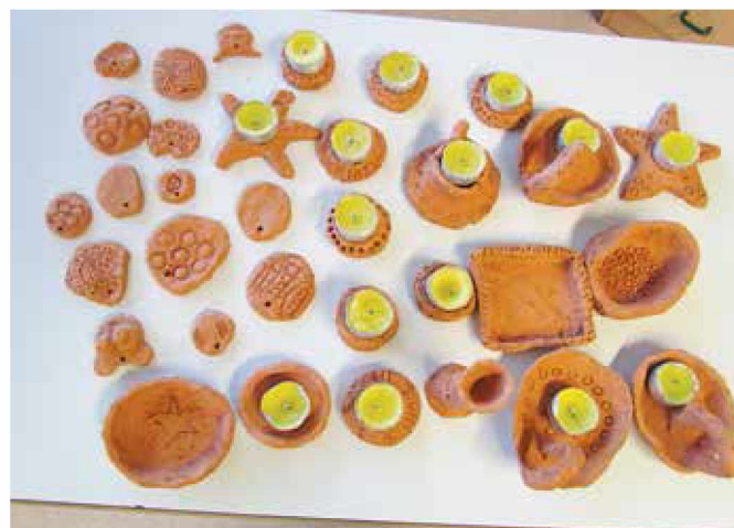
Tradicija lončarstva na OŠ Grad se nadaljuje

Nekaj svojih izdelkov smo predstavili že na božičnem bazarju, in sicer smo izdelali svečnike, posodice ter obeske za eterično olje. Skupina začetnikov je izdelala še indijan-