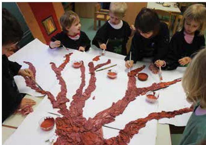
Otroci so pripravili sceno