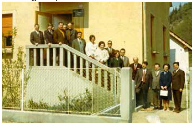
Otvoritev banke v Klementovi hiši leta 1971

Prva banka pri Gradu v takšni obliki naj bi svoja vrata odprla že leta 1971. Takrat se je namreč pokazal predvsem interes po nakupovanju deviz, saj je mnogo kateri domačin že delal v bližnji Avstriji ali Nemčiji. Ljubljanska banka, kot se je takrat imenovala, pri Gradu še ni imela svojih prostorov, je pa poslovala v prostorih stare Klementove hiše. To je bil tudi čas, ko so se po šolah začele tako imenovane »šolske hranilnice«. Za zanimivost: poslovalnica Ljubljanske banke pri Gradu se je odprla že leto dni prej kot na primer poslovalnica v Beltincih. Na Goričkem takrat v sedemdesetih letih drugje kot pri Gradu še ni bilo nobene banke.