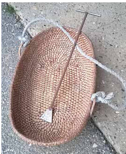
Sejanca in železna lopatica za iztrebljanje plevla

več tako pogosta. V začetku meseca junija se je po rdeči deltelji sejalo tudi proso, ki je prav tako danes redkost. Po žetvi žita in pšenice pa se je sejala tudi bela repa. In kakšna je bila setev nekoč? Ob tem se moj sogovornik nasmehne in me popelje do prostora, kjer še danes hrani »sejanco« (iz slame pletena košara), ki jo še vedno uporablja, predvsem za setev na obronkih njive. Zelo pomembna pa je seveda tudi sama priprava, tako njive kakor tudi samih žit. Njivo je seveda bilo potrebno predhodno dobro pripraviti na setev. Zelo pomembnega ročnega