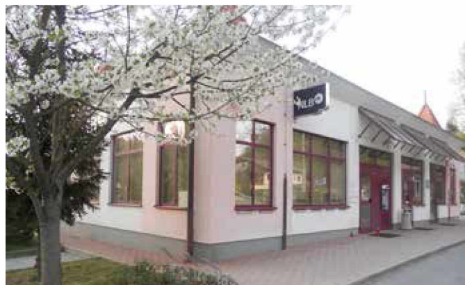
S 1. aprilom je pred zaprto poslovalnico NLB Grad zagorela sveča.