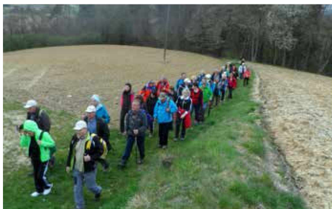
Pohodniki na poti po Kruplivniku