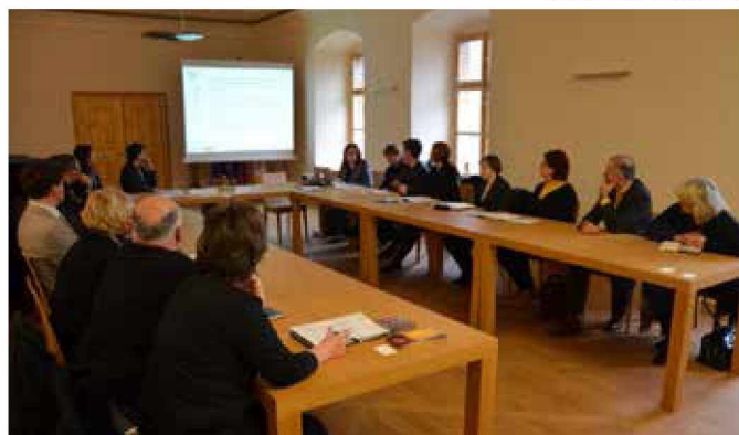
Na posvetu o dvorcih in gradovih v Pomurju