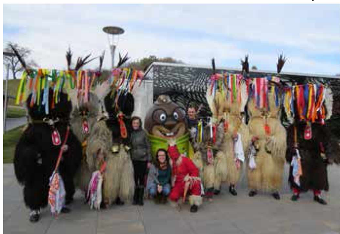
Olija so obiskali tudi kurenti