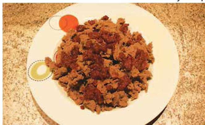
Ajdovi žganci z ocvirki