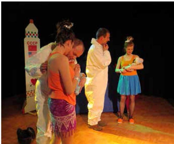
Na Marsu se je rodila ljubezen