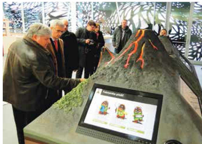
Minister je poleg doživljajskega spoznal tudi izobraževalni del Vulkanije