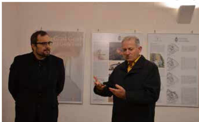
Na gradu je bila odprta tudi razstava o obnovi gradu