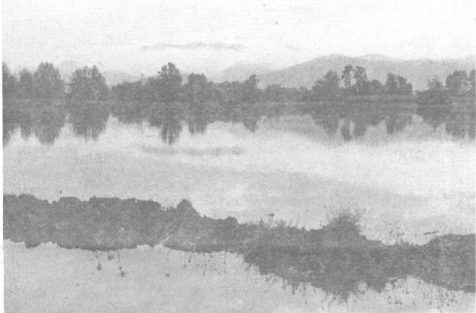
Poplavno področje pri Bevkah

Ta izlet lahko prijetno zaokrožimo z ogledom obnovljene zgradbe starega vrhniškega