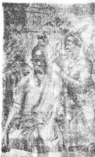
Ženi iz PLEMENA ZULU

LJUBLJANA, 9. januarja. Sinoči se je posrečilo ljubljanskim detektivom, da so izsledili nekega Škapina, ki je med naj-