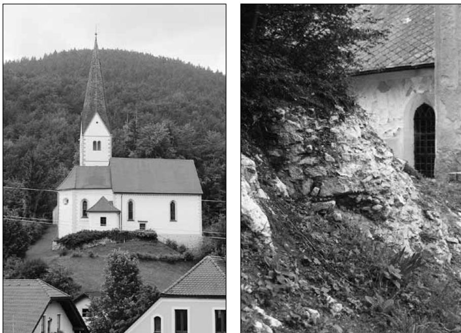
Slika 2. Lokacija nekdanjega gradu Katzenstein s cerkvijo sv. Florjana, foto M. B.; desno ostanki gradu, ki so jih odkrila arheološka izkopavanja, foto Tone Ravnikar; fototeka Muzeja Velenje.

razkriva, da je bil Ciprijan Villanders zet Dipolda Katzensteinerja. Tolmačen je bil v duhu dokazovanja pomena in vpliva, ki ga je rodbina izkazovala s poročanjem prek deželnih meja. 84