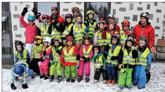
Udeleženci začetnega smučarskega tečaja

Otroci iz nazarskega vrtca so izkoristili priprave na svetovni dan snega, saj so teden dni po nekaj ur preživeli v mali smučarski areni na Golteh. Zraven so bili spremljevalci iz vrtca, zadnjega dne pa tudi starši ali bližnji sorodniki. Strokovni del pouka smučanja in zaključno tekmovalje je izvajala smučarska šola Športnega društva DaSki TEAM iz Mozirja, ki je različne aktivnosti pod vodstvom Davida Pauliča organizirala že v lanskem decembru.