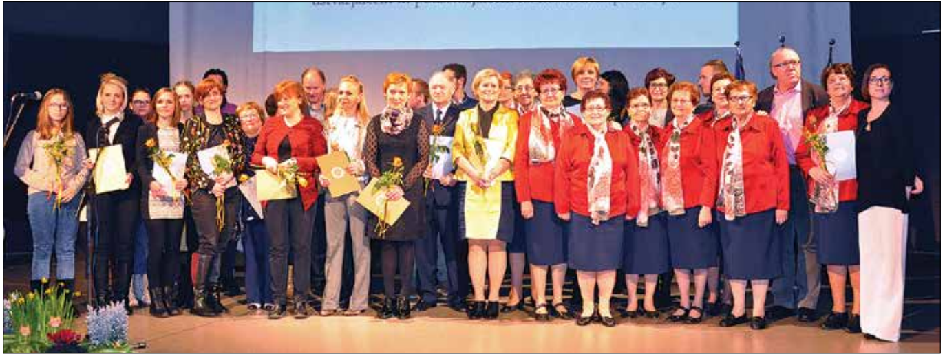
Na predvečer kulturnega praznika so ustvarjalcem in poustvarjalce naše doline podelili priznanja za delo na področju ljubiteljske kulture.