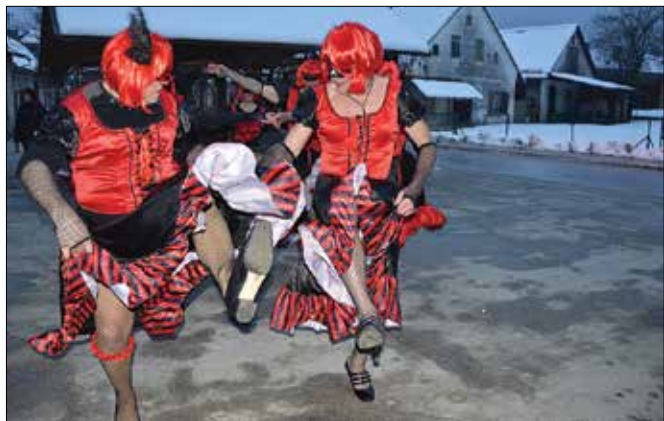
Ekstravagantne »plesalke« med usklajeno koreografijo