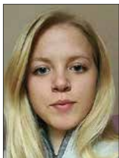
Piše: Neža Hudournik

Zadnja štiri leta sem sanjala o eksotičnem potovanju. Ko so končno prišle najdaljše počitnice mojega življenja, sva z mamo našli Borneo, tretji največji otok na svetu, ki še ni preveč skomercializiran, je pa v okviru mojih finančnih zmoglosti.