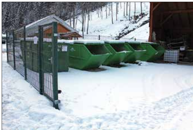
Zbirno mesto na Produ je začelo z rednim tedenskim obratovanjem.

Zbirno mesto je locirano na Produ v Krnici, v bližini tehnične trgovine. Namenjeno je le za odlaganje odpadkov iz gospodinjstev, ne pa tudi od podjetij. Torej sprejemajo odpadke le v količi-