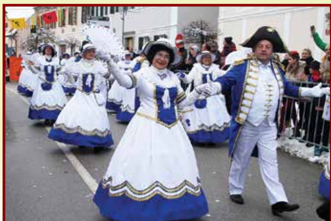
Pustne skupine iz srbskega Leskovca so vedno najbolj pisane.