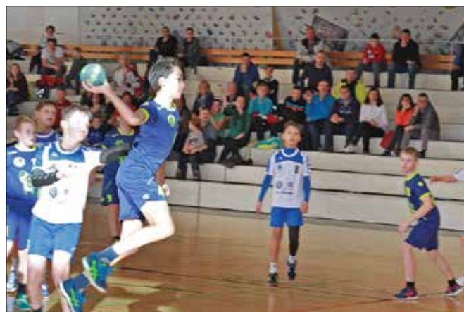
Domači igralci so dobro napadali, a so bili gostje iz Slovenj Gradca premočan nasprotnik.

V mozirski športni dvorani je bil 21. januarja pravi praznik rokometarjev. Uvodoma je bila odigrana tekma 8. kroga državnega prvenstva mlajših dečkov B med varovanci Sebastjana Soviča in trenutno vodilnimi dečki RK Slovenj Gradec. V nadaljevanju je bil odigran še turnir mlajših dečkov C.