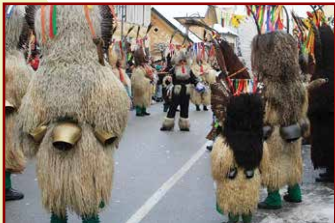
Koranti Demoni na Golteh, kjer bi radi zimsko sezono podaljšali do maja, niso zaželeni.