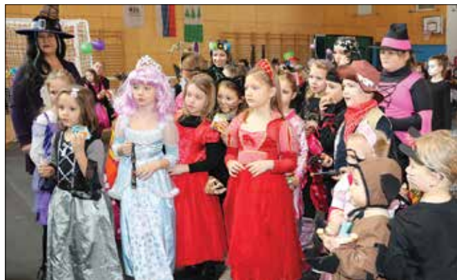
V nazarski športni dvorani so ob animatorjih zaplesale male maškare.

Imate kaj za pusta hrusta, so se spraševale številne male in velike maske, ki so rajale v Radmirju, Mozirju in Nazarjah. Karnevalsko druženje otrok je v nazarski športni dvorani, kot že vrsto let do sedaj, pripravilo domače turistično društvo. Na njem so ob animatorjih zaplesale različne osebnosti iz filmov, risank, pravljic in domišljije. Lačne želodčke so zapolnile presete in sokovi, marsikateri starš pa je