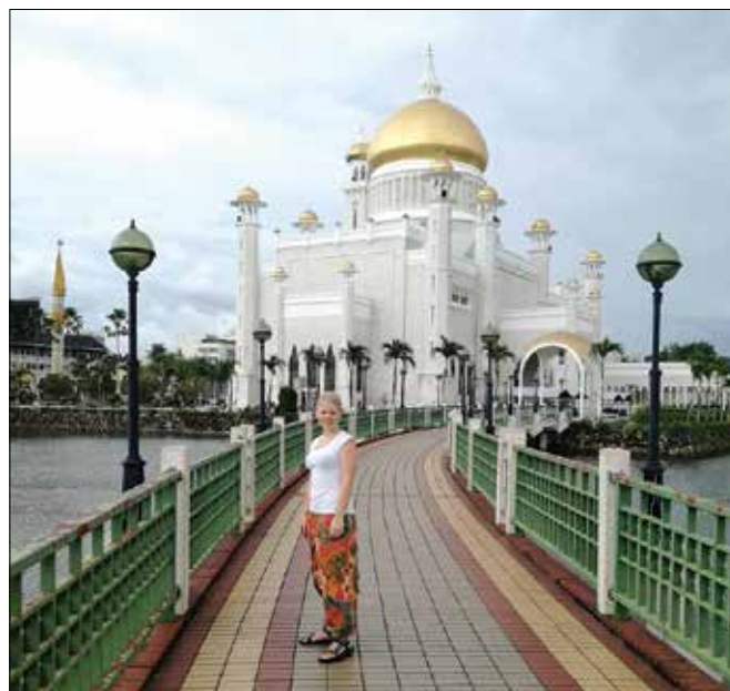
V glavnem mestu sultanata Brunei

V sultanat Brunei sva prišli z avtobusom in, ker je tu uživanja alkohola prepovedano, so ob vstopu od vseh potnikov samo naju, Evropejki vprašali, če imava