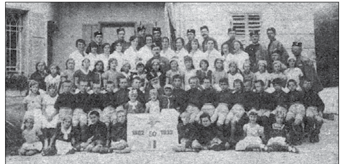
Ob polstoletnici Sokola v Mozirju

Ob prihodu okupatorja so prav vrste sokolov prve občutile nasilje Nemcev, dom pa je uporabljala Štajerska domovinska zveza in seveda okupator za svoje prireditve. Leta 1946 so