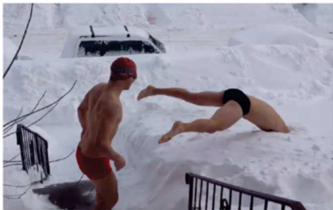
Potrudi se! Sosed je že našel svoj avto.

Klicatelj: „Halo, Houston, kličem iz Slovenije, Mozirja. Imam problem.“