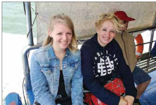
Z mamo na ladji

Potovanje je zame več kot ogledovanje znamenitosti, čar mu po mojem mnenju da spoznavanje tuje kulture, ki jo najbolje in najlažje spoznamo preko domačinov. Prav zaradi novih ljudi, ki sem jih spoznala, je bilo to potovanje zame res nepozabna izkušnja, ki se mi je za vedno vtisnila v spomin.