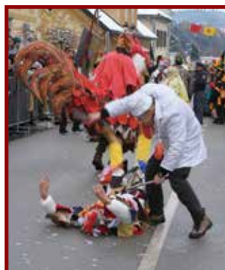
Šoštanjčani so se odločili svoje kure poklati kar v Mozirju.