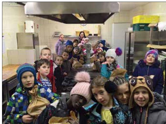
Učenci 3. razreda so na delavnici po lastnih besedah zelo uživali.

Zavod Savinja so v sredo, 24. januarja, obiskali prav posebni gostje. Učenci waldorfske šole iz Žalca so se v okviru programa spoznavanja starih poklicev mudili v Fašunovi hiši na Ljubnem ob Savinji, kjer so imeli delavnico peke krušnega peciva na star način.