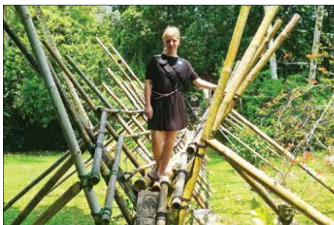
V sarawaški kulturni vasi

Ker let iz Milana na Borneo ni bil direkten, sva do Kuchinga – mesta mačk – potrebovali 35 ur. Zadnji uro in pol dolg polet iz Kuala Lum-