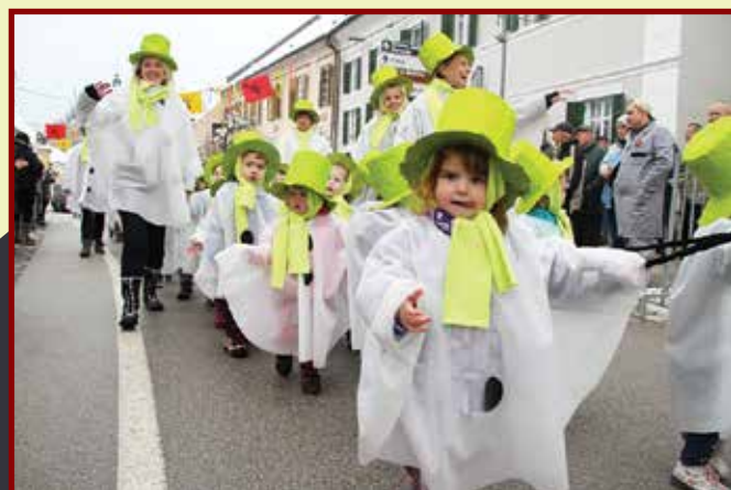
Iz vrtca so na povorko prišli dimnikarji.