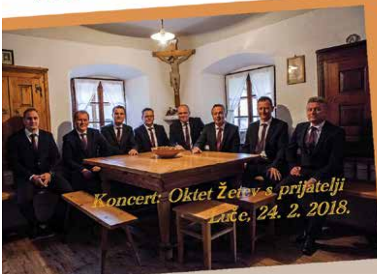
Koncert: Oktet Žetev s prijatelji Luče, 24. 2. 2018.

ki bo v soboto, 24. februarja, v avli osnovne šole Luče ob 19. uri.