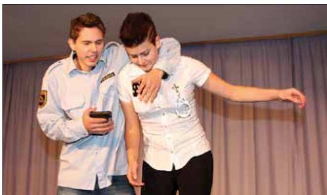
Tudi policaji so samo ljudje in včasih pogledajo globje v kozarec.