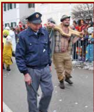
V Šoštanju so se reševanja kriminala lotili zelo resno.