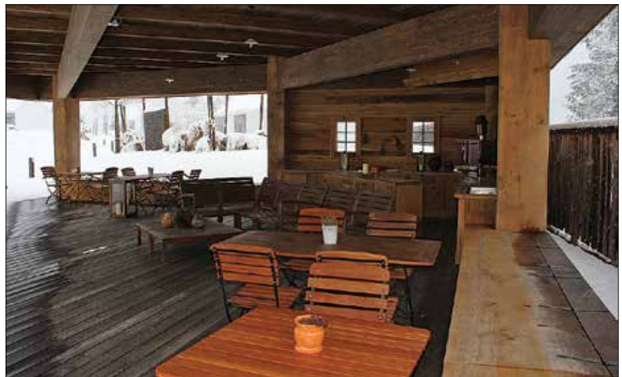
V glampingu imajo na voljo tudi zunanjo restavracijo, ki je v času poletja dobro obiskana.

sobe, saj imajo tudi svojo kopalnico in jacuzzi. Glamping sam ima še biobazen, velnes, savno, masažno sobo, lastno lekarno, konferenčno sobo in restavracijo.