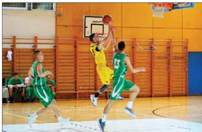
Košarkarji KK Nazarje in KK Janče so prikazali hitro igro in bili strelsko razpoloženi, o čemer priča rezultat tekme 91:79.

Na sobotni tekmi je tako štela samo zmaga proti Jančam iz Ljubljane, katere so v začetku decembra premagali na gostovanju v Ljubljani s 83:98. Pomen tekme je privabil lepo število ljubiteljev košarke. Ti so lahko uživali v hitri košarkarski igri, košarkarji pa so bili strelsko razpo-