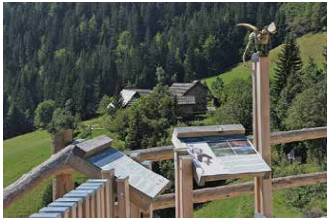
Spomenik državnega pomena, gospodarsko poslopje domačije Podolševa 20 ob Solčavski panoramski cesti je iz dveh delno zidanih, delno lesenih vzporedno postavljenih stavb, ki ju povezuje mostovž. V njem so orodja in vrsta naprav, ki jih je preko vodnega kolesa in transmisijskega mehanizma sprva poganjala voda, nato elektrika.

mena. Gre za gospodarsko poslopje domačije Podolševa 20, ki spada med profano stavbno dedišči-