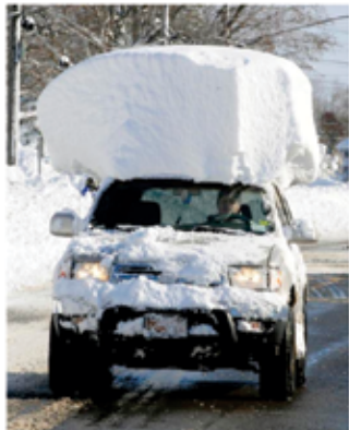
Le zakaj me vsi čudno gledajo? Da nisem pozabil vklopiti luči?

Klicatelj: „Prvič sem v vlogi kurenta na karnevalu in