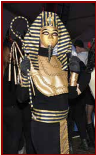
Prvo nagrajena maska Kleopatrina