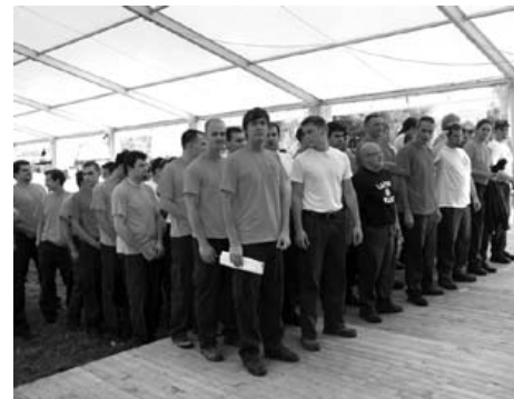
Meddruštvenega gasilskega tekmovanja se je udeležilo 15 ekip.