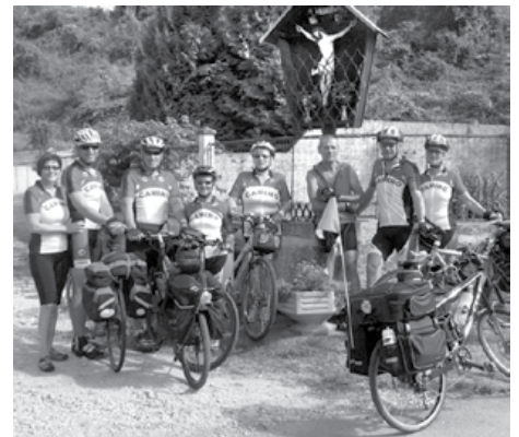
Kolesarji – romarji na startu v Slovenski vasi.