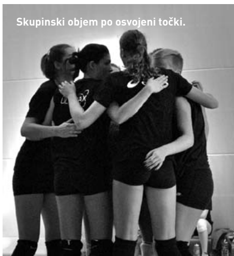
Skupinski objem po osvojeni točki.