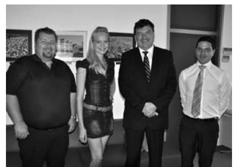
Lani je za naslov miss čestitalo občinsko vodstvo.