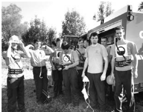
Ekipa Velikega Mlačevega se pripravlja na napad.