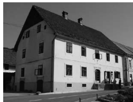
Plešce: Palscava hiša.