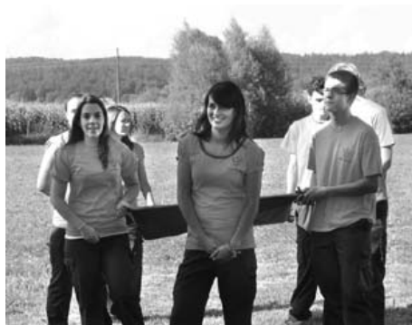
Mladi mlačevski gasilci in gasilke so prinesli tekmovalno zastavo na prireditveni prostor.