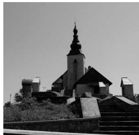
Sveta Gora na Čabranskem.