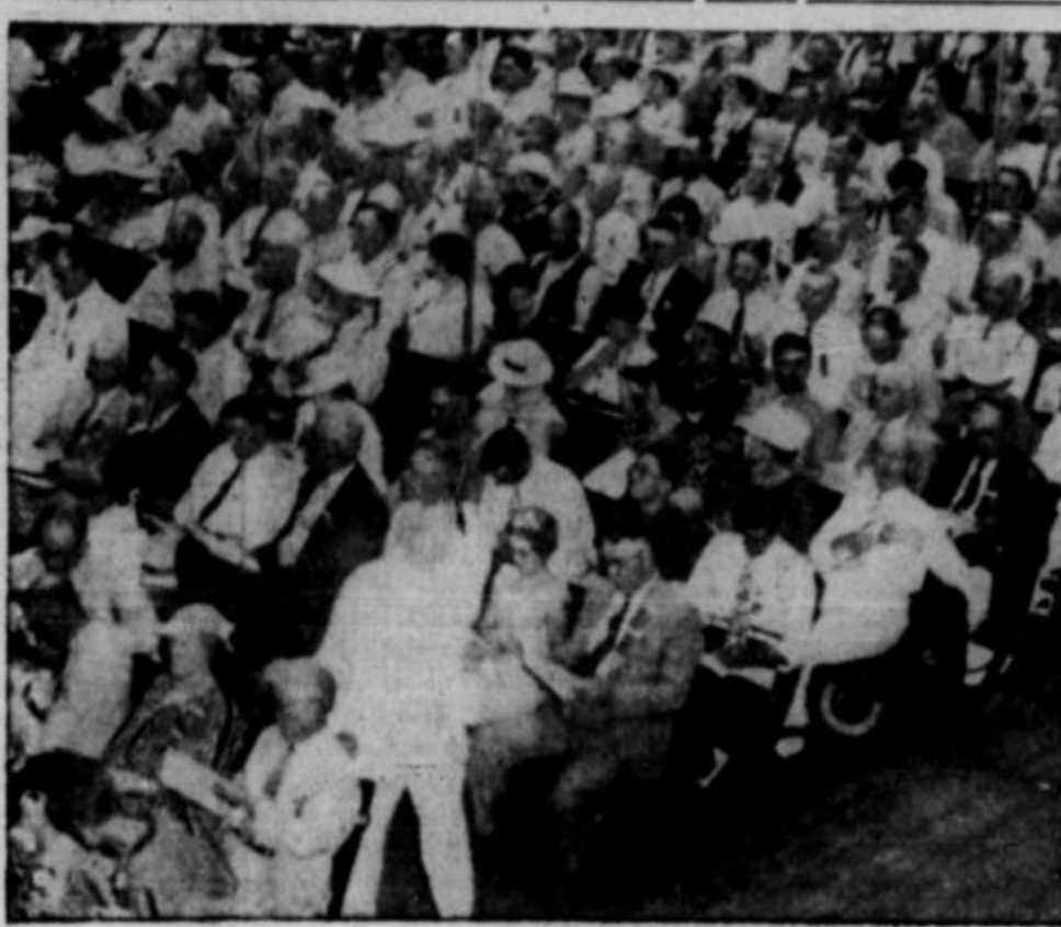
Norman Thomas je na nedavni konvenciji townsendovcev v Clevelandu med drugim dejal, da je njihov načrt pod kapitalizmom neizvedljiv. "Vi ne morete ohraniti sedanje uredbe in pričakovati, da boste v nji prejemali še enkrat toliko kadar boste prekoračili 60. leto, ne da bi delali, kot pa prejimate za trdo delo pred 60. letom. Bilo bi pametneje, če bi vi zahtevali: Plačajte delavcem po vrednosti njihove produktivne sile!" Socialna sigurnost za stare delavce je v sedanji družbi nemogoča, je dejal Thomas, ker je niti mladi nimajo. Townsendovce, izmed katerih jih je ena skupina na tej sliki, pa je povabil v soc. stranko, ki deluje za odpravo pomanjkanja v izobilju, zato da bo ustvarila blagostanje v izobilju.

Gibanje za penzije, ki je napačno zasnovano