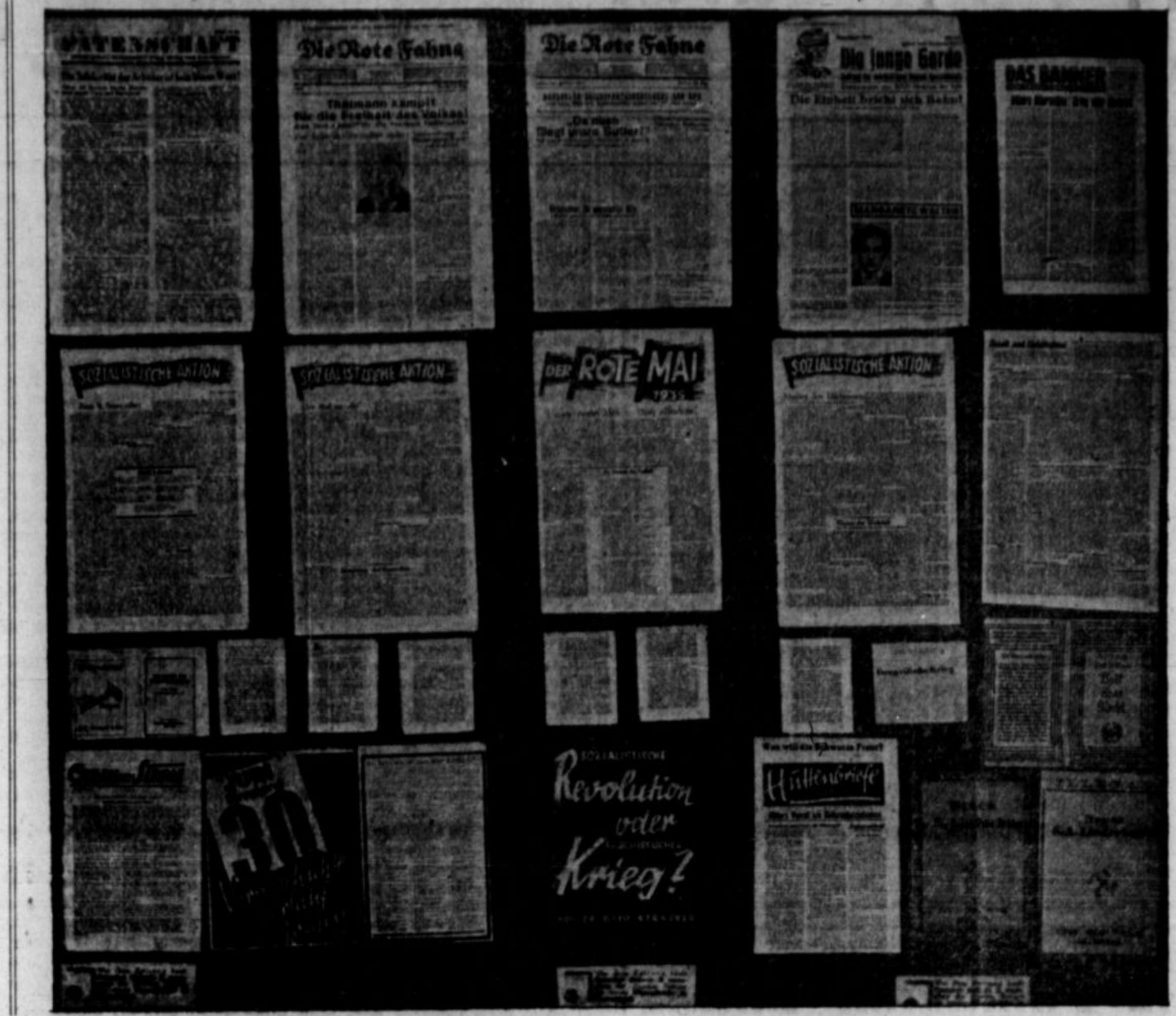
Na sliki je fascimile raznih socialističnih in drugih protinacijskih listov, ki so tiskani na najtanjem papirju in v takih oblikah, da se jih širi v Nemčiji v čimvečjem številu. Vsa distribucija je organizirana tajno. Kadar oolast koga zalogi, da ta ali oni izmed gorj označenih listov širi, ga ob-

sodi na mučenje in dolge zaporne kazni. Tudi smrtno kazni niso izjema za take prestopke. Dalje je strogo prepovedano take liste prejemati in čitati. Kdor se pregreši, je kaznovan od 6 tednov do par let zaporu. Prav tako stroge kazni izrekajo oblasti nad osimi, ki poslušajo radio govore iz Rusije.